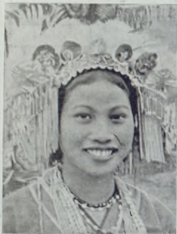
Muchacha de Formosa, aborigen, en traje de danza

gran cantidad de abonos utilizados aumentaban el rendimiento de las tierras pobres. Los arrozales acaparaban ya el 80 por ciento de las 900.000 hectáreas cultivables, y a continuación venían las plantaciones de té y de caña de azúcar. El alcanforero, otra fuente de riqueza del país suministraba 3.000 toneladas de aceite, un 95 por ciento de producción mundial. Por primera vez en 1911, los directivos nacionalistas y formosanos afirmaron, que a pesar de la crisis el balance económico de la isla estaba próximo al equilibrio. Sin duda alguna debe Formosa al Japón la buena situación que actualmente disfruta.