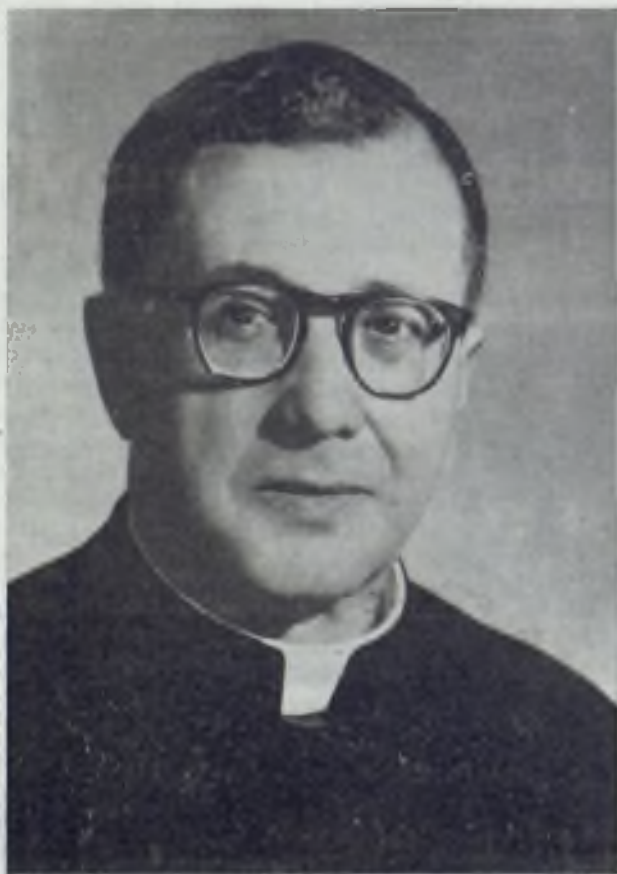
Mons. J. M. Escrivá.

Primeras semanas de otoño de 1960. Estamos en el Colegio Romano de la Santa Cruz. En una calle ancha y ruidosa, de mucha circulación, que atraviesa uno de los barrios residenciales de la Urbe por antonomasia, ha ido surgiendo a lo largo de estos últimos años un grupo de edificios, que en nada desentonan de los demás de la calle. Vistos desde dentro, sus fachadas movidas y de diferentes alturas, rodean una «villa vecchia», de tipo toscano «quattrocentesco», que ya existía allí, y en torno a la cual las nuevas construcciones han dejado libre una serie de «cortili». El conjunto está destinado a albergar la Casa Generalicia del Opus Dei .