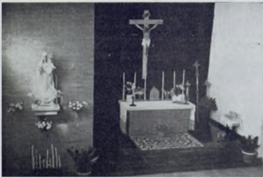
Altar mayor de la Capilla

—No se colocó la primera piedra que usted dice, pues creo que