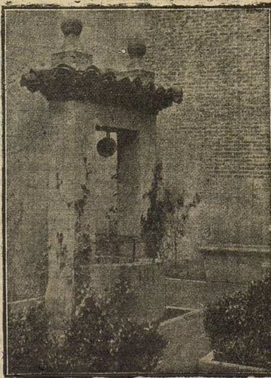
Typico jardín de la casa de Cervantes en Valladolid.

El dispositivo estratégico de tales fuerzas es malo, y tal vez por eso recela el general Sarrail de emprender operaciones ofensivas. Lo es porque la actitud de Grecia resulta cada vez más equivocada, si los alemanes desembarcasen por el Struma y penetrasen por el territorio griego, el frente de Vardar podría ser envuelto.