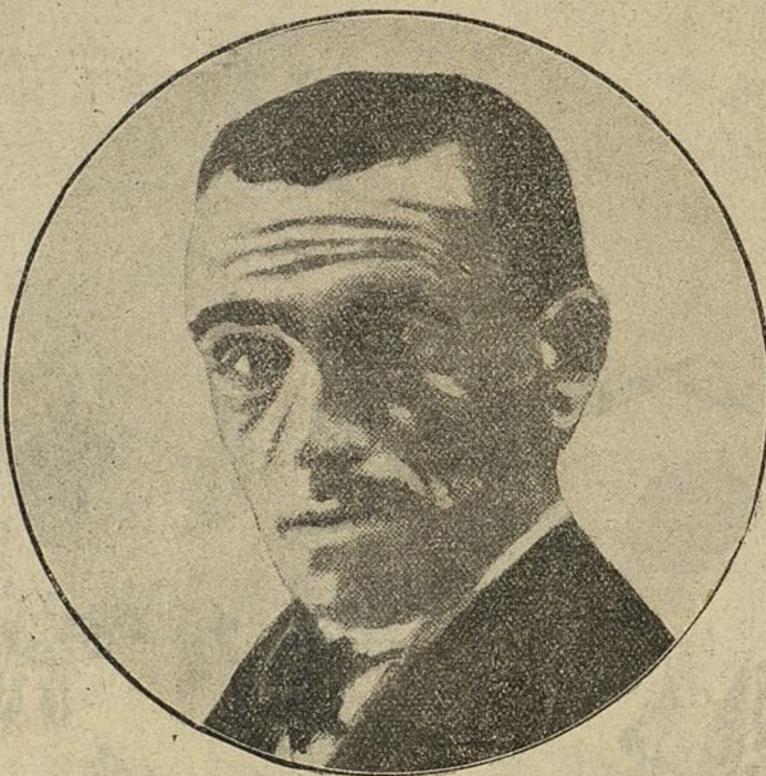
D. Domingo Orueta, sabio ingeniero español que ha descubierto tesoros inmensos en la sierra de Ronda.

Pues en esas condiciones, ocultando el objeto de sus trabajos para que un error no pudiera traer aparejado el descrédito para el procedimiento científico, lleno de modestia, con plétora de generosidad y de patriotismo. Don Domingo Orueta buscó en la sierra de Ronda el medio de facilitar á España riqueza y