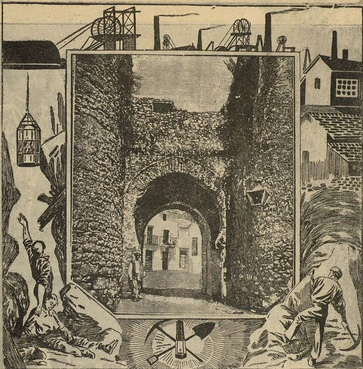
Puerta árabe que da entrada a la pintoresca ciudad de Ronda. Esta importante población será en el porvenir el mayor centro minero del mundo, si se confirman los descubrimientos del ingeniero español señor Orueta. Las fábricas, los trenes, los prodigios de la industria surgirán entre las ruinas de los moros.

un industrial. Se están montando, arreglándolas, y en febrero empezarán su obra. Los trabajos durarán hasta julio y habrán de suspenderse durante los dos meses siguientes para continuar después.