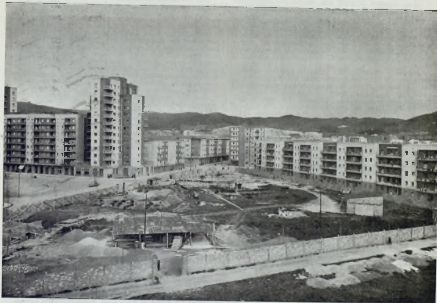
Vista parcial de la magnífica realización «Viviendas del Congreso» en primer término el solar donde se levantará el Templo.

El coste de ejecución de las obras ascenderá a DOS MILLONES OCHOCIENTAS NOVENTA MIL DOSCIENTAS TREINTA Y CINCO PESETAS (2.890.235,00 ptas.) realizándose en el plazo de dos años.