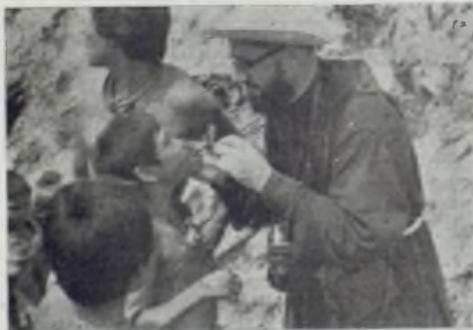
El misionero da a besar el crucifijo a unos niños motilones

Como en el día anterior, continuamos río abajo, hasta que conseguimos por fin lo que buscábamos, la desembocadura de la segunda cabecera del Aricuaisá. En honor de la fiesta del día lo llamamos río Magdalena. Al sumarse el caudal de sus aguas a las del Arokamu, nos resulta casi imposible vadearlo. Con el fin de atravesarlo en el medio del valle o cañón que se extiende de norte a sur desde el Centro Misional del Tucuco hasta los motilones, tratamos de remontarlo, pero la corriente hace muy lento nuestro avance. En estos intentos encontramos la primera señal inequívoca de la presencia de los motilones: una represa, construida con grandes piedras y hojas de bijao, que en parte desvía la corriente del río