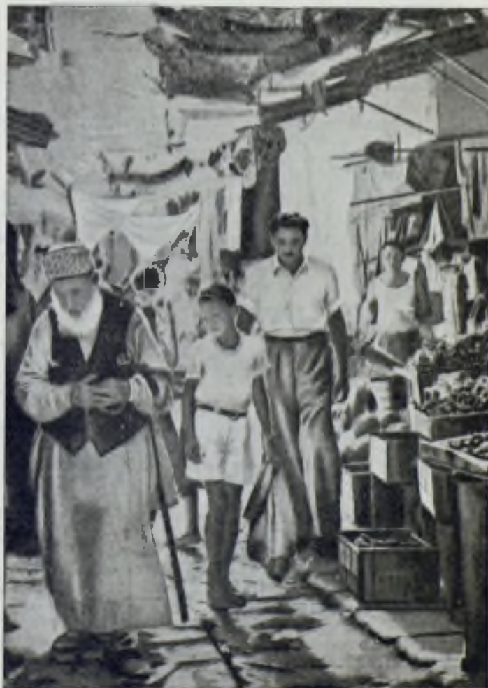
Una calle de Israel. —>