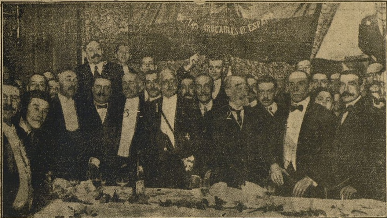
Banquete conmemorativo de la fundación de la Asociación de empleados y obreros de los ferrocarriles de España. El presidente, Sr. Saavedra (1), con los ministros de Fomento, Sr. Salvador (2), y el de Hacienda, Sr. Urzáiz.

PARA conmemorar el XXVIII aniversario de la fundación de la Asociación general de empleados y obreros de ferrocarriles de España, se ha celebrado un banquete al que asistieron unos 350 asociados.