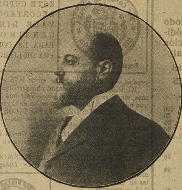
D. Bernardo Mateo Sagasta, uno de los hombres que más valen en España, que ha sido recibido el domingo último en la Academia de Ciencias.

Las miserias del mundo no pueden ser remediadas por la ayuda física tan sólo; mientras la naturaleza del hombre no cambie, esas necesidades físicas surgirán siempre y las desventuras serán continuamente sentidas, sin que ninguna suma de ayuda física pueda remediarnos completamente. La única solución á este problema es hacer que la humanidad sea pura. La ignorancia es la madre de todos los males y miserias que vemos. Cuando el hombre tenga luz, sea puro y espiritualmente fuerte y educado, entonces cesará toda miseria en el mundo, pero no antes. Aunque convirtamos cada casa del país en un asilo de caridad y llenemos la tierra de hospitales.