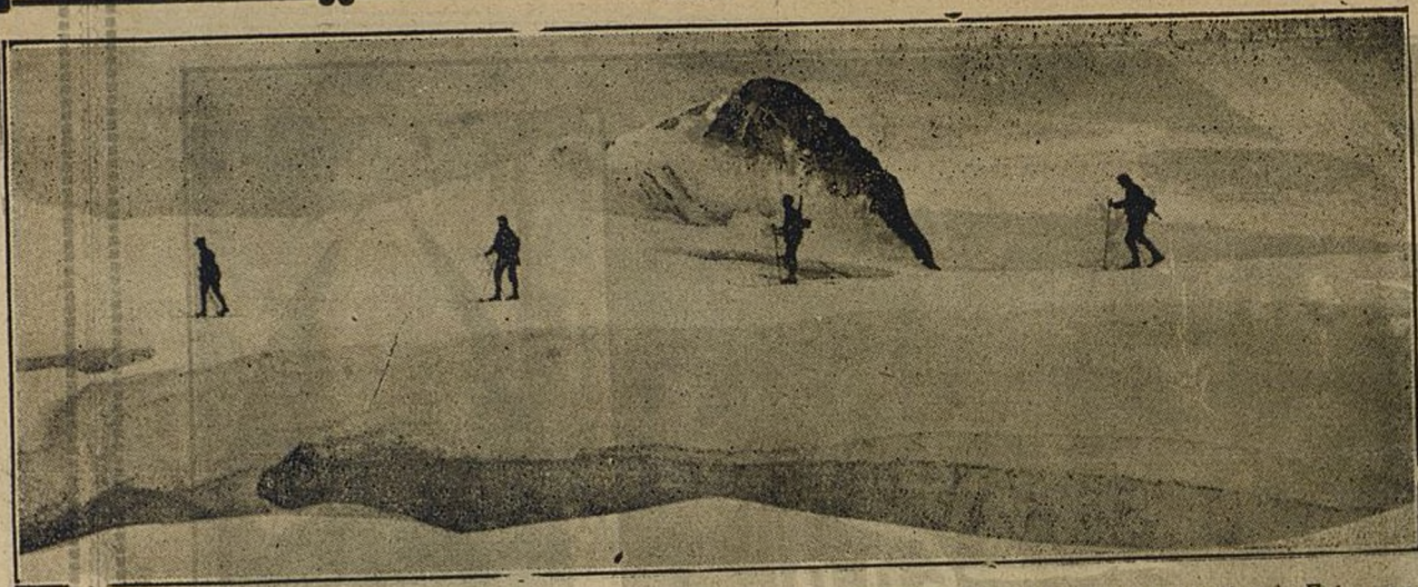
Soldados suizos, andando con skis sobre la nieve en la montaña de Blindenhorn (á 11.095 pies de altura). Estos centinelas, los más altos de Europa, vigilan para que no se rompa la neutralidad en la frontera italo-suiza.