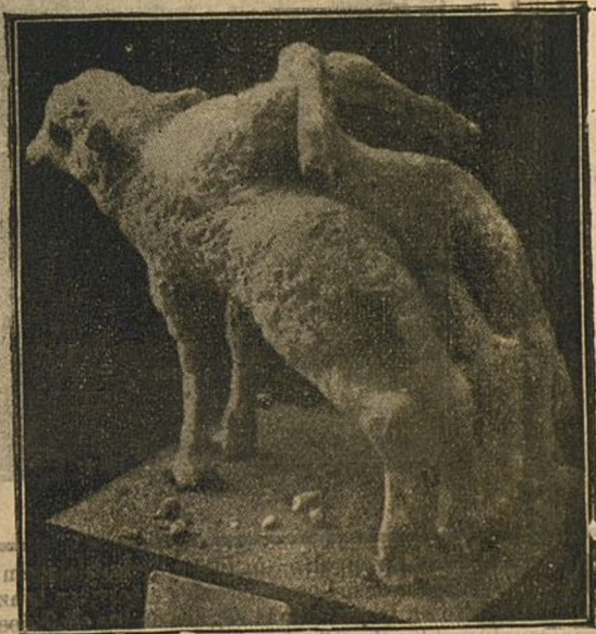
Un verdadero fenómeno. Borrego con una cabeza, dos cuerpos, ocho patas, dos orejas y dos rabos que ha sido llevado á Córdoba para embalsamar

El voluntario más viejo que existe en el ejército inglés, es sin duda Charles Farmer. Tiene setenta y ocho años de edad. Hizo como soldado raso la campaña de Crimea, y actualmente no ha querido aceptar ni aun siquiera el rango de cabo. Ha dicho que la mejor situación militar es la del simple soldado. Su aspecto físico es el de un hombre de cuarenta años.