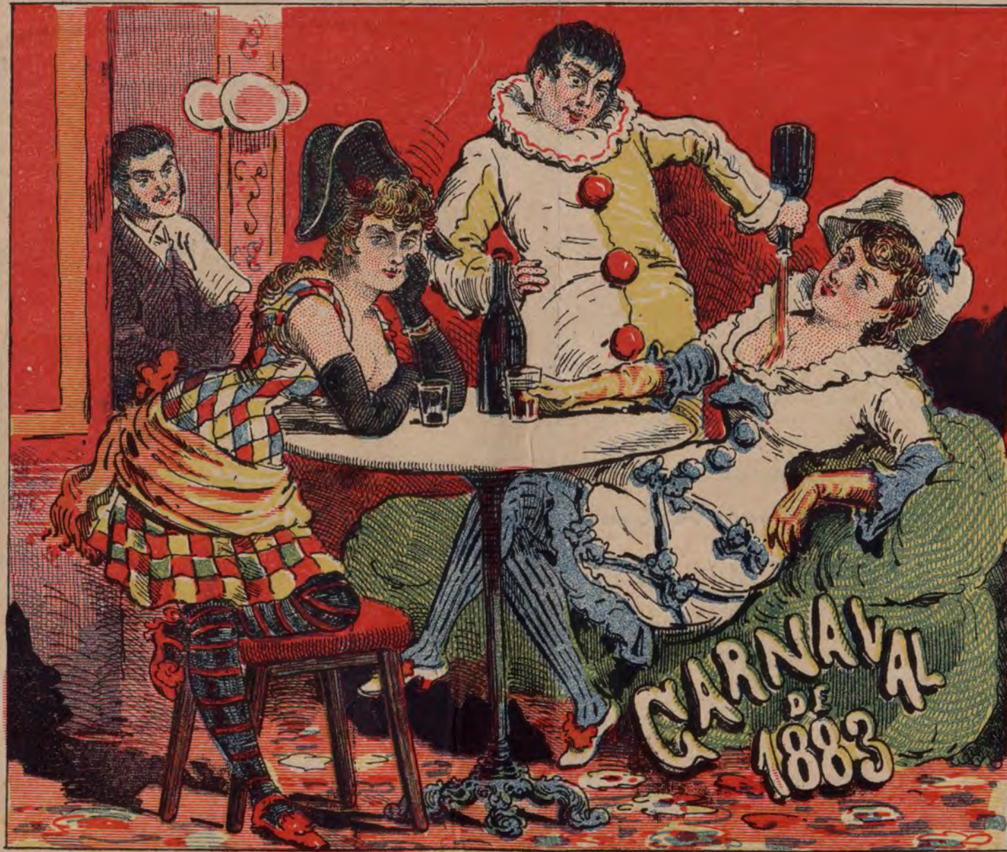
Alegoria del Carnaval