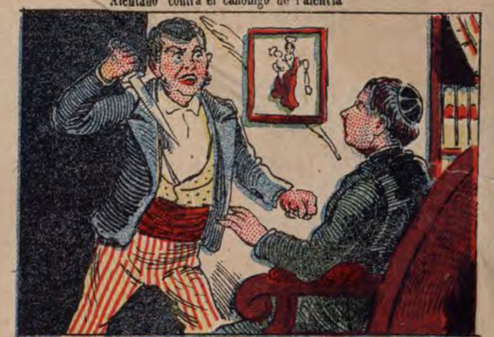
Atentado contra el canónigo de Palencia