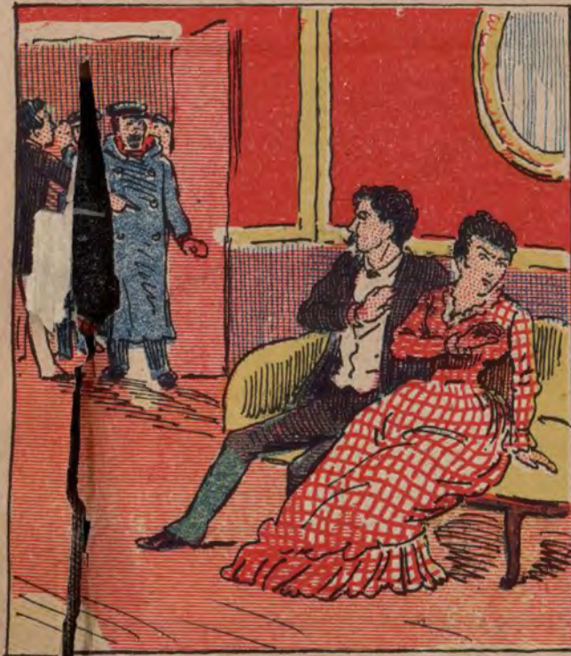
Suceso de la calle de Embajadores