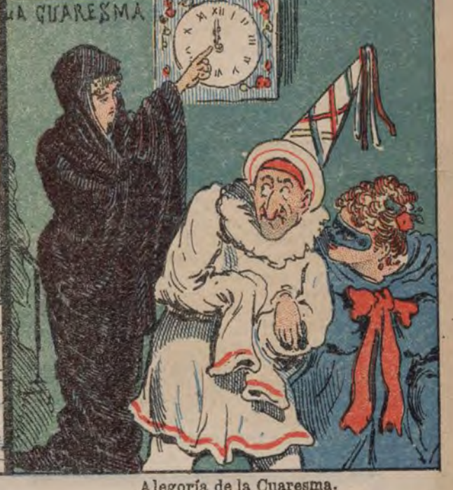
Alegoría de la Cuaresma.