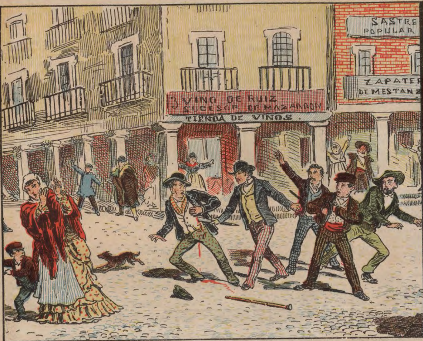
Reyerta en la Plaza de Santa Cruz (Madrid).