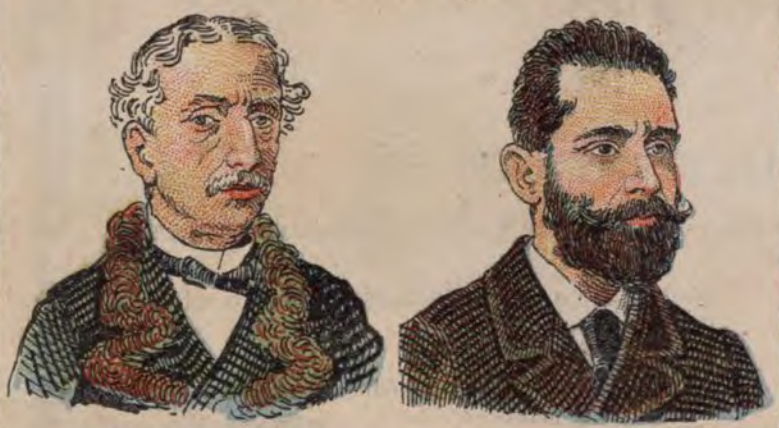
Don José Abascal, Alcalde popular de Madrid.