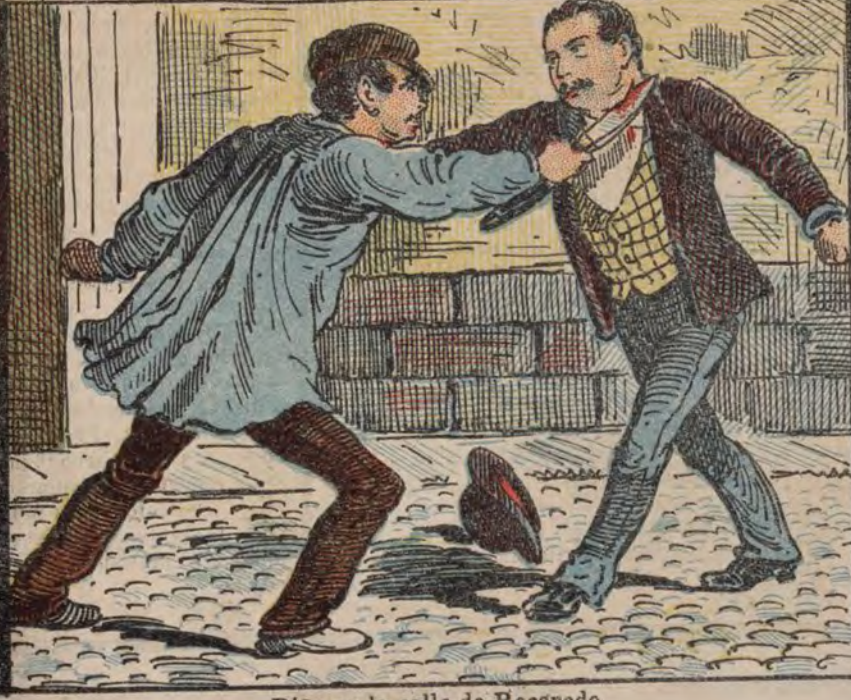
Riña en la calle de Recaredo.