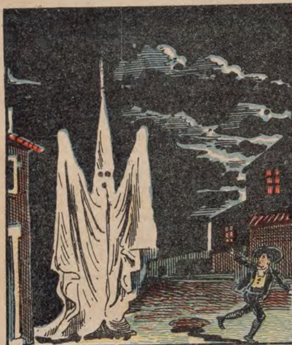
El fantasma de Belle-Ville (Francia).