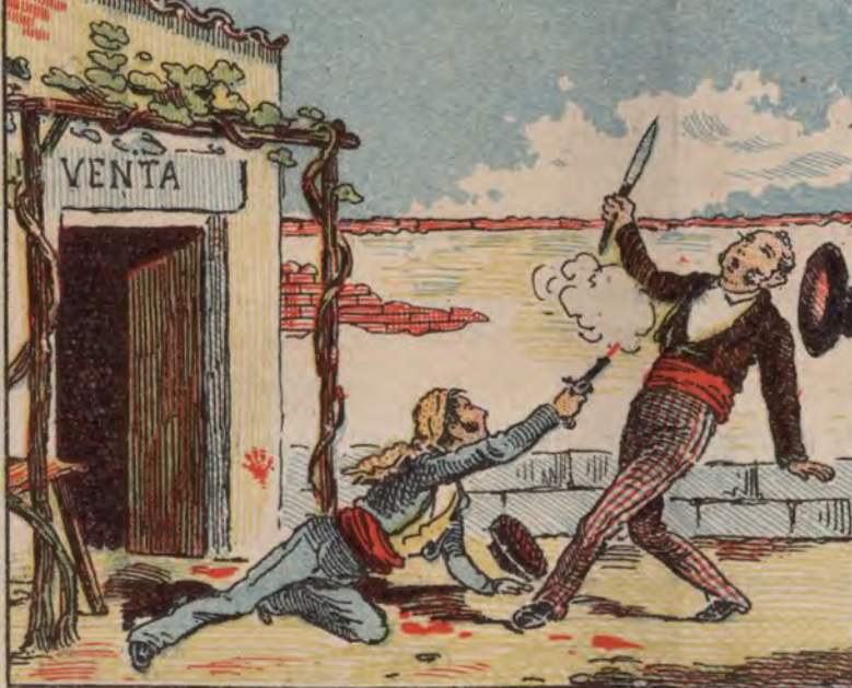
El suceso de Sevilla.