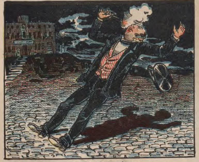
Suicidio de un cochero.