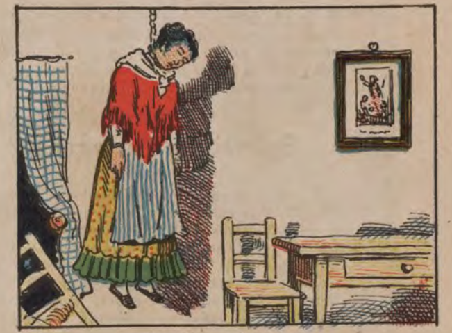
Suicidio en Cartagena.