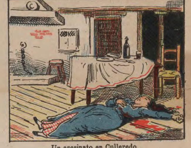
Un asesinato en Colliredo.