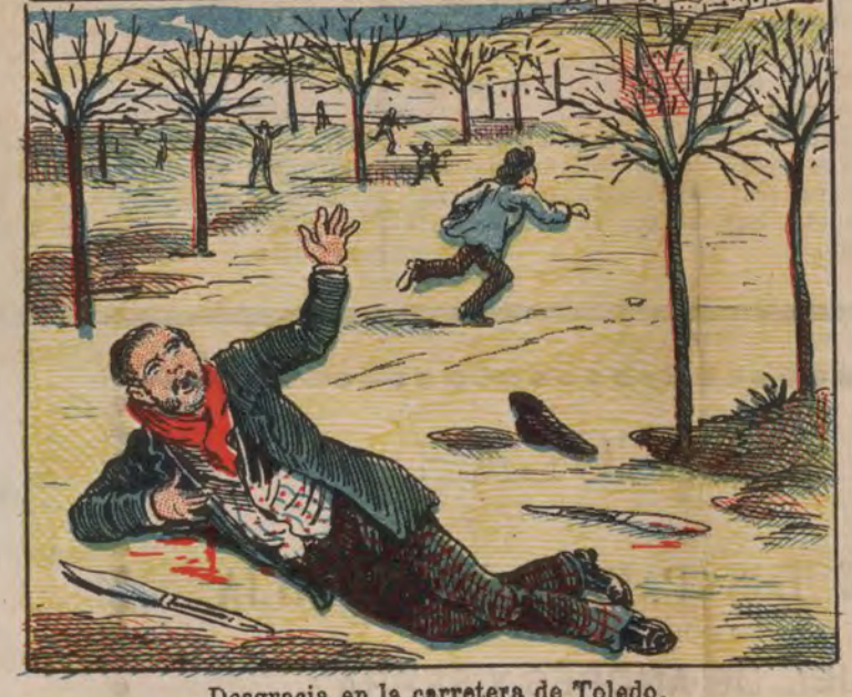
Desgracia en la carretera de Toledo.