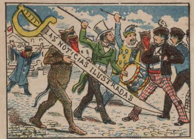
Suceso en la Plaza de las Cortes.