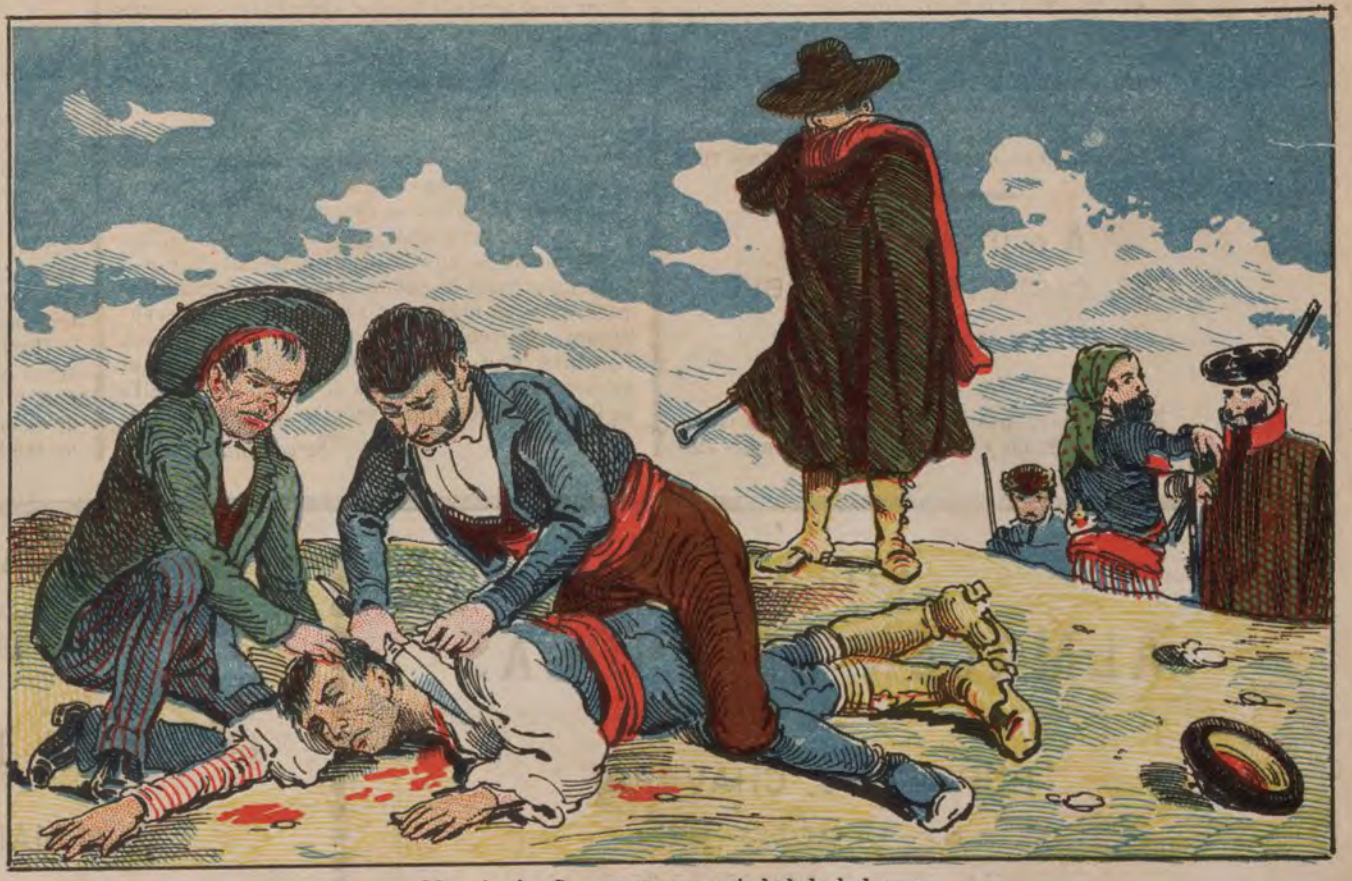
Muerte de Gage por una sociedad de ladrones.