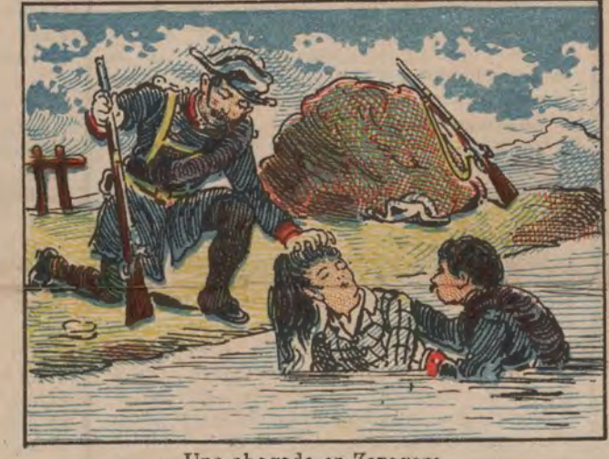
Una ahogada en Zaragoza.