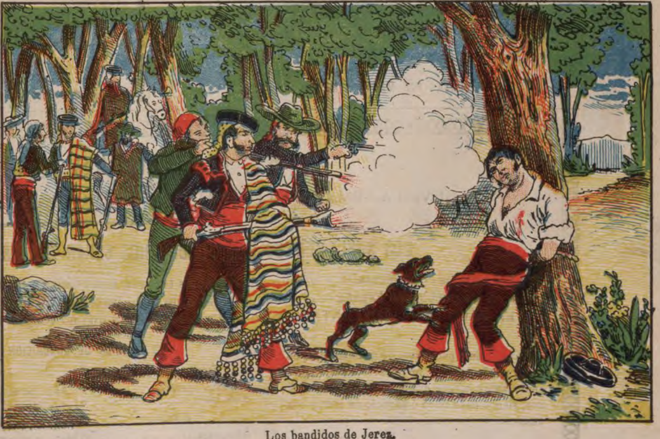
Los bandidos de Jerez.