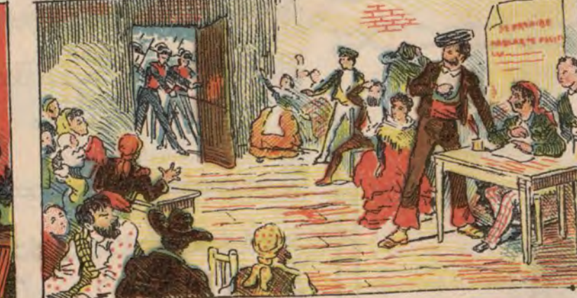
Captura de los asociados en Juzcar (Málaga).