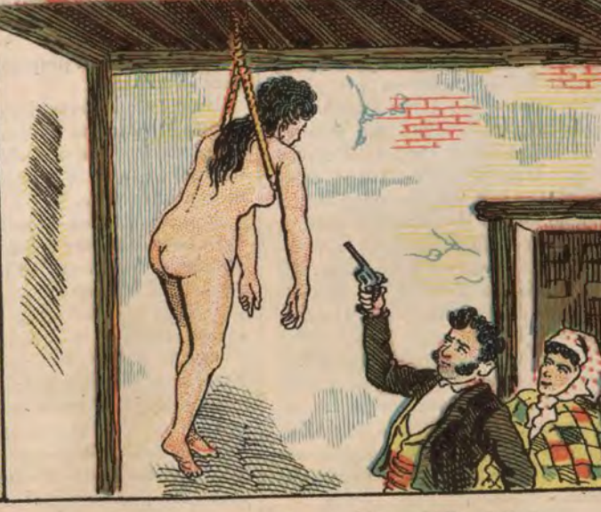
Acto salvaje en Guadalcázar (Córdoba).