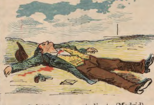
Suicidio de un estudiante (Madrid).