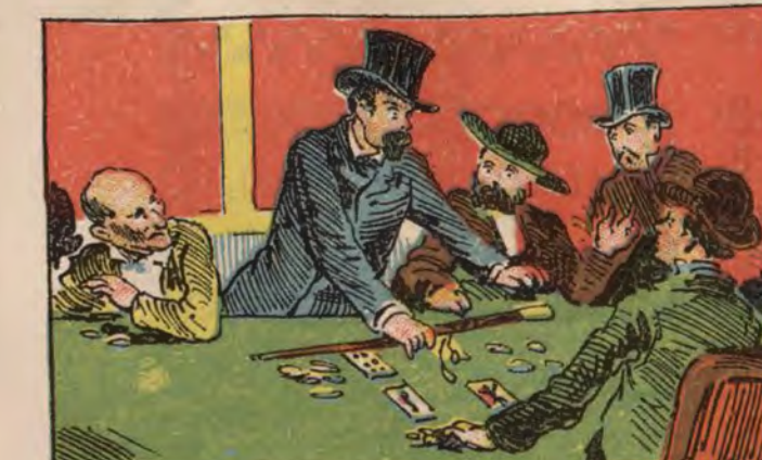
ESTINICION DEL JUEGO.