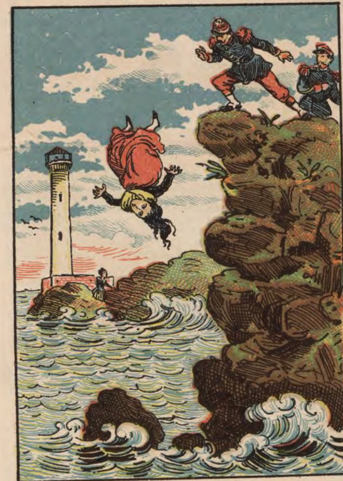
Crimen en el faro Higuer de Fuenterrabía (Guipúzcoa).