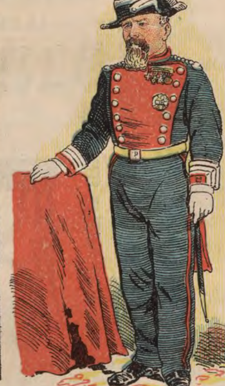
El Capitán Oliver.