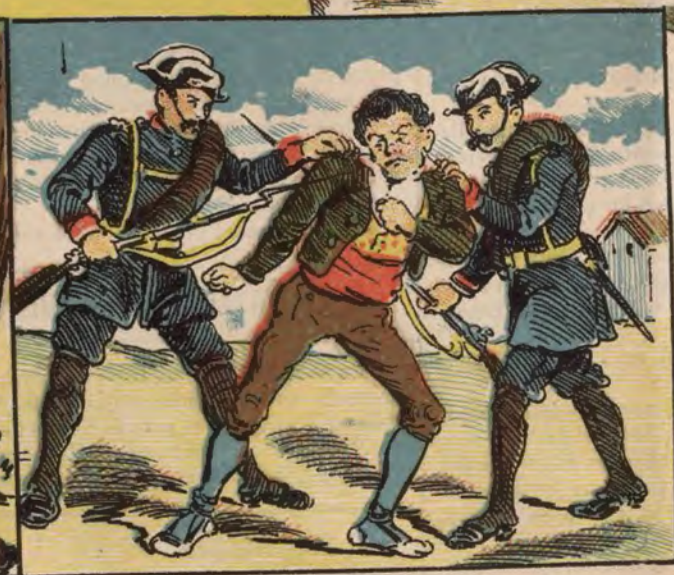
Fratricida de Almodóvar del Campo (Ciudad Real).