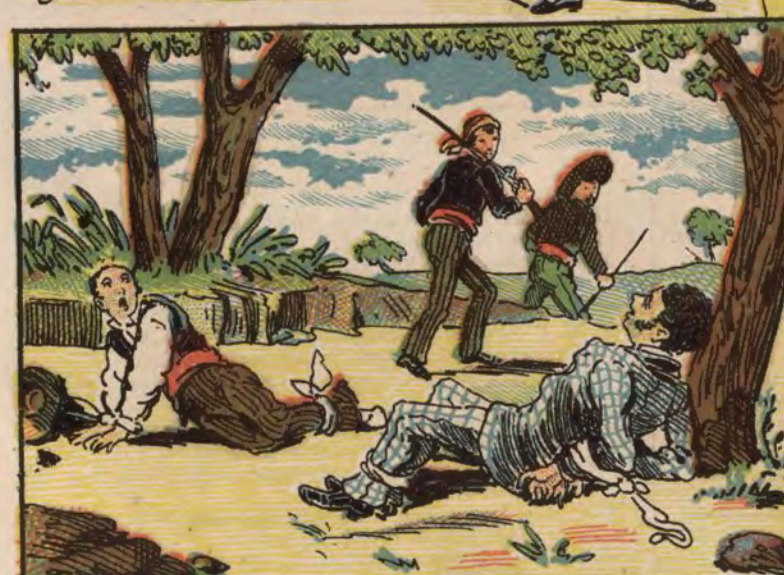
Robo en Calceña (Zaragoza).