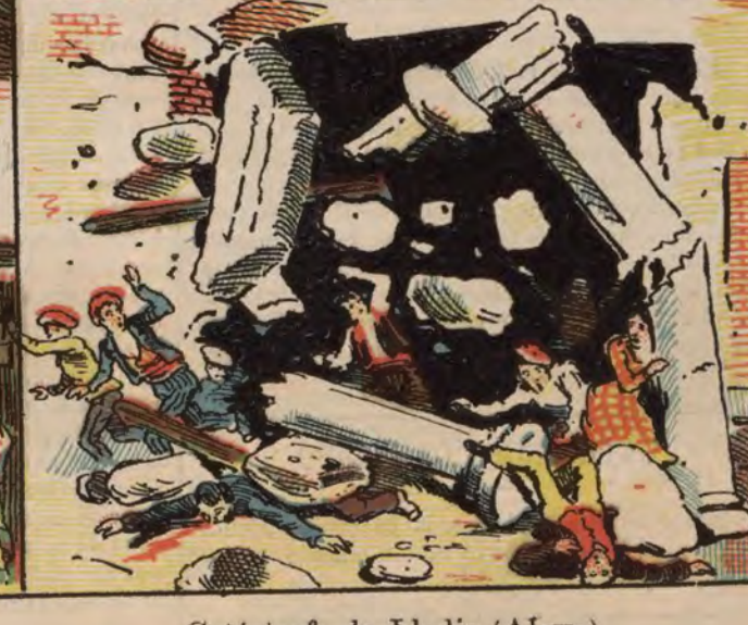
Catástrofe de Llodio (Álava).