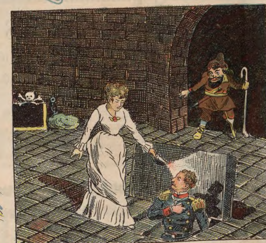
A Orillas del Rhin.—El Castillo del Diablo.