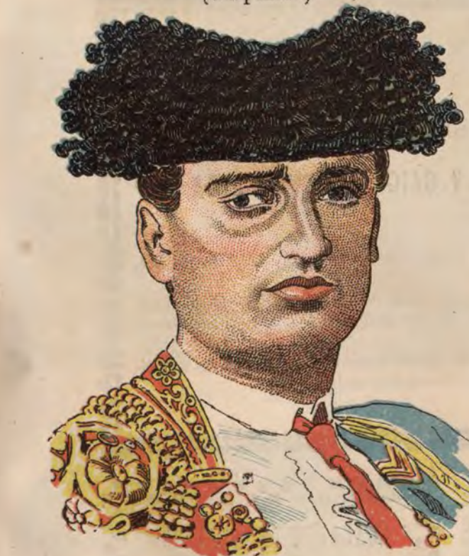
Rafael Molina (Lagartijo).