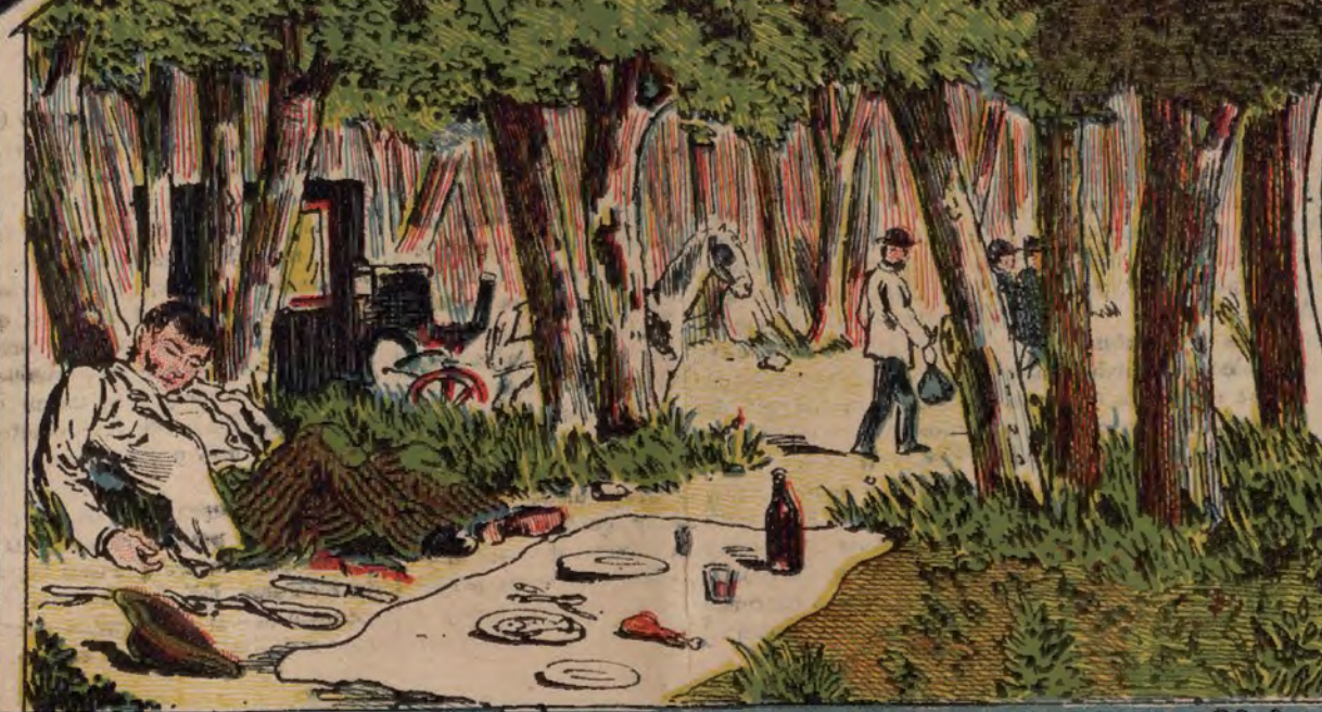
DESGRACIA DE UN COCHERO. EN EL CAMINO DEL PARDO. MADRID.