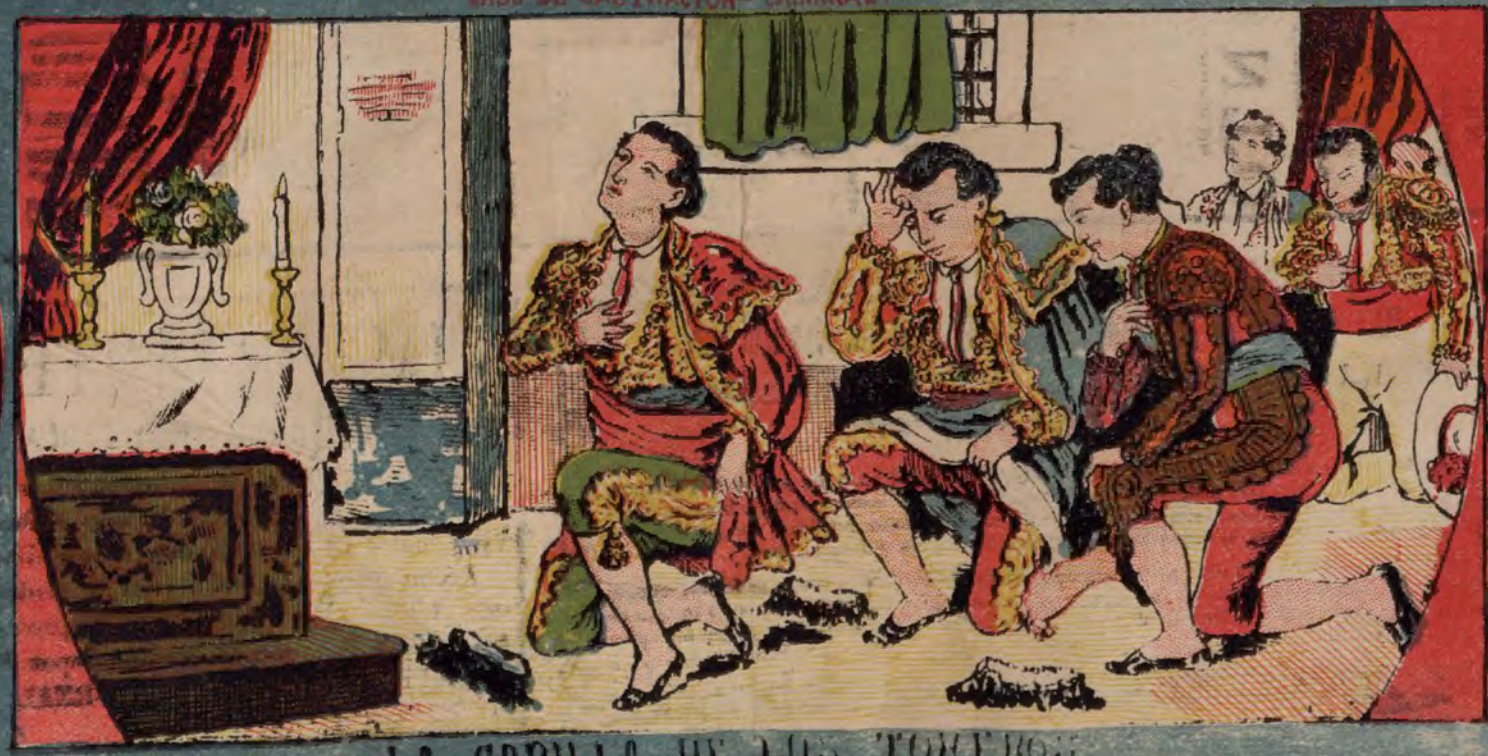
LA CAPILLA DE LOS TORCEROS