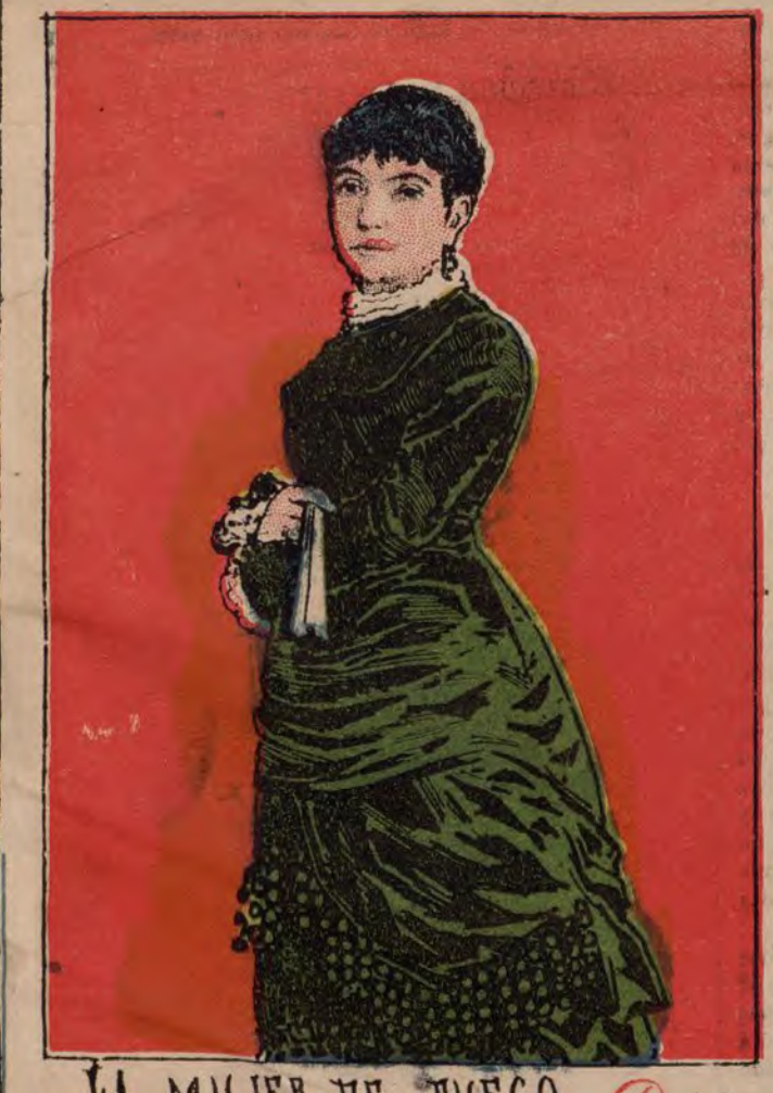
LA MUJER DE FUEGO. Paris