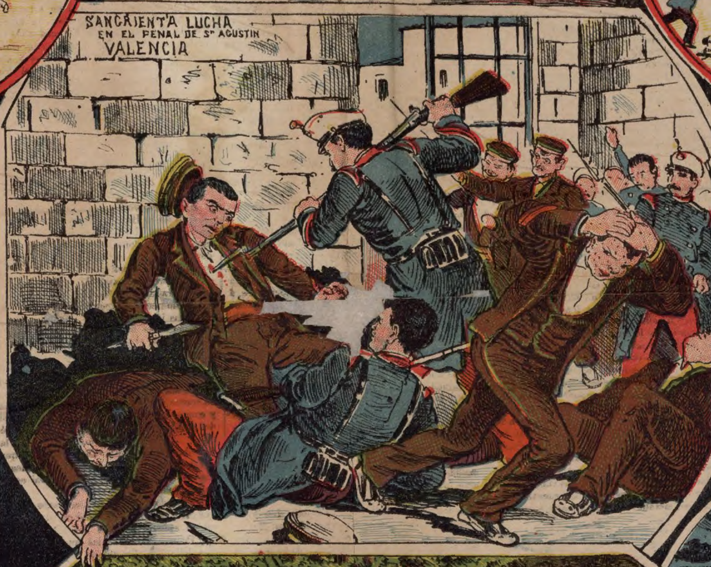
SANGRIENTA LUCHA EN EL PENAL DE S. AGUSTIN VALENCIA