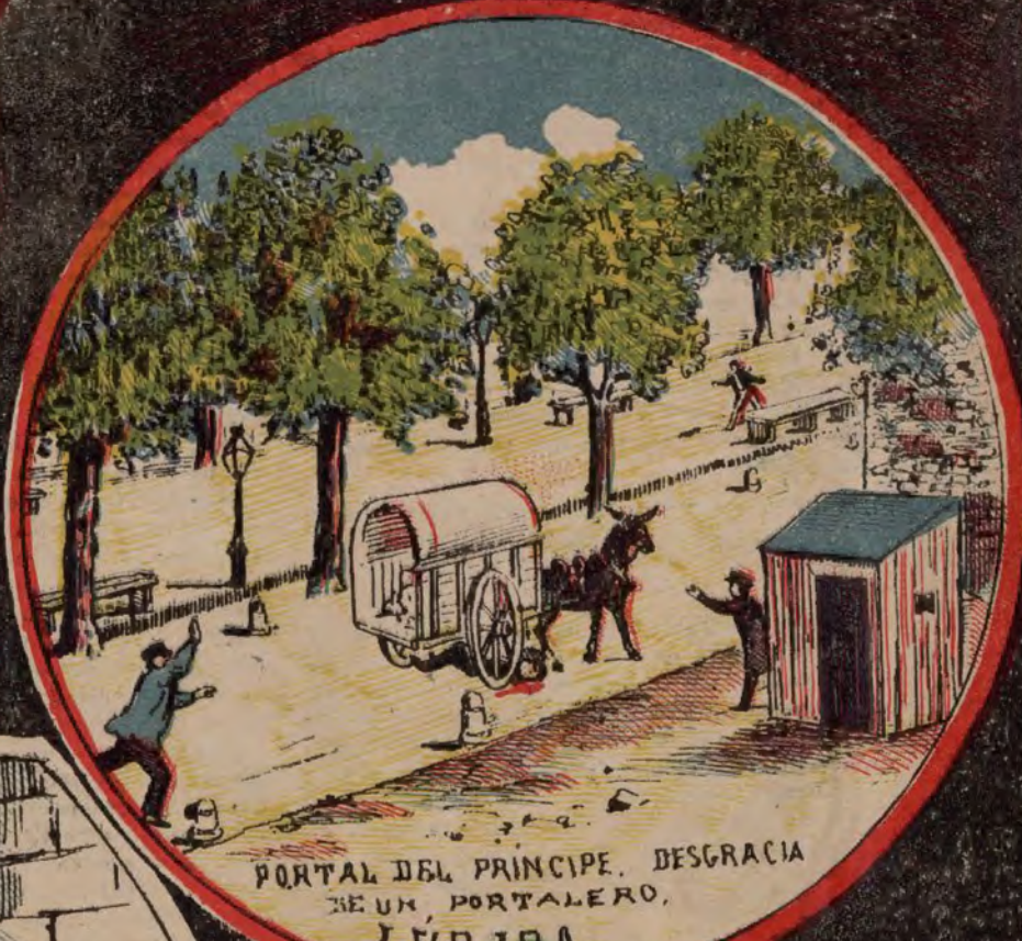
PORTAL DEL PRINCIPE. DESGRACIA DE UN PORTALEIRO. LERIDA