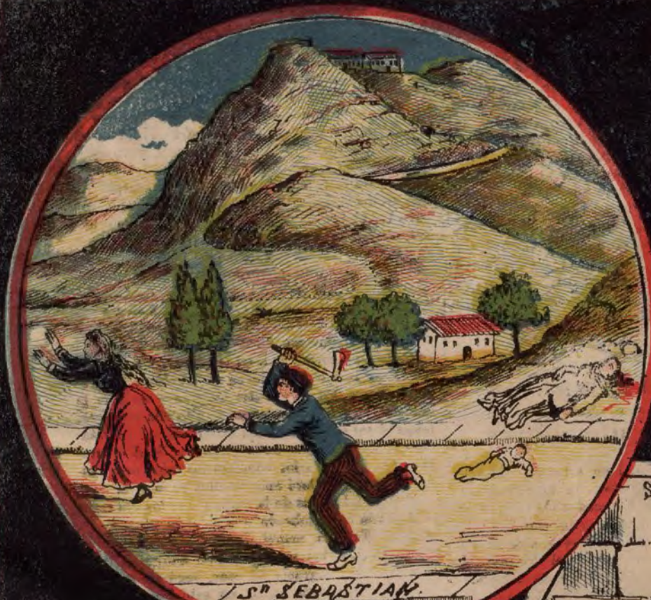
CRIMEN EN UNA SIDRERIA S. SEBASTIAN