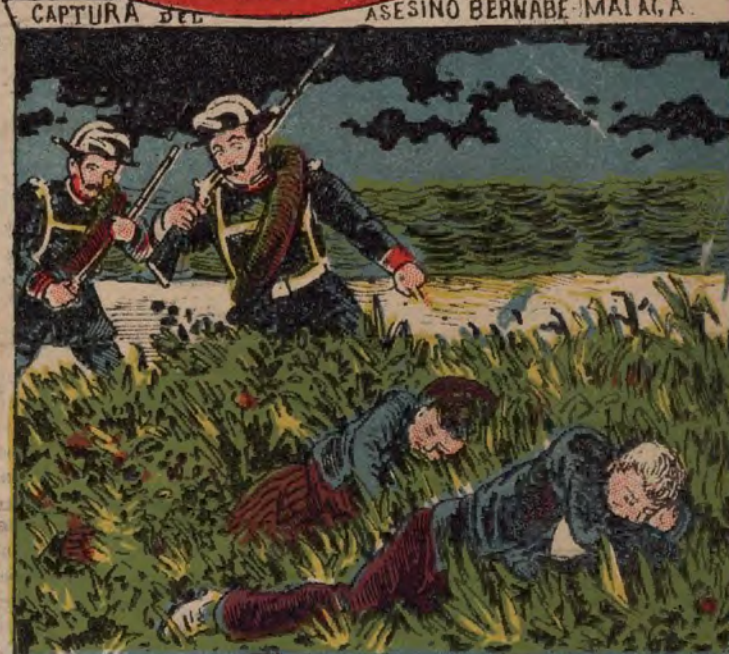
CAPTURA DEL ASESINO BERNABE MALAGA