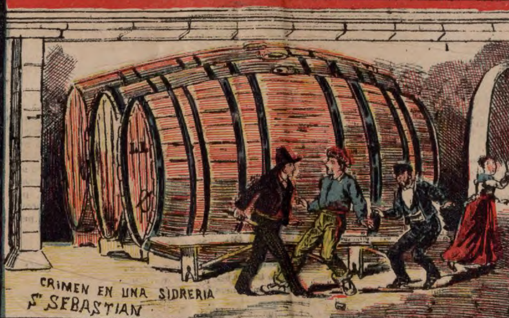
CRIMEN EN UNA SIDRERIA S. SEBASTIAN