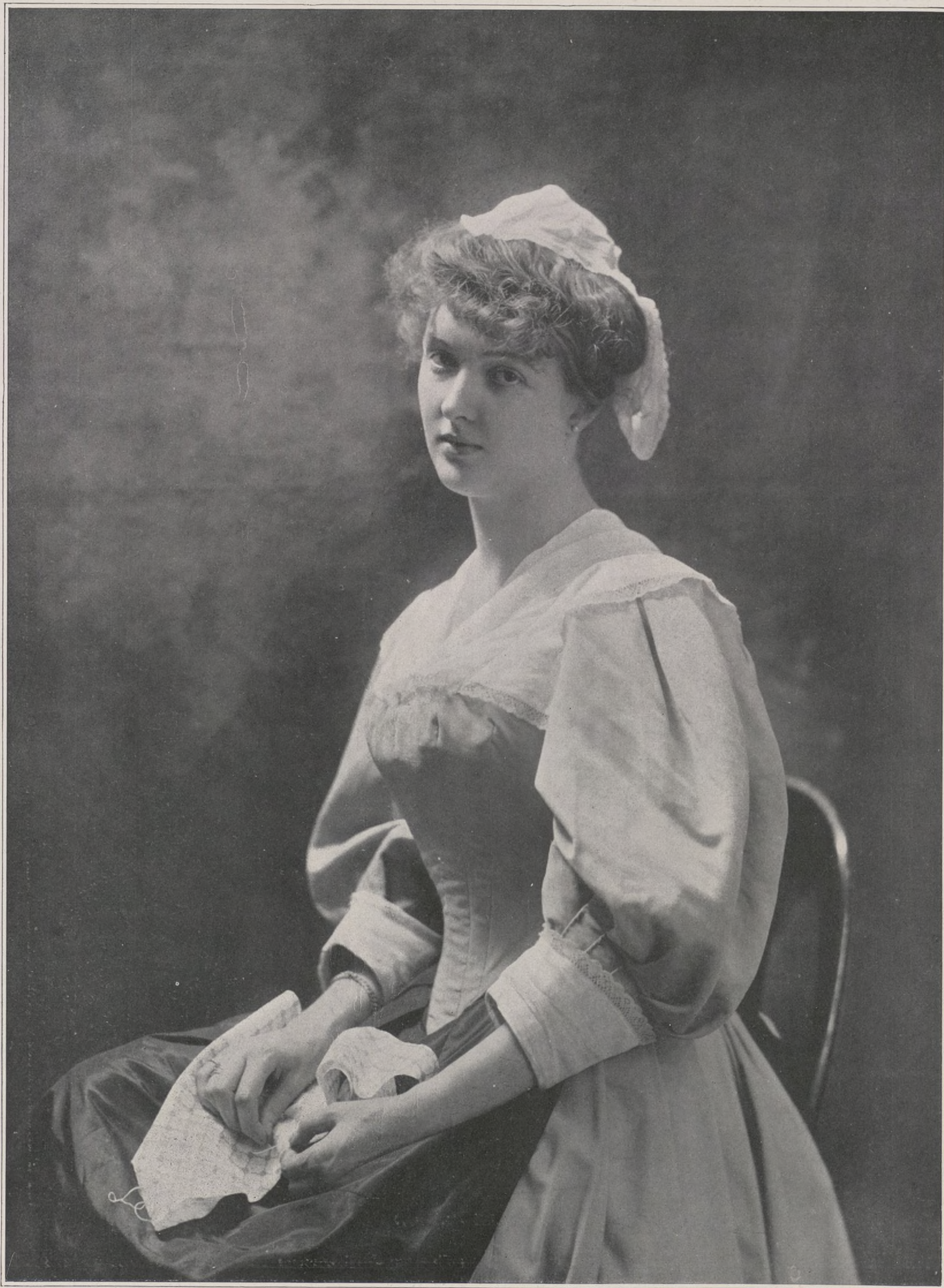
CONCOURS. — N° 5

de fantômes, qui écoute dans le silence les voix chères qui se sont tues , qui se recueille, les doigts raidis, appuyés contre la tempe et la joue, douloureuse, mélancolisée, dolente, avec sur sa blonde chevelure, sur le drap blanc de son lourd manteau de