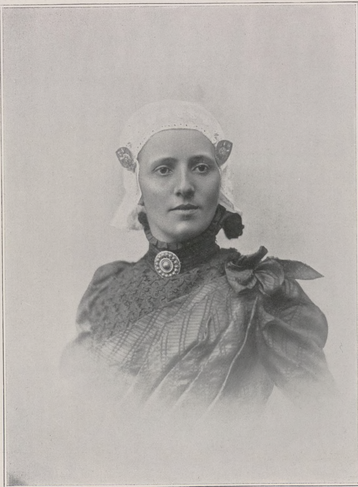
CONCOURS. — N° 15

Qu'elle contraste avec cette noble et hautaine Walkyrie dont la chevelure