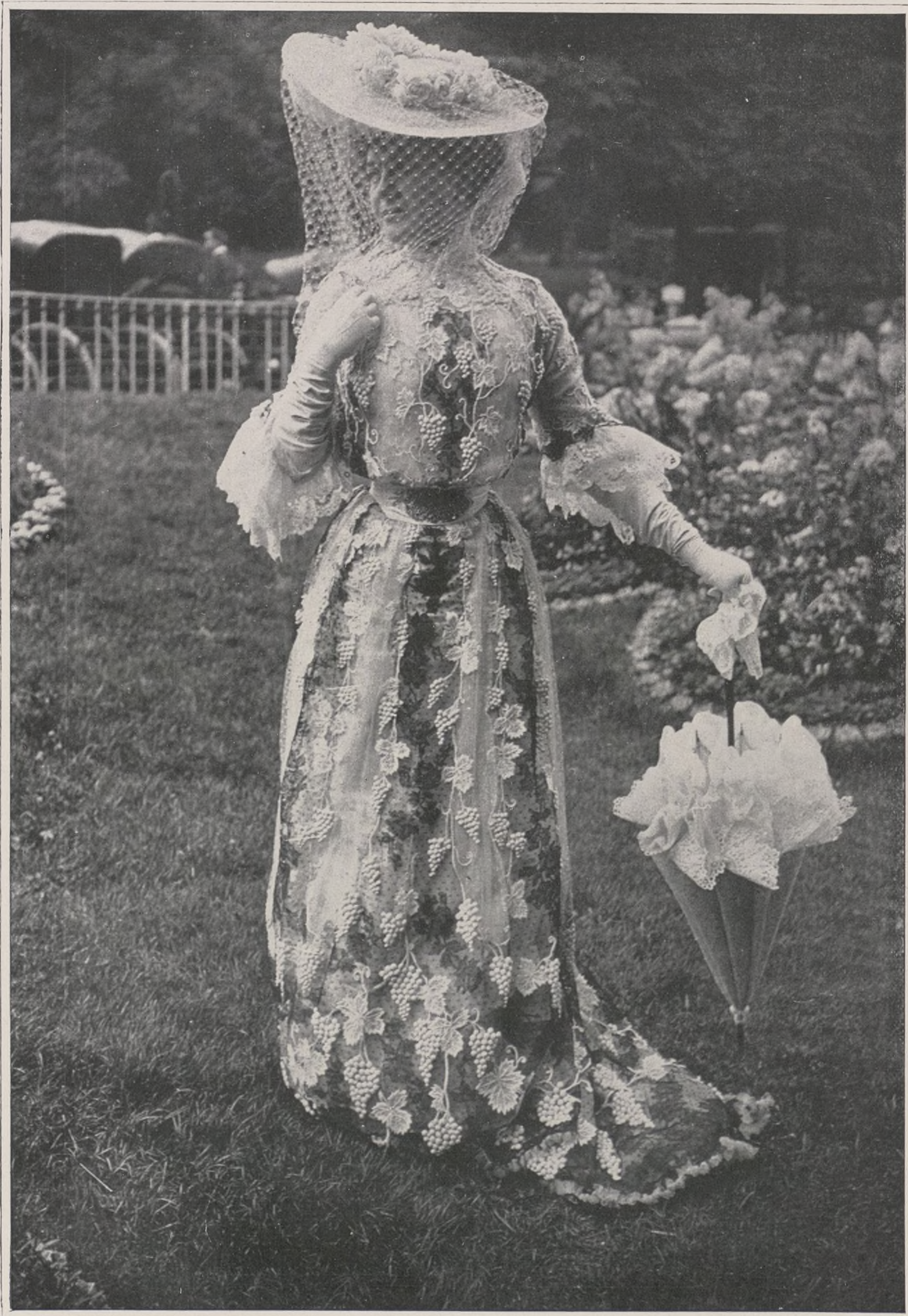
CONCOURS. — N° 17

Cette autre fleur de luxe qui s'enturbanne de point d'Angleterre et dont les yeux d'aigle-marine, le sourire froid de gymnaste, le masque d'idole n'ont rien de rassurant, a-t-elle vidé tous ses écrins, — ô les perles noires aux lobes des oreilles, la rivière où pend comme une goutte de sang un cabochon de rubis, la bague lourde autant qu'un anneau de cardinal, — a-t-elle mis ce corsage vapoureux et merveilleux que chiffonnèrent des doigts de fée,