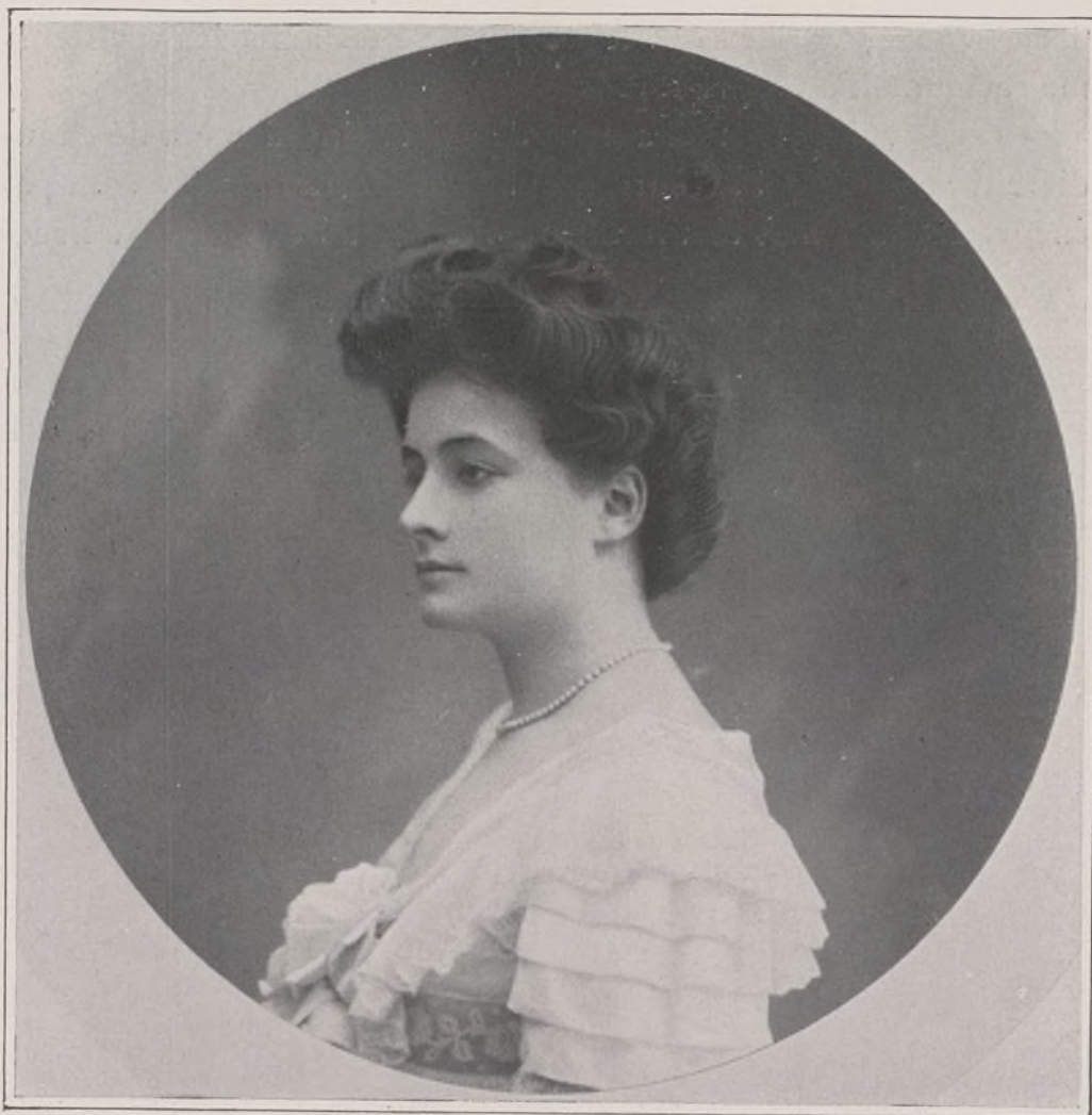
CONCOURS. — N° 8