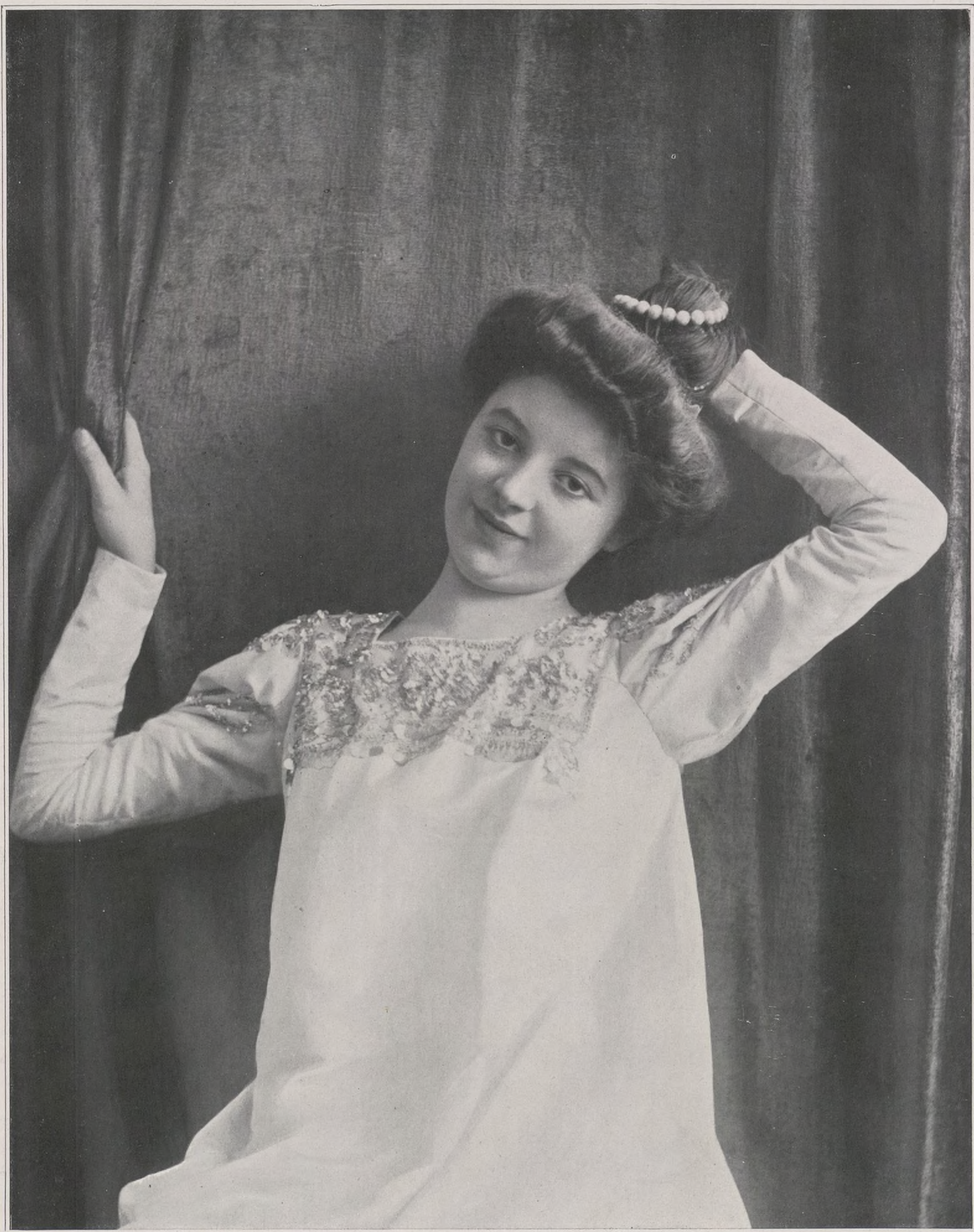
CONCOURS. — N° 7

Serait-ce parmi les ruches de la sortie de bal aux plis amples, aux cassures miroitantes, où se révèlent indécises, dans la trame de la soie, des guirlandes de clématites, cette tête moqueuse et sensuelle de poupée au nez impertinent, aux lèvres de gourman-