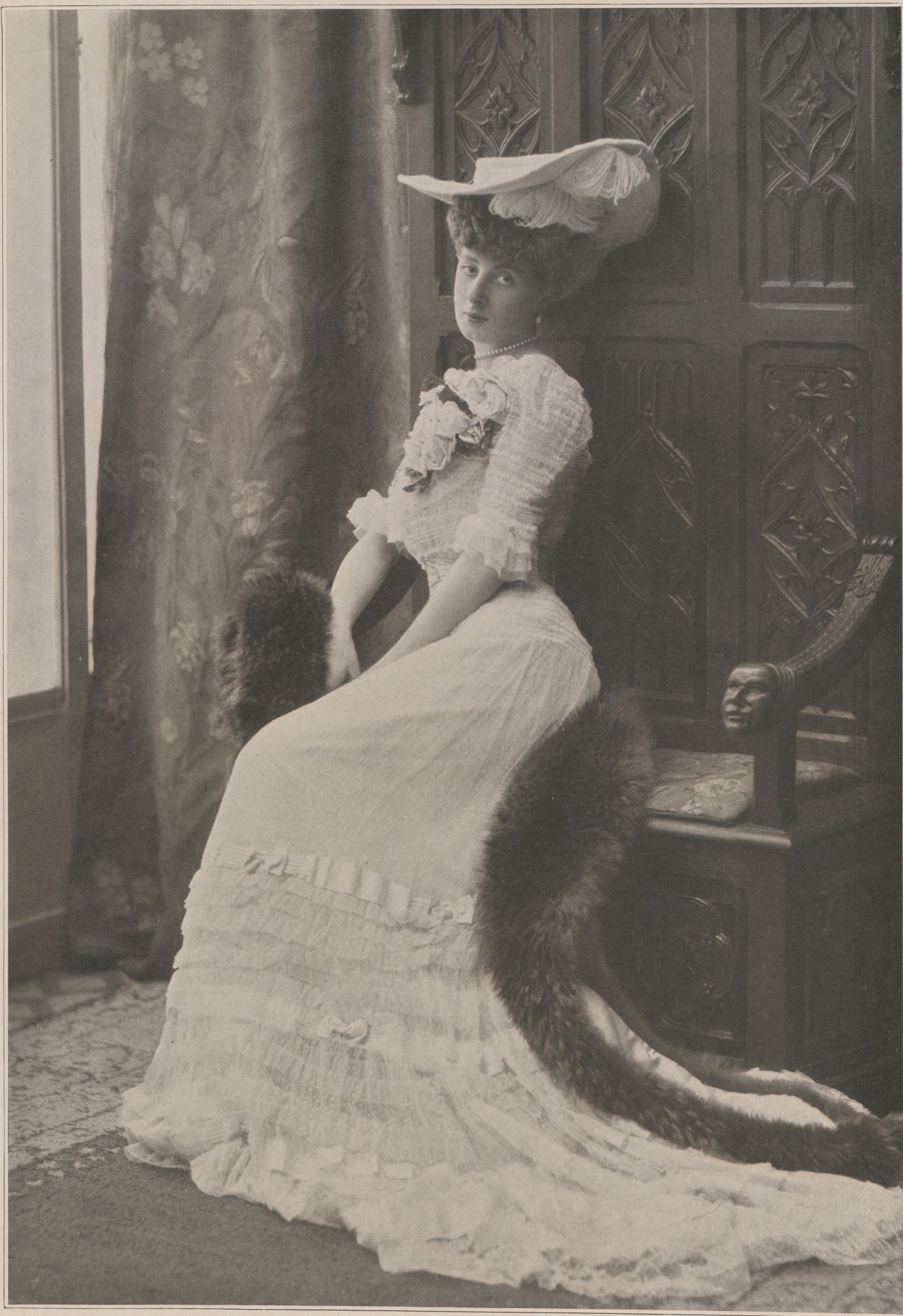
BOISSONNAS & TAPONIER.