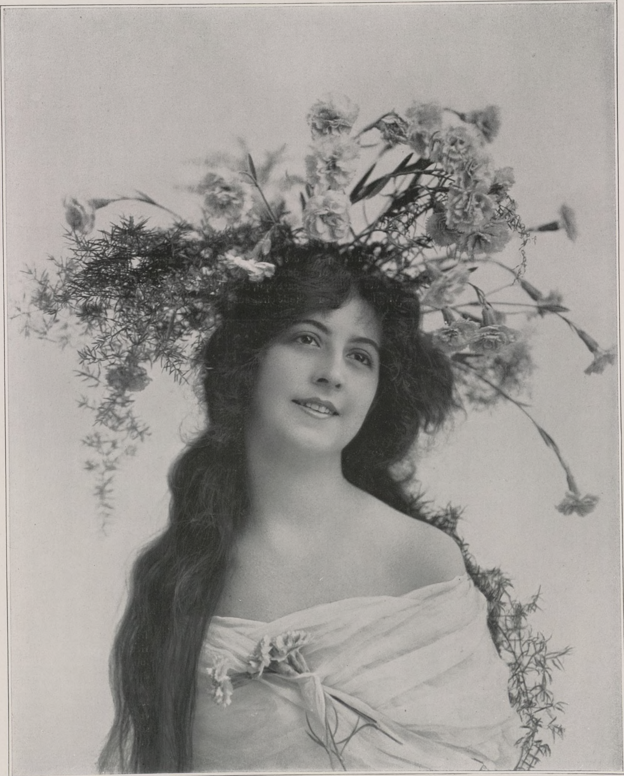
THE BURR Mc INTOSH ART STUDIO (NEW-YORK). HORS CONCOURS

« O ce bruit perpétuel autour de soi, ce grondement de chaudière titanesque qui assourdit, qui hébête ceux qui n'y sont pas encore accoutumés, ce tumulte de marée où des vagues se heur-