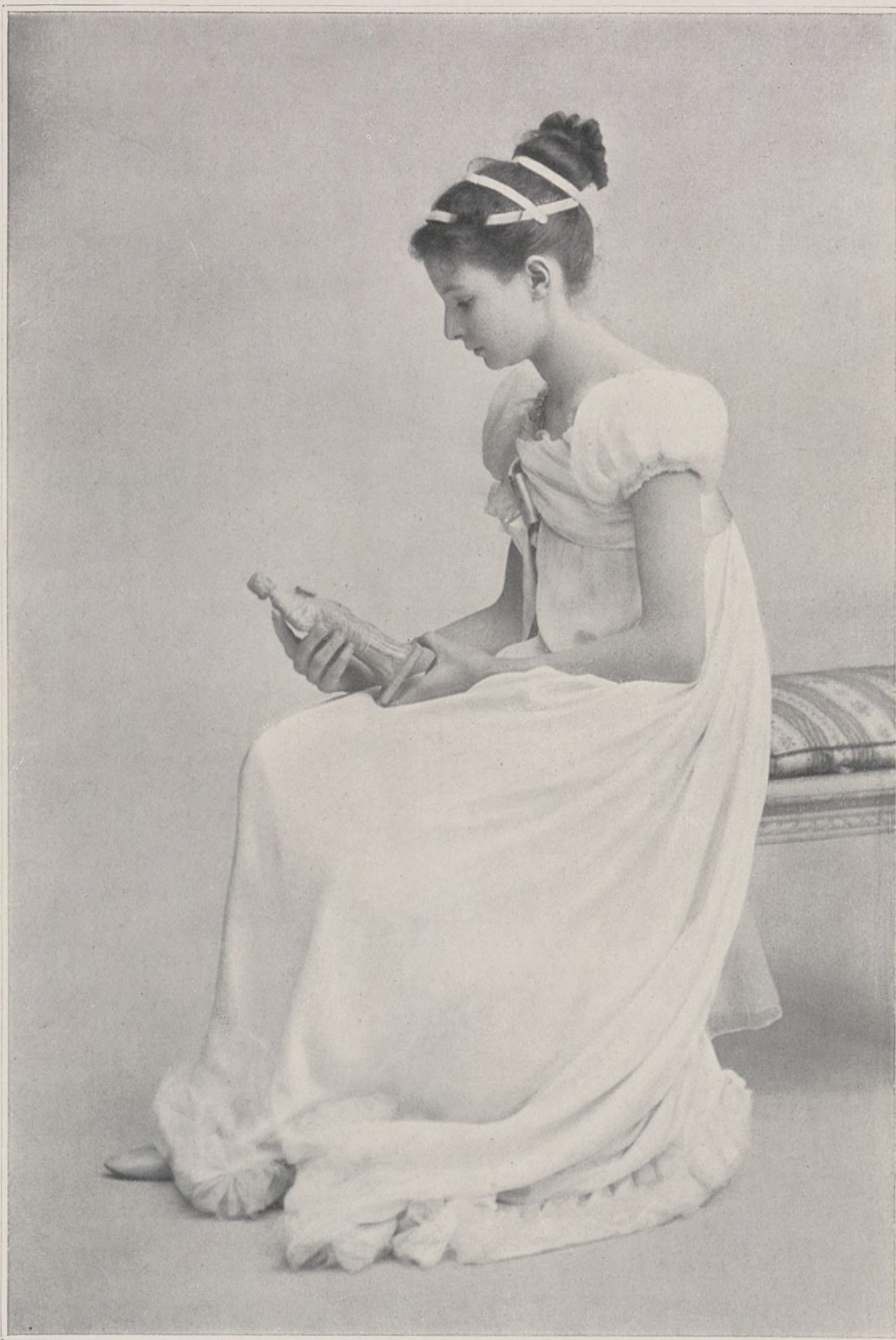
CONCOURS. — N° 2

Ils trouveront jointe à ce numéro une carte postale où ils n'auront qu'à ajouter un chiffre et qu'ils voudront bien ensuite mettre simplement à la poste: Le dépouillement sera fait dans nos bureaux et le prochain fascicule annoncera le résultat du vote.