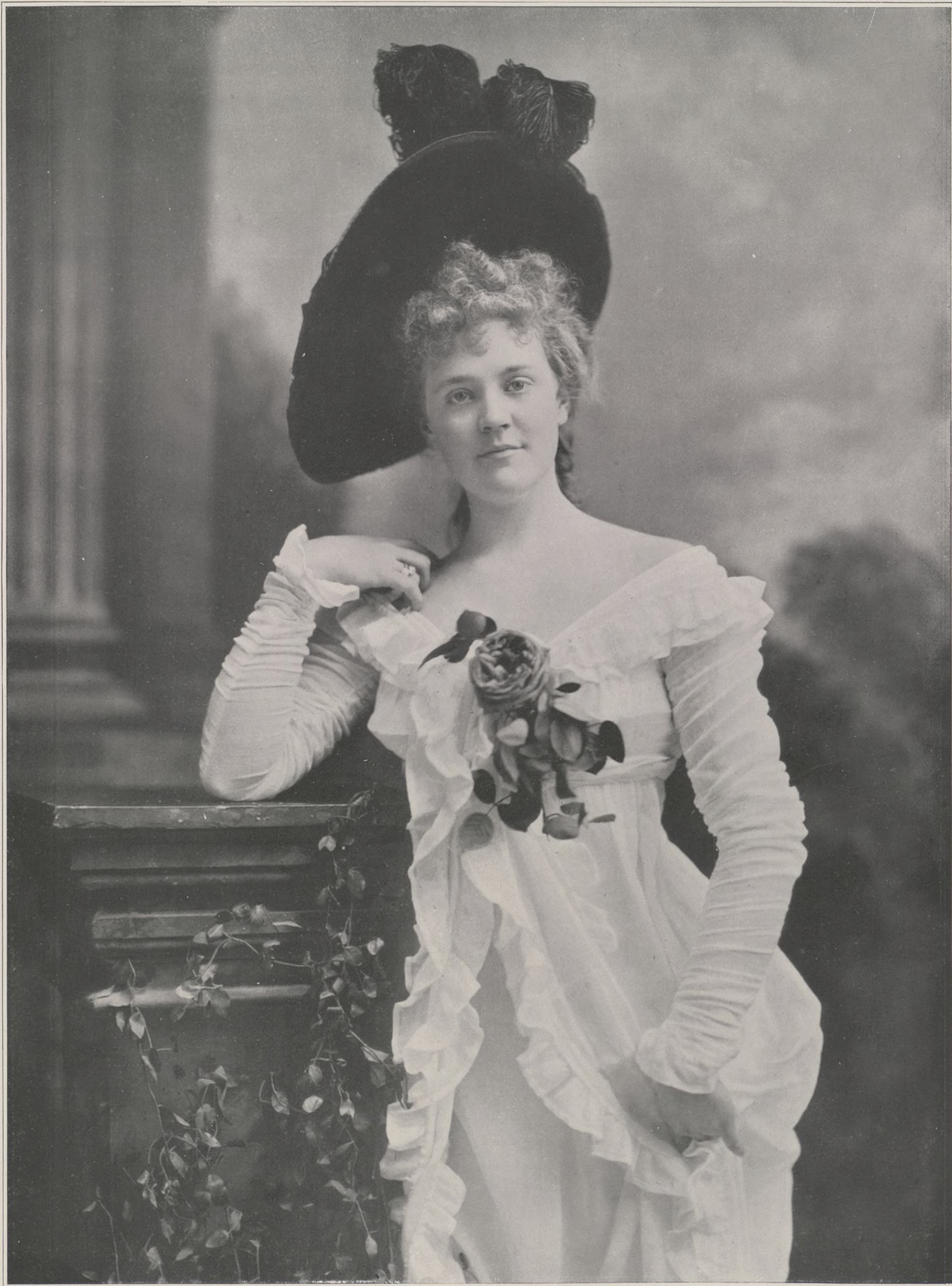
CONCOURS. — N° 21

l'une à l'autre avec une guirlande de fleurs, cette Hollandaise coiffée d'un bonnet de dentelles et dont le visage, d'énergie et de