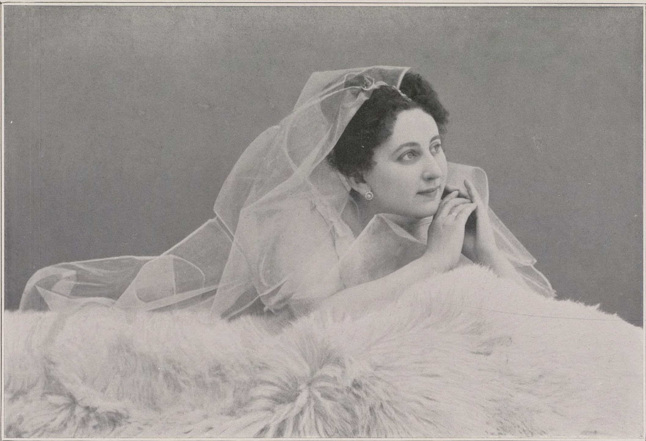
CONCOURS. — N° 11

acharnés, violents, qui eussent ravi le peintre des blondes, le prestigieux Helleu, et des parties de golf qu'encadrerait l'Es-