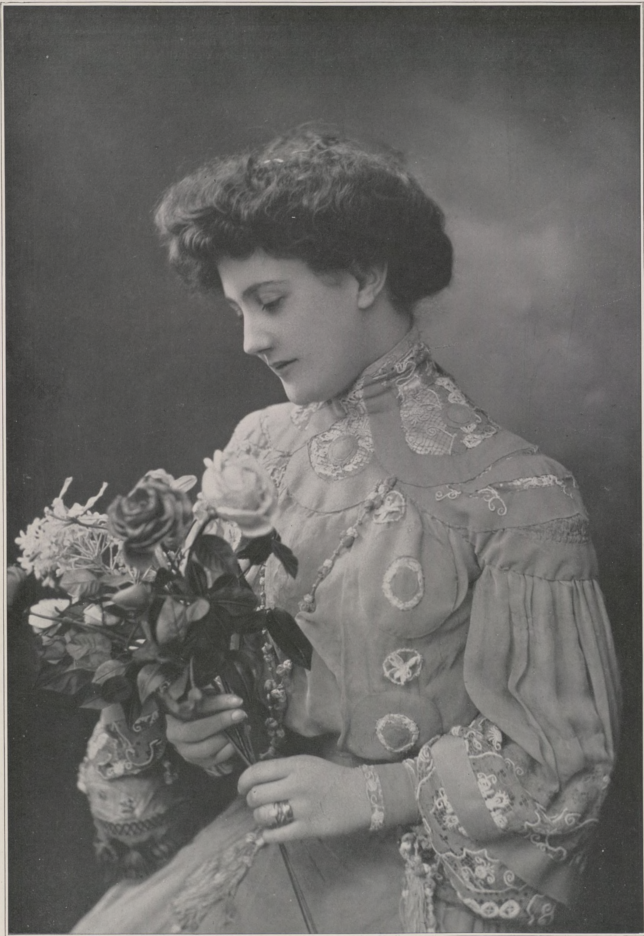
CONCOURS. — N° 24 CONCOURS PHOTOGRAPHIQUE D'ART ET DE BEAUTÉ