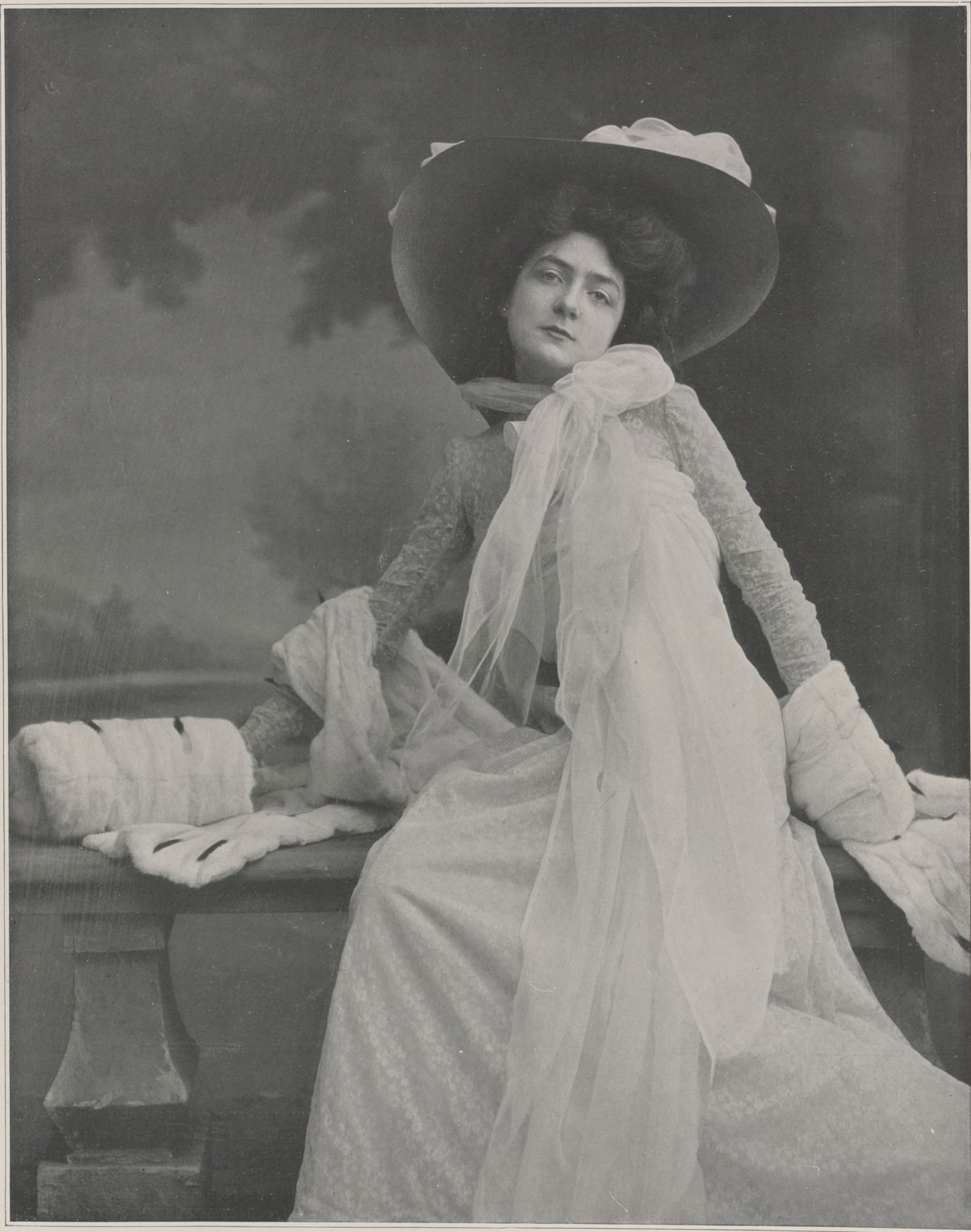
CONCOURS. — N° 3

briguaient la pomme de beauté, s'il me fallait dire sans détours quel est celui que je préfère entre tous ces visages de femmes qui sont le plaisir des yeux, qui vous rappellent du bonheur, de la souffrance, des rêves, qui évoquent des ciels de lumière et des ciels de brume, des décors de luxe et de mélancolie, des