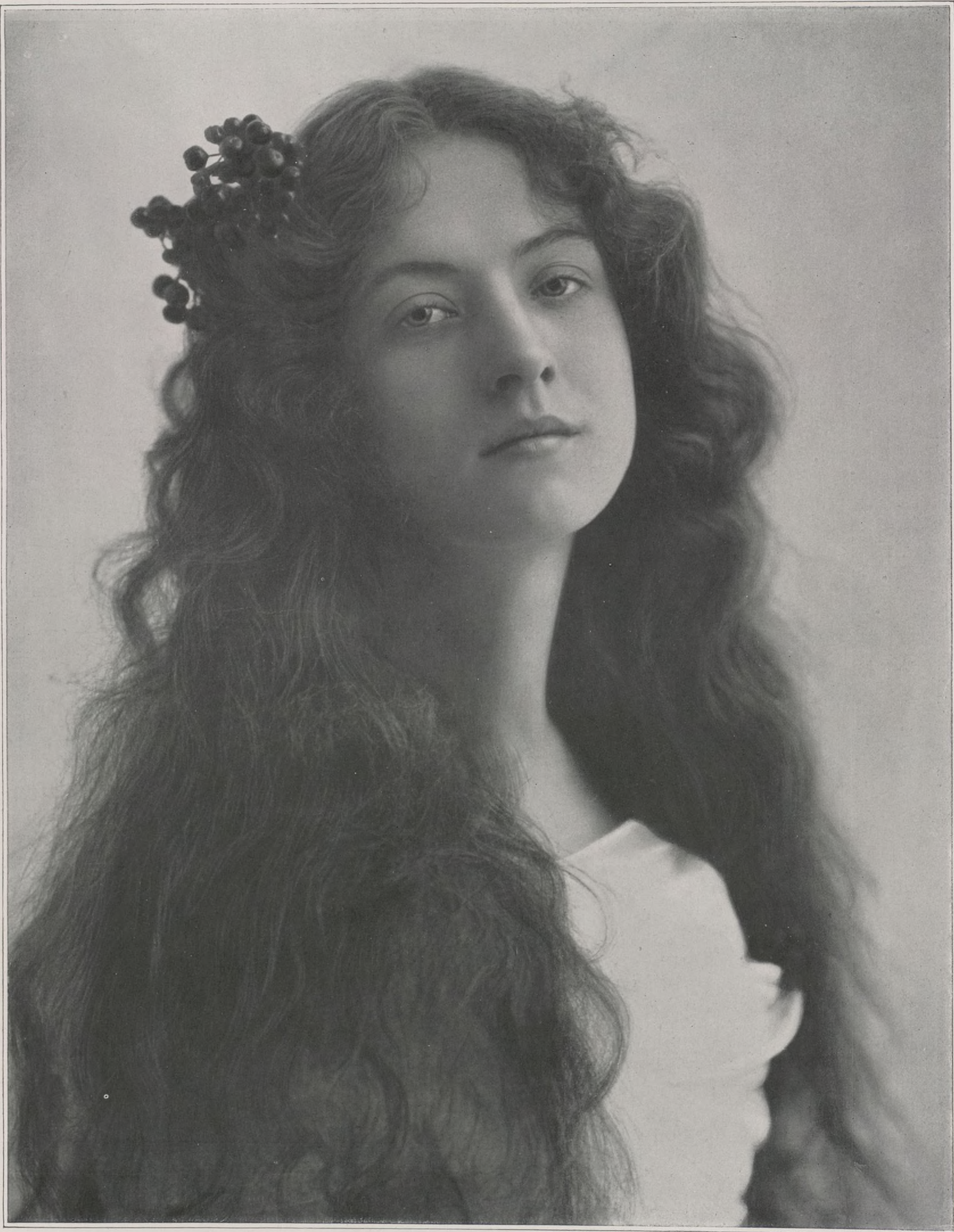
CONCOURS. — N° 4

çailles, qui ferme à demi les paupières comme si leur odeur subtile la délectait et la grisait, comme si leurs calices épanouis lui chuchotaient les doux aveux qui peut-être leur ont été confiés dans un baiser furtif?