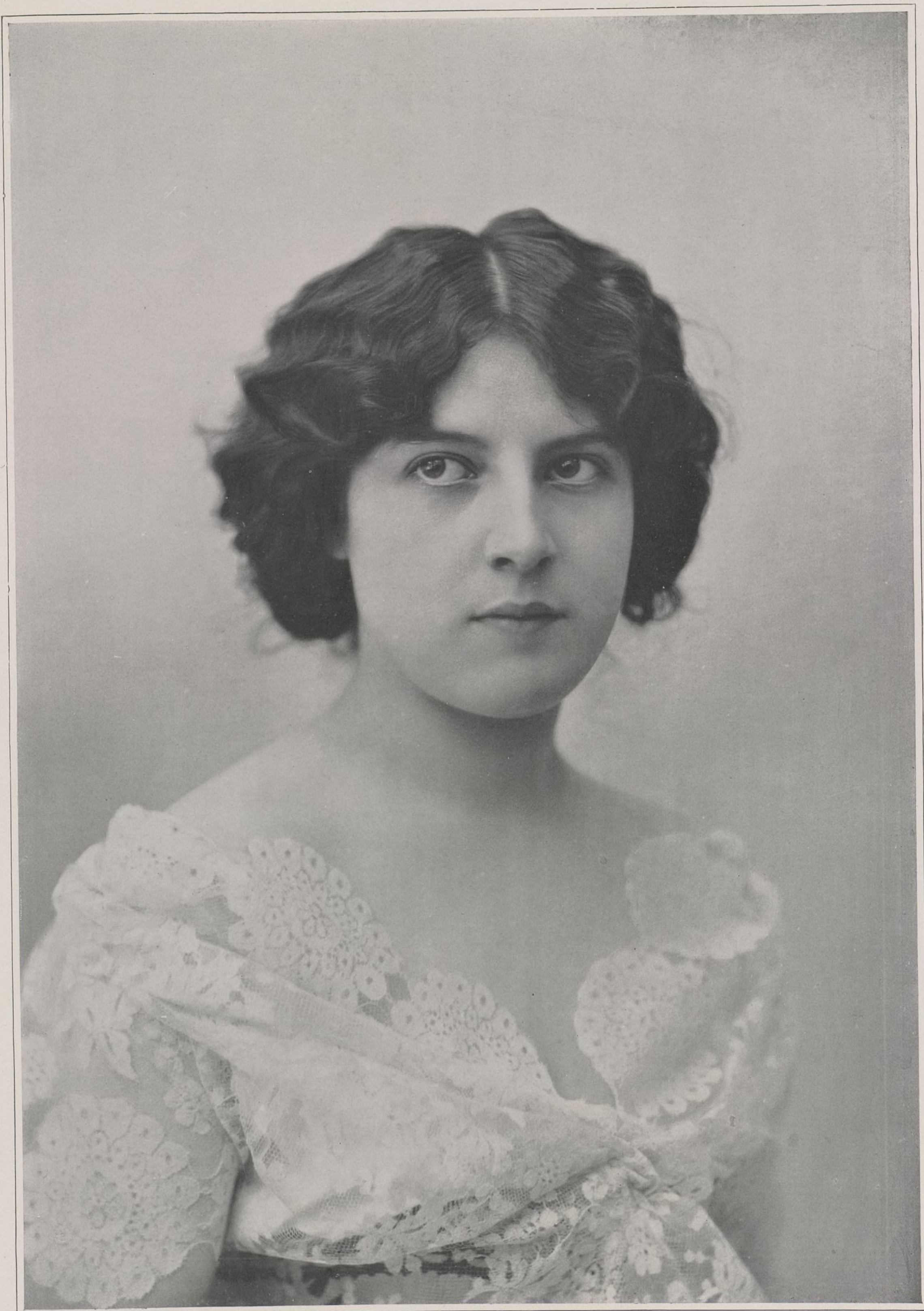
CONCOURS. — N° 13 CONCOURS PHOTOGRAPHIQUE D'ART ET DE BEAUTÉ