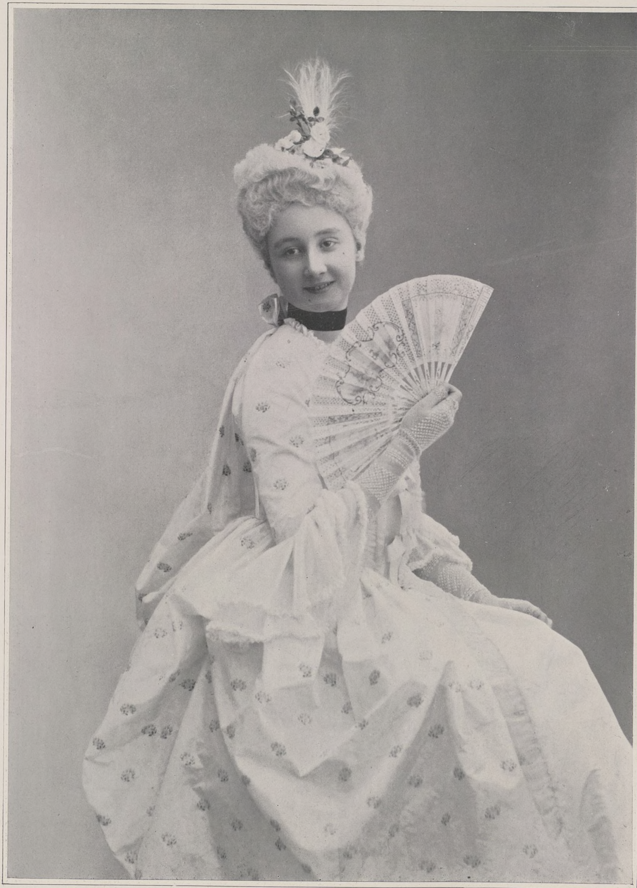
CONCOURS. — N° 14

ce cou qui a l'apparence d'une colonnette de sanctuaire ? Est-ce à Naples, dans ces rues à gradins qui montent vers le