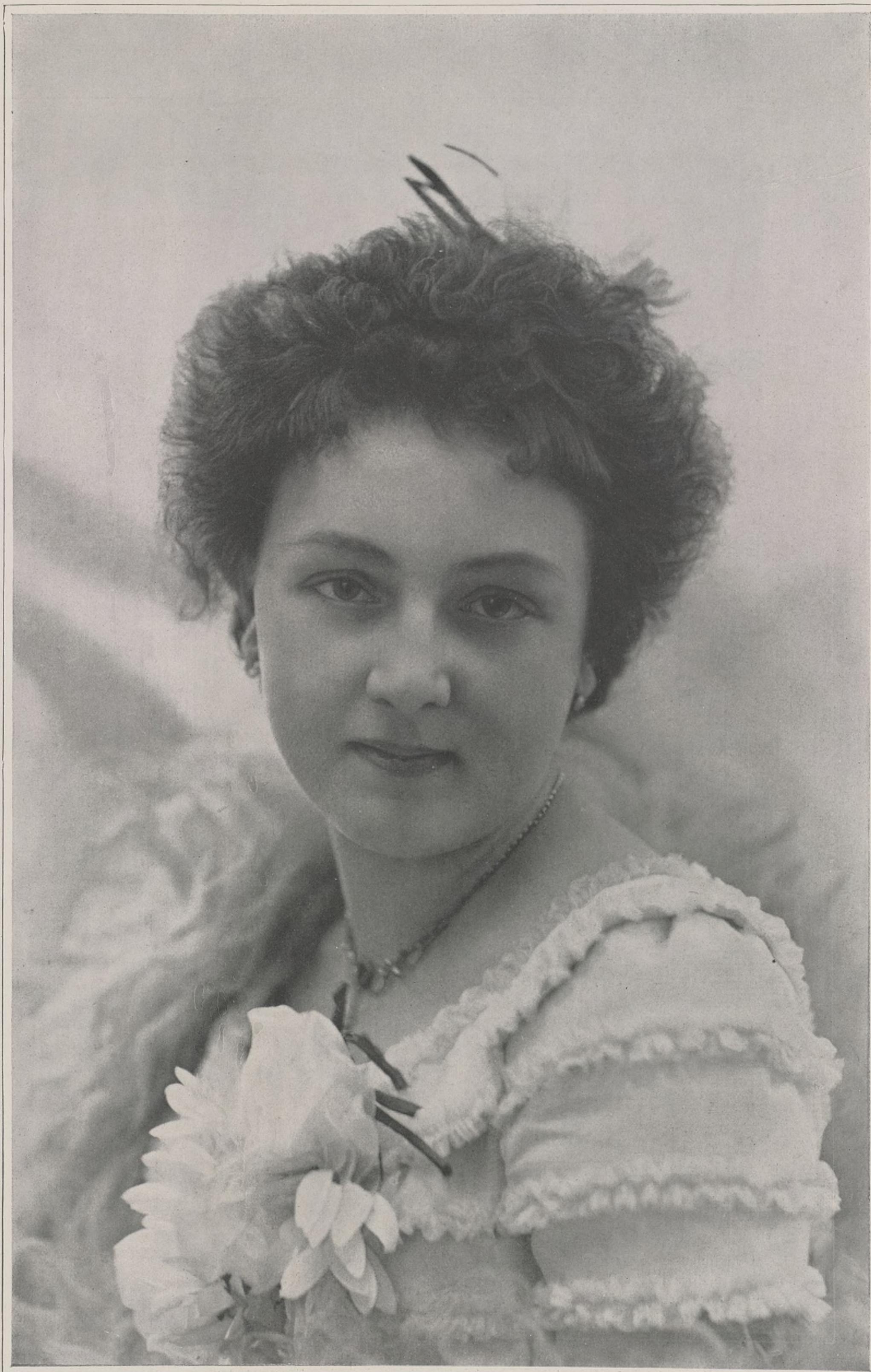
CONCOURS. — N° 18

CONCOURS PHOTOGRAPHIQUE D'ART ET DE BEAUTÉ