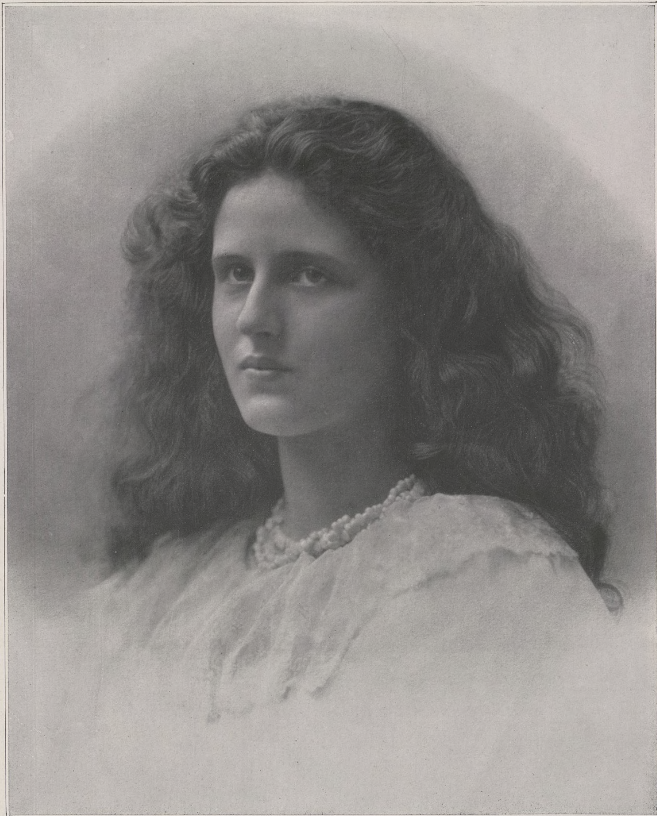
CONCOURS. — N° 19

Et l'indolente qui se renverse contre une lourde draperie, qui s'étire, le corps perdu dans une ample simarre de satin