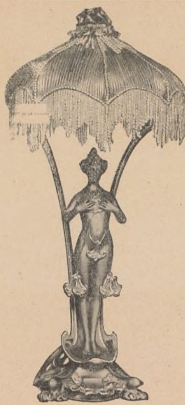
Catalogue sur demande

Ce train sera mis en marche à une date qui sera fixée ultérieurement