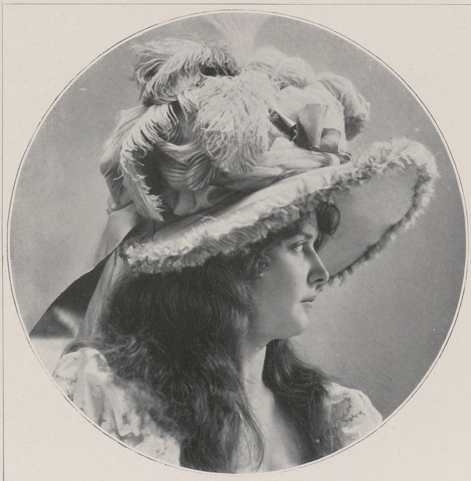
CONCOURS. — N° 12

terel, et des tableaux vivants, et des cotillons de carnaval. Mais, revenons à nos portraits.