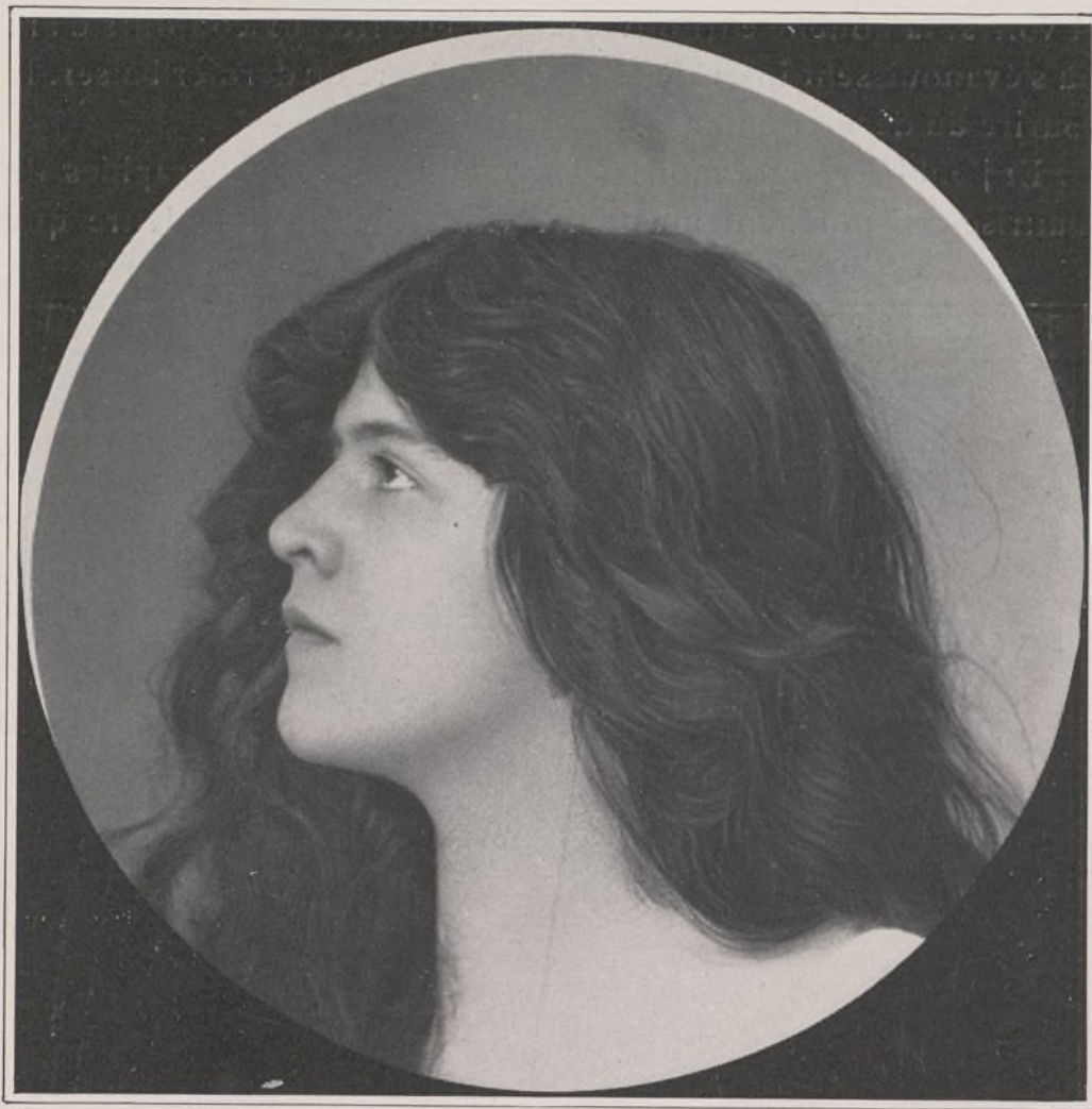
CONCOURS. — N° 9

le cœur dans un musée. Certaines semblent des statues qui seraient descendues de leurs socles de marbre. Elles illuminent de beauté les allées des squares et les trottoirs des avenues. Elles vous suggèrent l' incessu patuit dea de Virgile. Est-il au monde quelque chose de plus prenant qu'une femme dont les lignes et les attitudes d'eurythmie, quand elle marche, vous font penser à une Victoire prête à s'envoler vers l'Empyrée ou à une nymphe chasserresse qui s'élance vers les halliers? Et comment expliquer que d'un tel amalgame de races aient pu surgir ainsi des Mnémosynes et des Vénus?