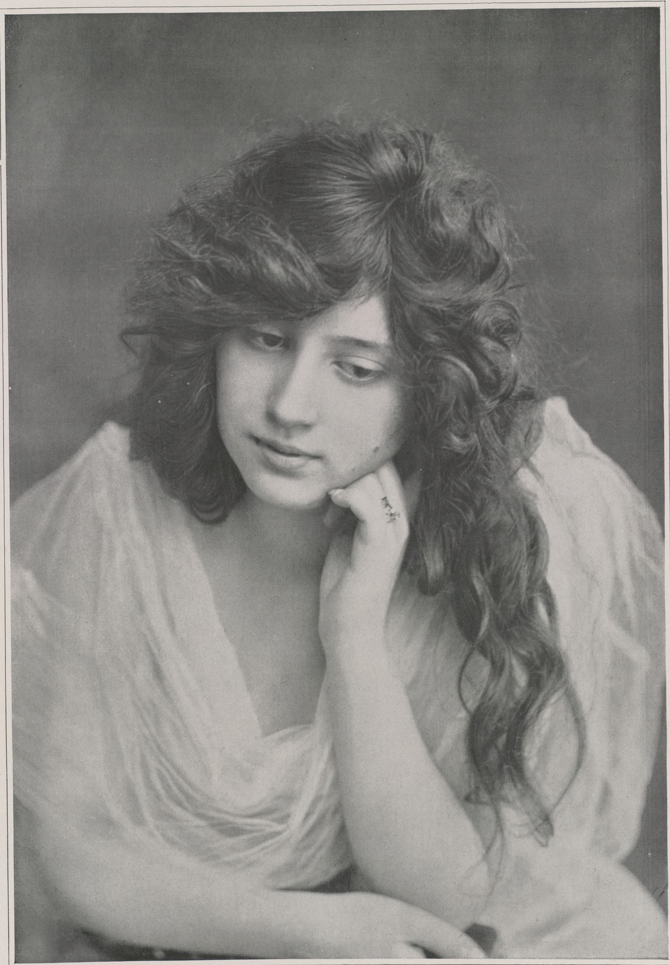
CONCOURS. — N° 16

CONCOURS PHOTOGRAPHIQUE D'ART ET DE BEAUTÉ