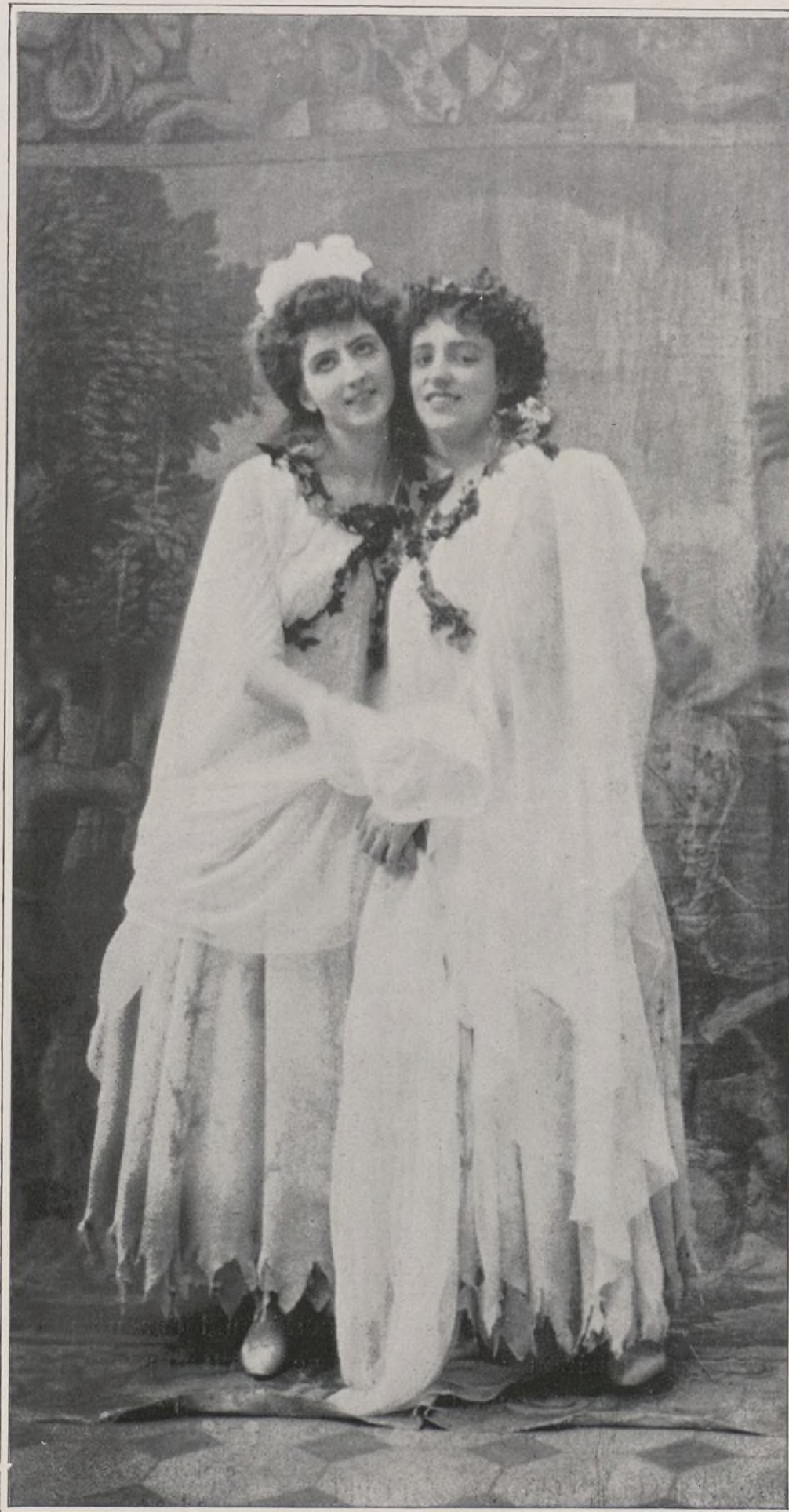
CONCOURS. — N° 10