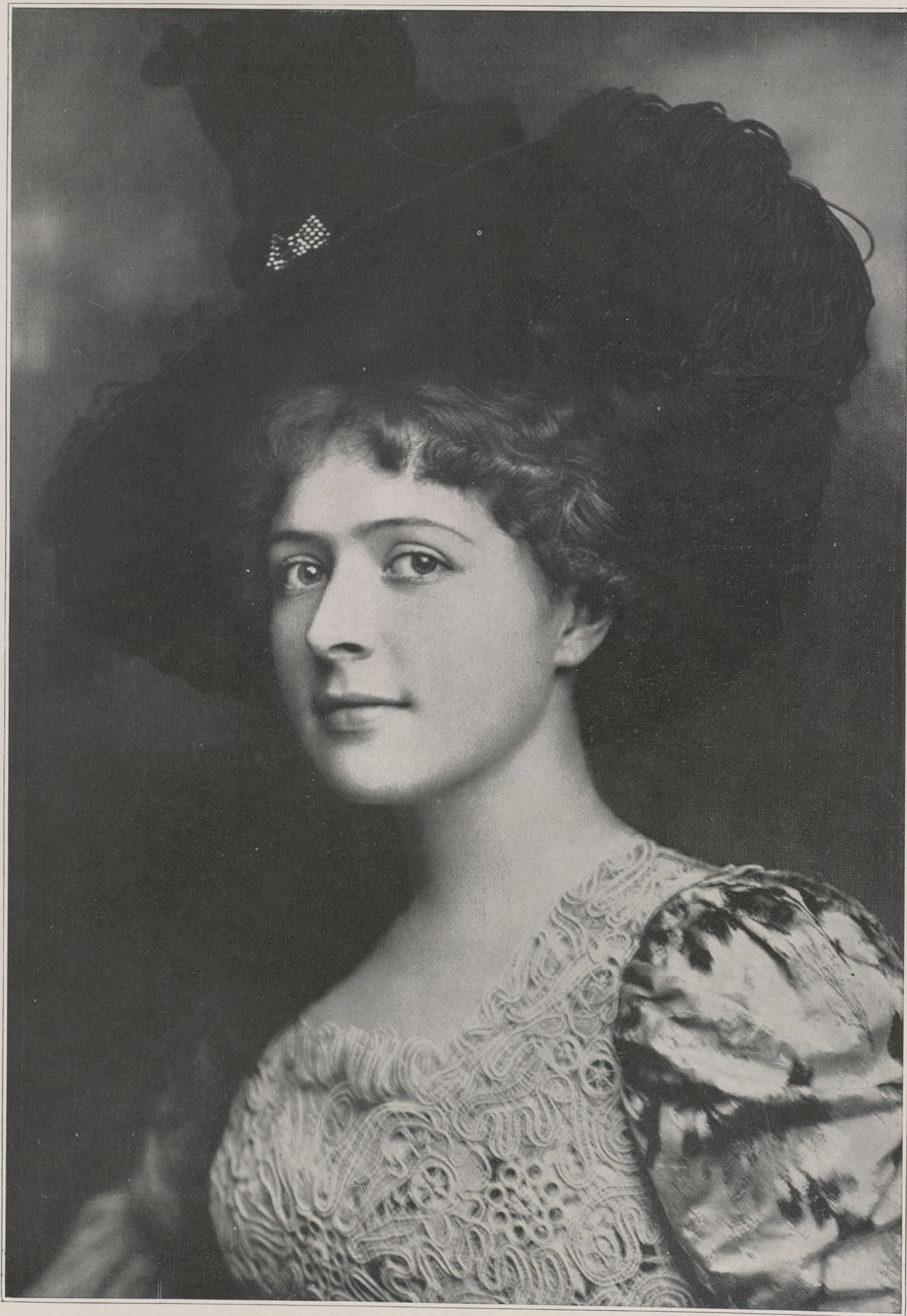
CONCOURS. — N° 6 CONCOURS PHOTOGRAPHIQUE D'ART ET DE BEAUTÉ