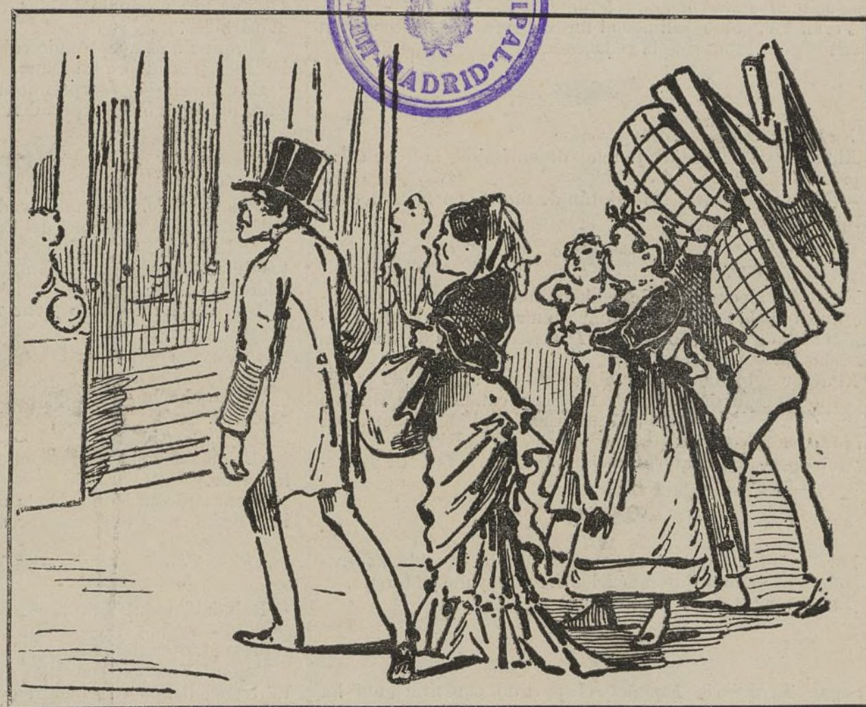
Hay mujeres celosas que quieren convencerse por sí mismas de que su marido pasa la noche en el Congreso.