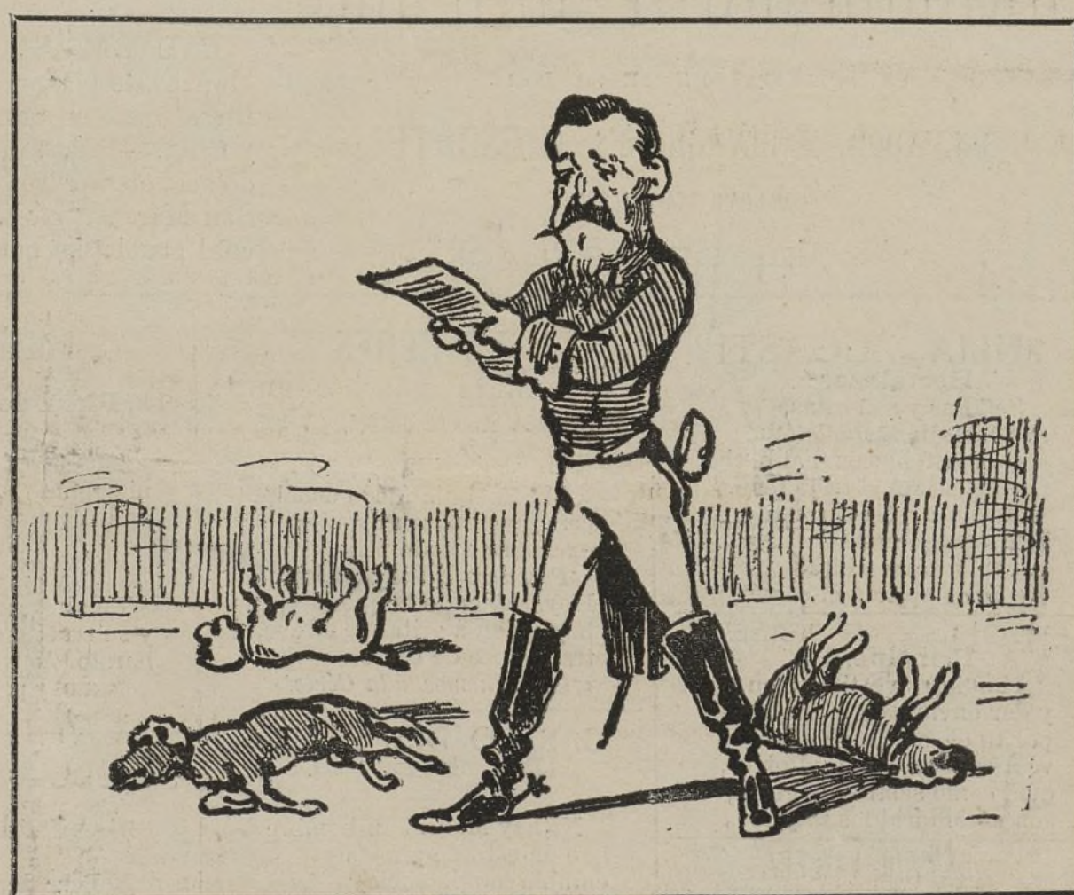
El general Salamanca, ensayando en la calle el efecto de un discurso que vá á pronunciar contra el ministerio.