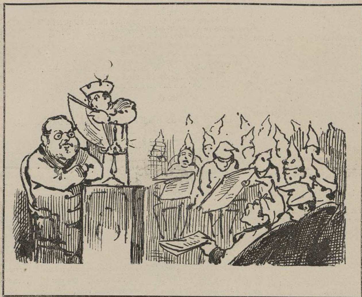
Son las doce de la noche. La temperatura del salon está á 50 sobre cero. Los padres de la pátria se asfixian. Los escaños echan fuego; los maceros se destiñen.