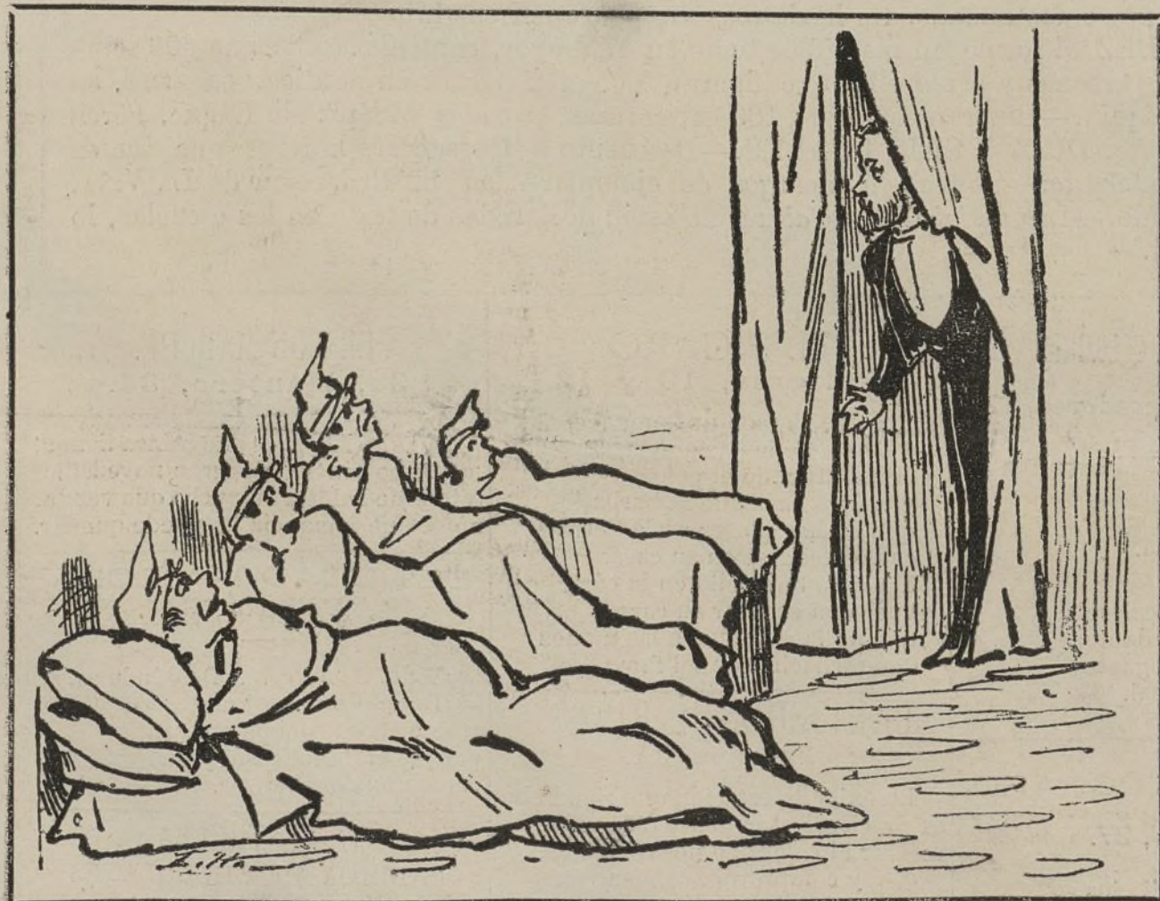
Vista del salon de Conferencias, durante una sesion nocturna, en el instante de presentarse el pollo dando la voz de—«Señores, á votar!»