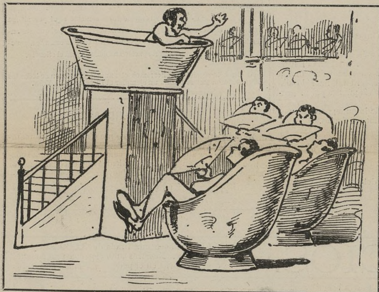
Sistema indispensable para la prolongacion de las sesiones durante el verano.