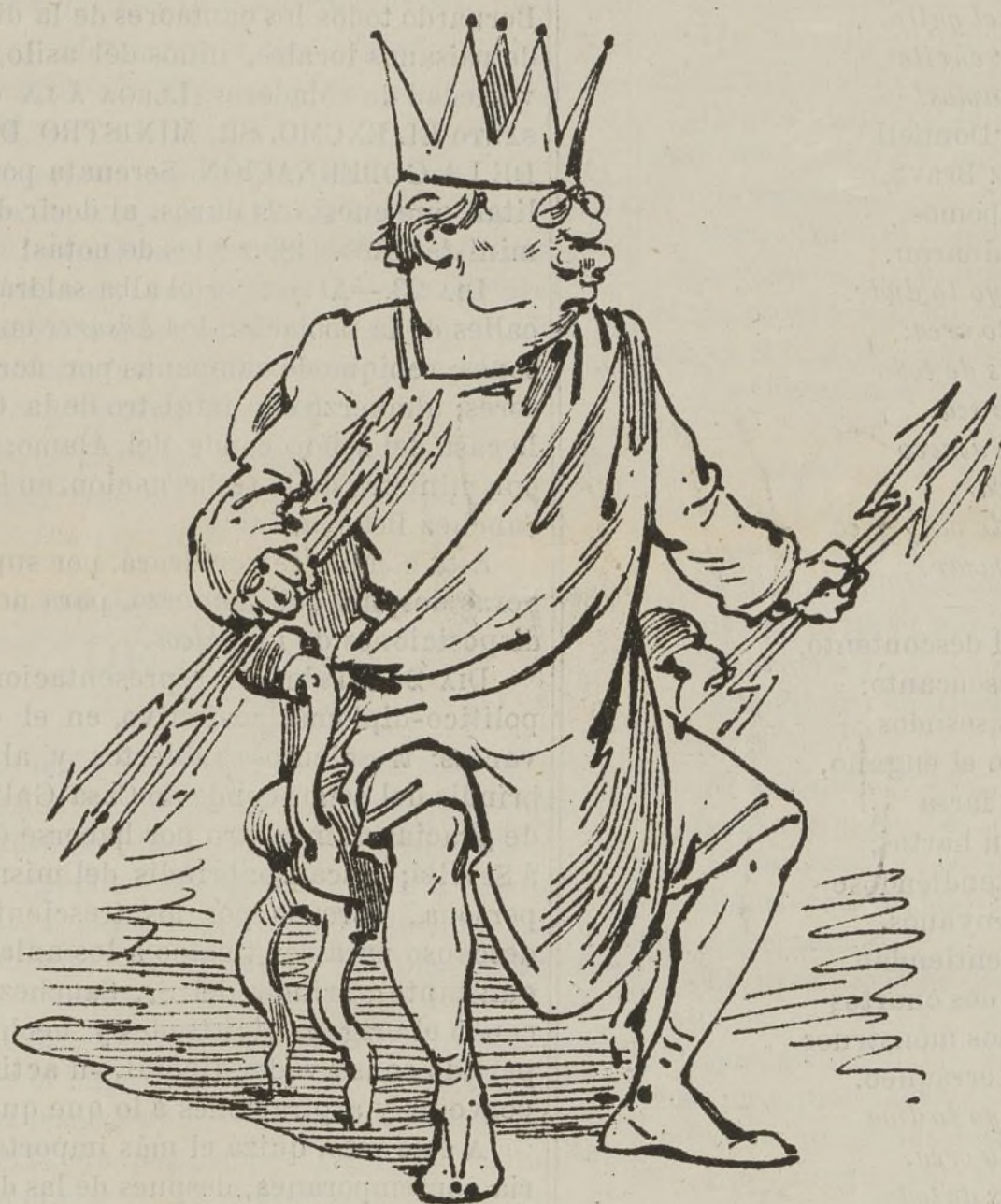
Este es Júpiter Tonante y no hay un dios que le aguante