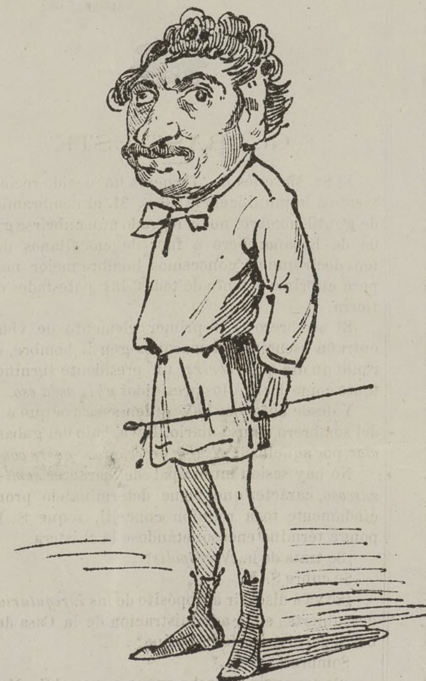
Este jóven es Adónis pero dígalo usted quedo, no lo vayo á oír Quevedo Dónis.