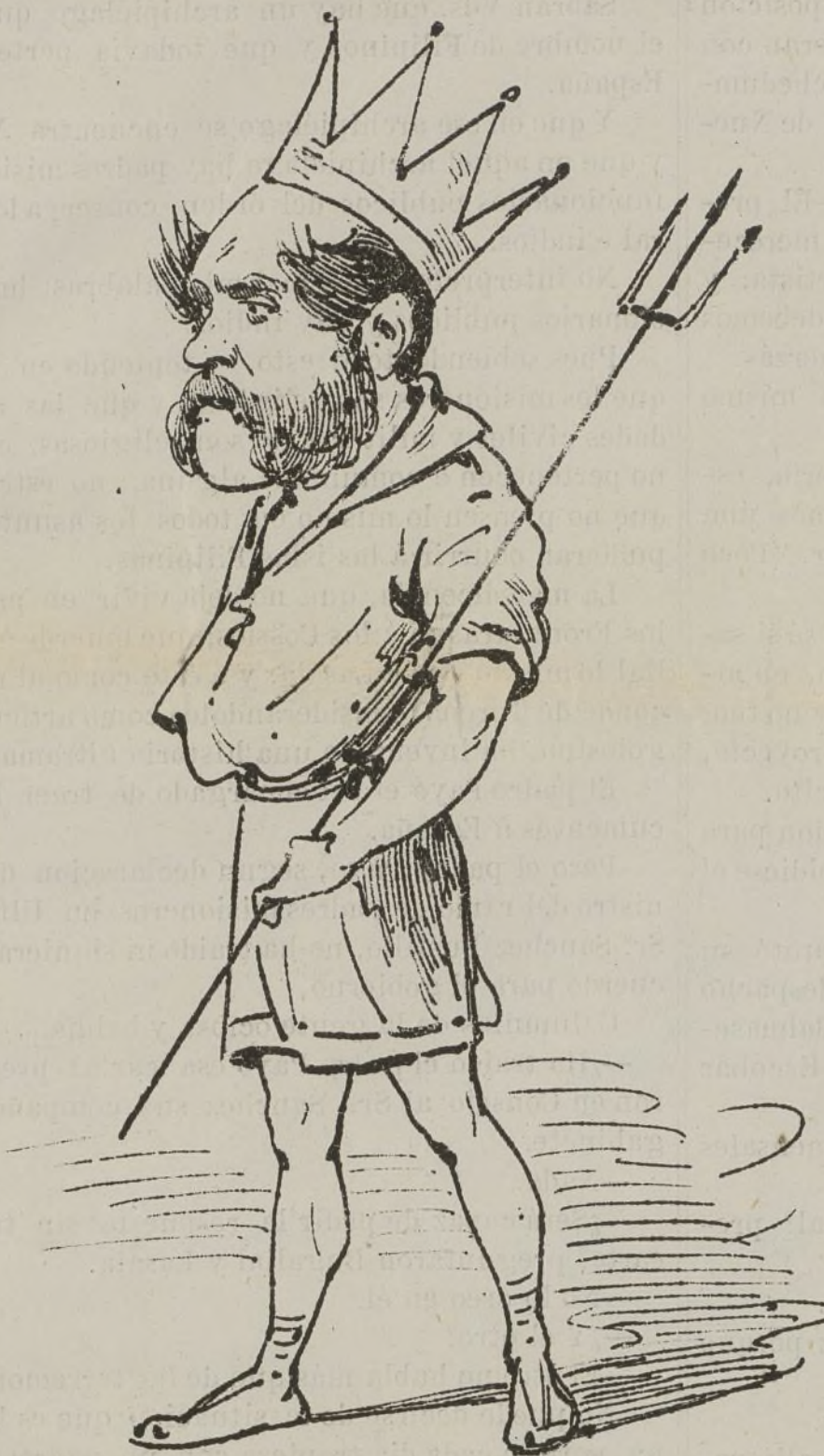
Este Neptuno de pega á todos vientos navega.