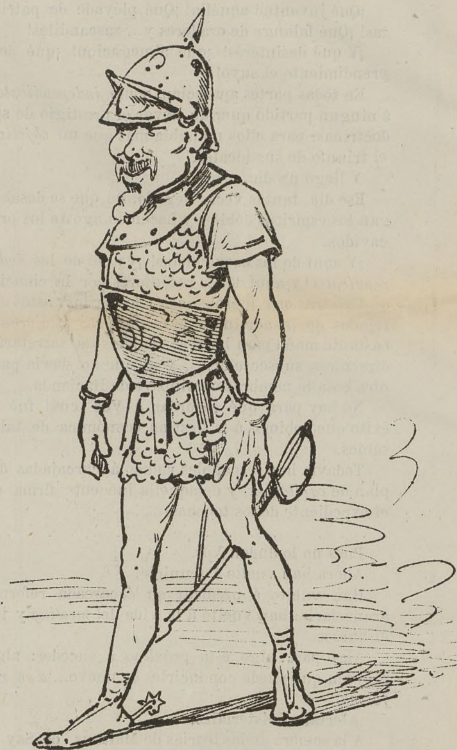
Pobre Marte! hoy se ha quedado de guerrero jubilado.