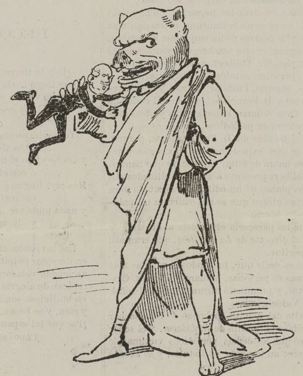
Oh Cláudio, ante ti me postro! pues ser Saturno has querido y en aras de tu partido te comes á Puñonrostro.