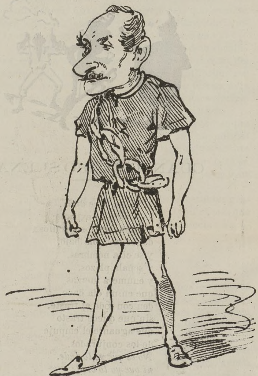
Pan, en el siglo Torneros, es Dios de los panaderos y gentil-hombre de balde, y además primer alcalde y alcalde de los primeros.