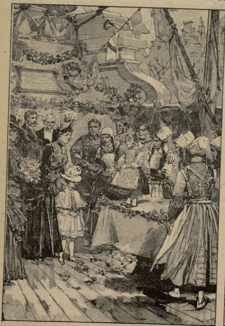
Habitantes de la isla de Marck ofreciendo á la reina una cuchara de plata.