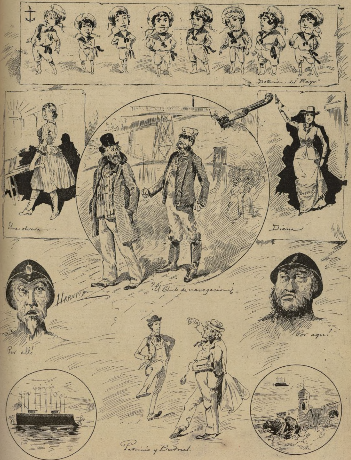
EL FANTASMA DE LOS AIRES (obra estrenada en el teatro de Variedades).