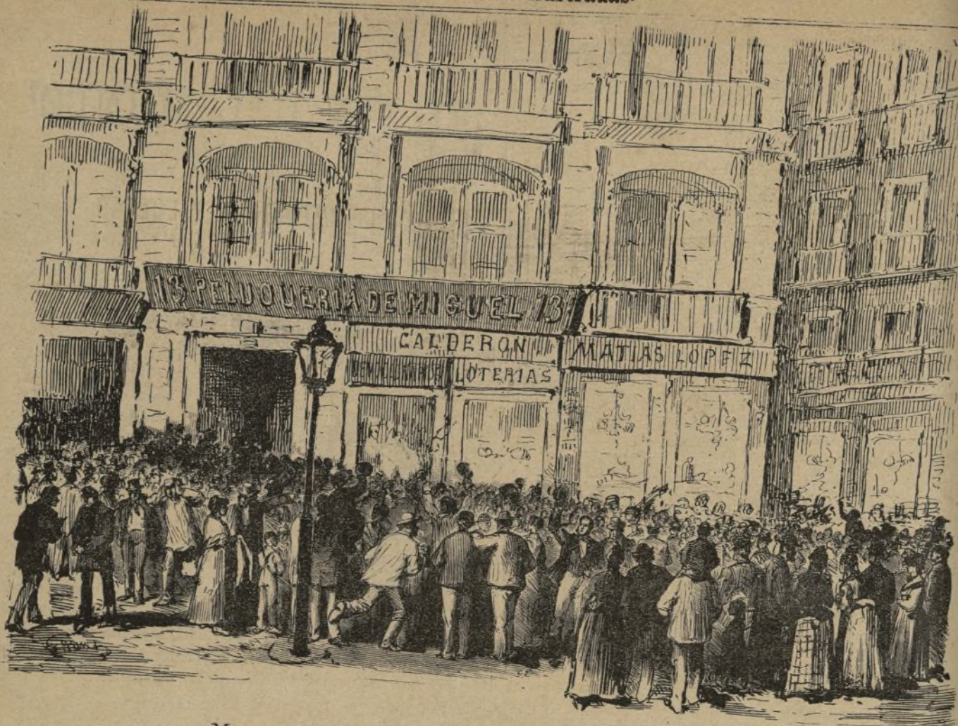
MOTIN DE LOS PELUQUEROS EN LA PUERTA DEL SOL