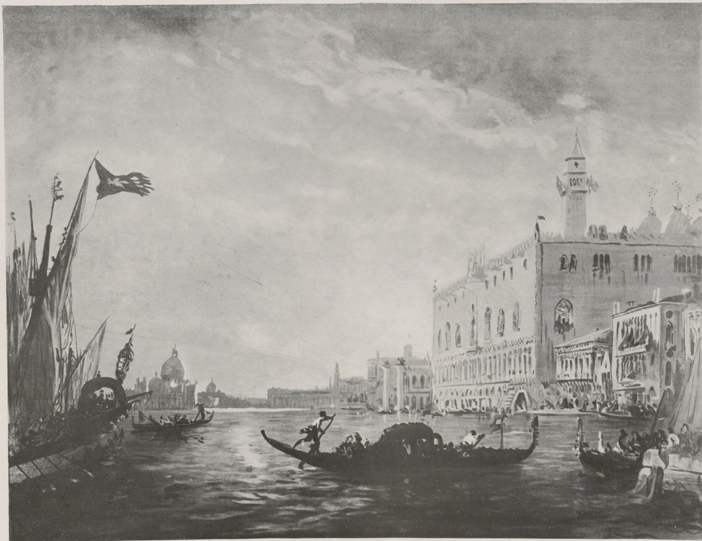
LE GRAND CANAL

n'était pas exigeant sur le prix; pour peu que la belle ne s'impatiente pas et ne craignît pas de discuter, centime par centime, on lui consentait des réductions. Pendant que les curieuses et le vendeur échangeaient des dialogues, et des œillades destinées à amener des concessions, pendant que ces curieuses, alléchées par le bon marché, écoutaient les sollicitations de leur caprice, et les appels silencieux de leur coquetterie, fouillant d'une main experte le désordre du bazar, et