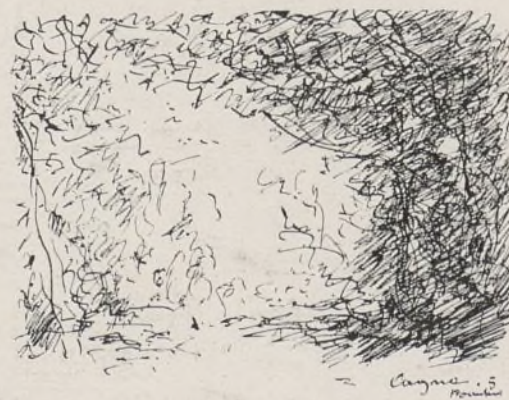
ENTRÉE DE BOIS (Croquis du 5 novembre 1904)