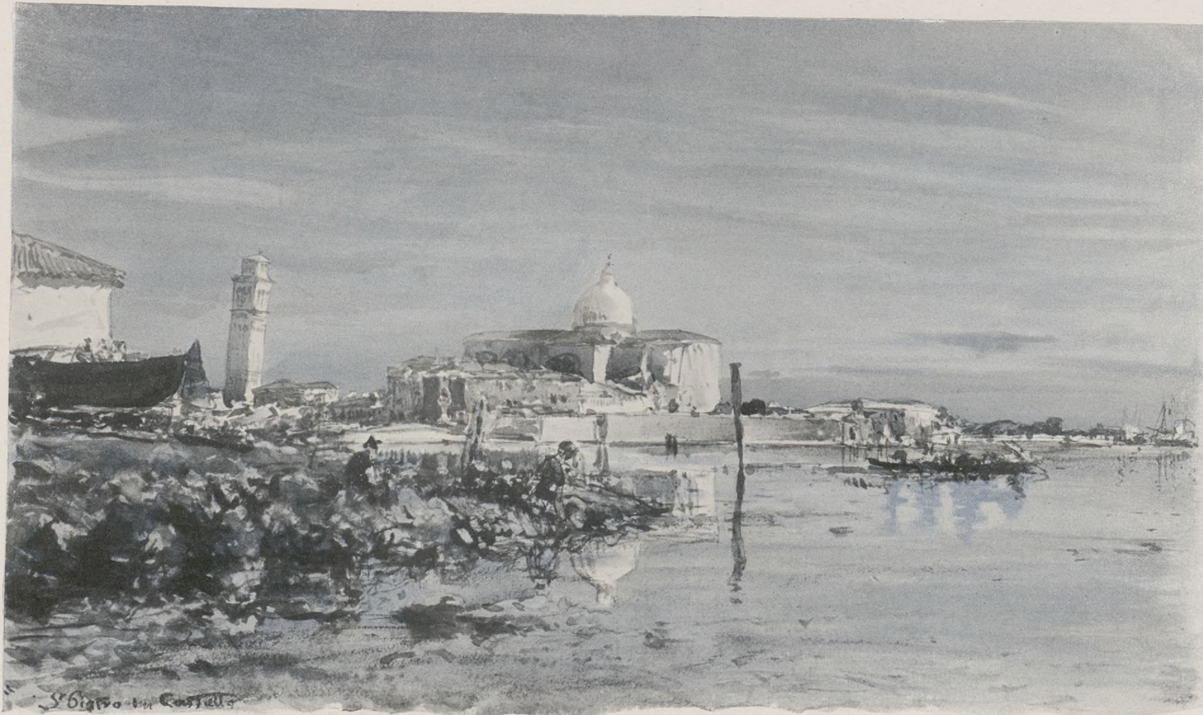
SAN PIETRO IN CASTELLO (Aquarelle)

les dômes, les églises, les palais de Sansovino, de Palladio, de Scamozzi, de Sammichele, de Tremigiano. Il leur donne une âme, il les fait vivre, il les enveloppe d'un charme, il les console de leurs splendeurs disparues par un sourire d'aurore, par un rayon de soleil; il baigne d'une ombre amoureuse et caressante leurs murailles dégradées, et il fait traîner dans l'eau comme des tapis turcs leurs reflets tremblants et diaprés de riches couleurs. Il a fait le portrait de sa ville chérie à toutes les heures du jour, des premières blancheurs de l'aube aux