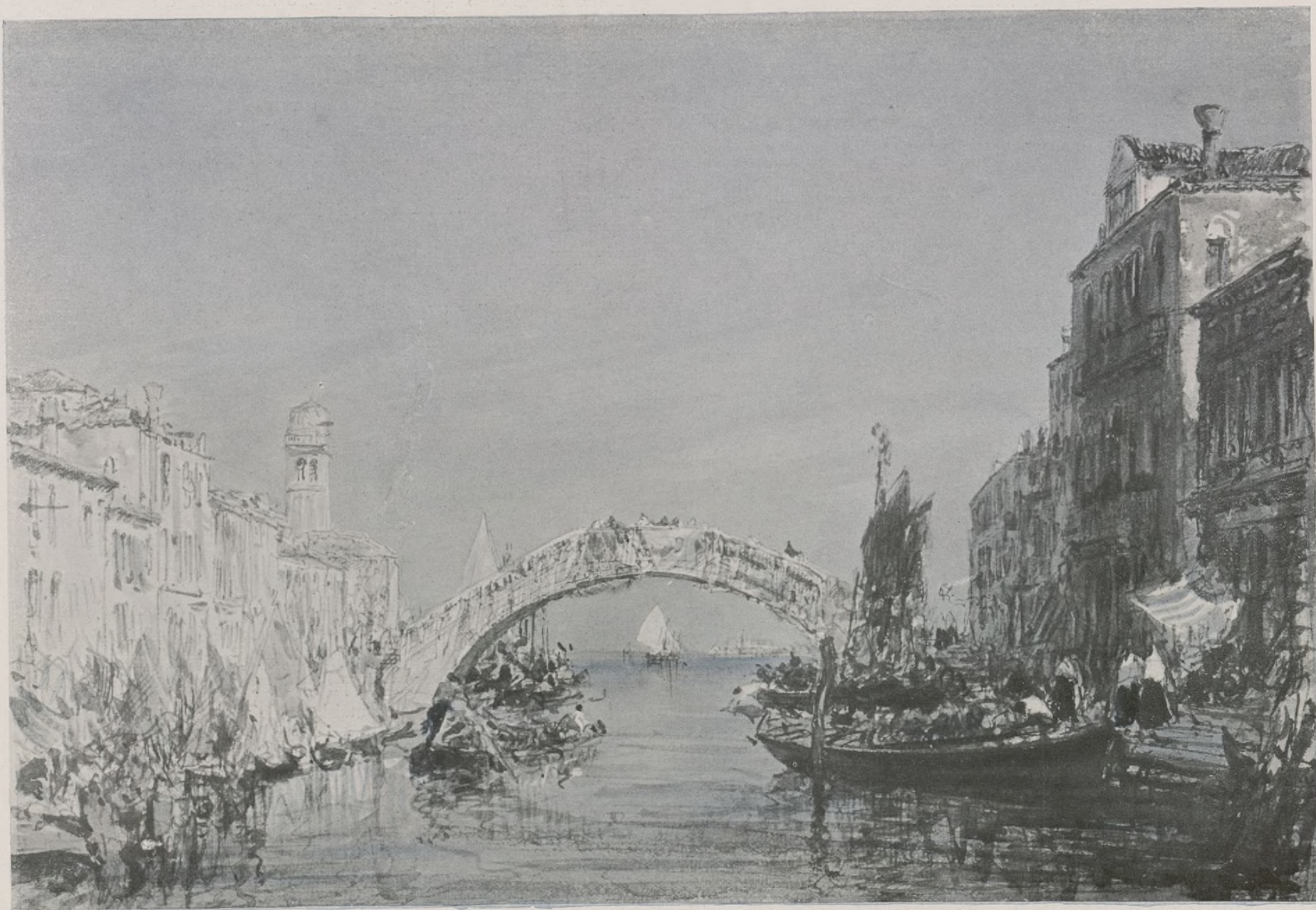
CHIOZZA (entrée). — Aquarelle

» — Seize lires, signor. » — La belle enfant, vous ne savez pas bien compter. Voulez-vous entrer dans ma boutique? » La marchande franchit le seuil. » ZIEM, qui n'avait d'yeux que pour la marchande de colombes, n'avait pas remarqué que les deux Parisiennes étaient à six pas de lui. » Quand il fut rentré dans la boutique, les deux amies s'approchèrent. » C'était une de ces petites boutiques de ce pont du Rialto, où les juifs se déguisent en grecs et en turcs, pour vendre des étoffes orientales et des bijoux d'or de Venise. » ZIEM était-il entré dans la boutique comme le premier venu? Elles remarquèrent bientôt qu'il avait l'air d'être chez