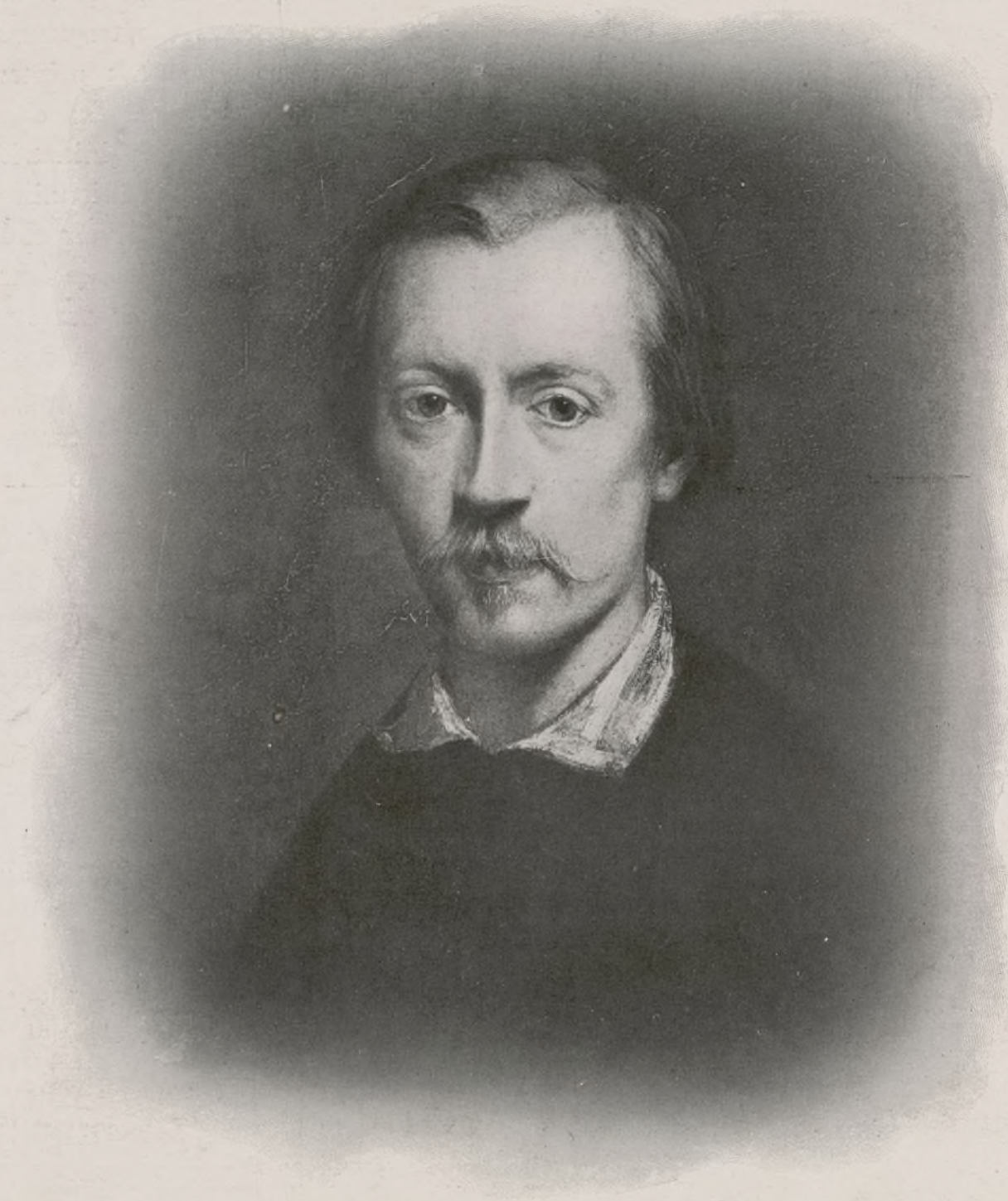
Portrait de ZIEM, par RICARD