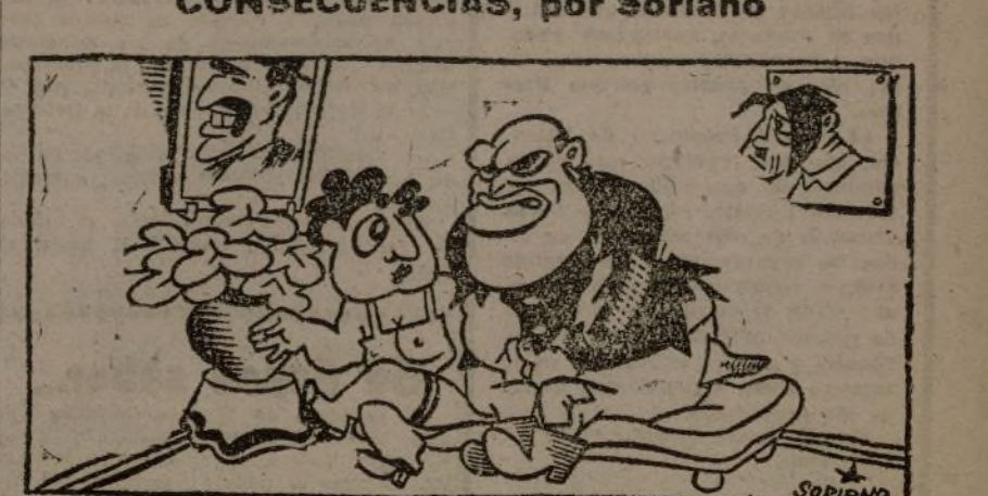
Mussolini (a Franco, a la "Betty-Boop").—¡Si esos rojos resisten, no vamos a poder resistir nosotros!