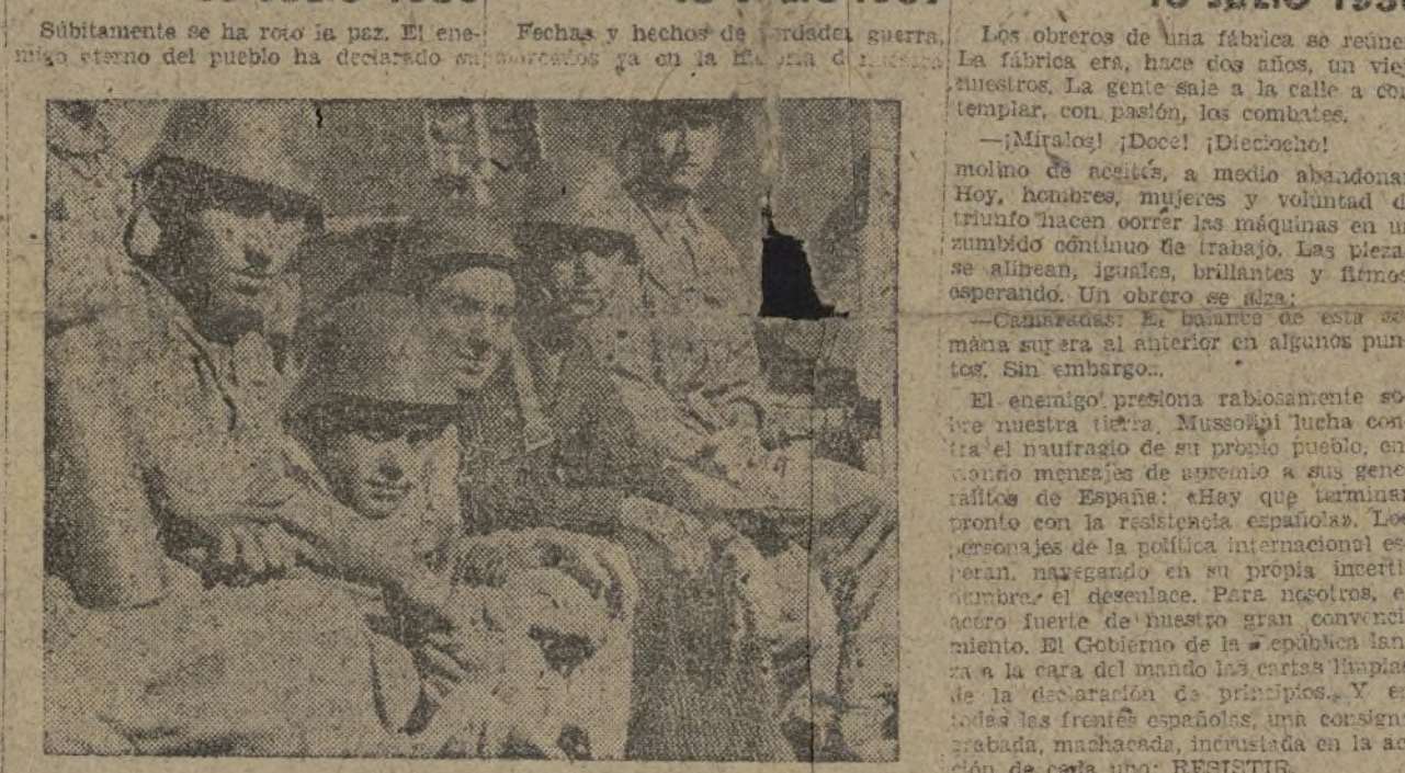
Soldados de la República. Con armas, con disciplina y con entusiasmo, bajo las órdenes de victoria de nuestro Gobierno: RESISTIR.

guerra y un aire cargado de presagios recorre España de Norte a Sur. Se miran nombres de ciudades, de generales, Las Milicias de las Juventudes Socialistas Unificadas esperan, con los ojos enrojecidos de no dormir y el coraje de la victoria, a la hora de la batalla. El Gobierno lanza sus primeras declaraciones por radio. A través de las ventanillas y las puertas abiertas, los aparatos gritan las noticias sobre los combates. Avidos que se aprietan alrededor. La situación está en manos del Gobierno. El movimiento ha fracasado. Sin embargo, el aire de la calle arde. Corren los hombres, abriendo las manos. —¡Armas! —¡Hay que armar al pueblo! ¿Es que no van a tener confianza en nosotros? Ansiedad terrible por lo que se sabe y lo que no se sabe. La amenaza escondida en los cuarteles, detrás de las persianas de las casas. ¿Qué fuerza va a explotar de un momento a otro? ¿Qué ha pasado ya? Unas mujeres lloran oyendo las noticias precursoras de sangre. —El pueblo deberá estar preparado para todo! —¡El estallido está dado. Por las calles corren los primeros disparos. España se abre, desentrañándose. Y entre tanta amenaza y tanto horror, avanza un pueblo, preparando sus pulpos para defenderse. —¿Dónde vas? —¡A tal sitio! ¡Dan armas! Ya se alaba en nuestro suelo la estampa segura del hombre del pueblo, apurado al fusil con manos fuertes.