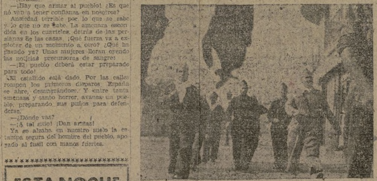
Los primeros milicianos de la República marchando a la lucha, reemplazando fusiles con entusiasmo.

guerra y un aire cargado de presagios recorre España de Norte a Sur. Se miran nombres de ciudades, de generales, Las Milicias de las Juventudes Socialistas Unificadas esperan, con los ojos enrojecidos de no dormir y el coraje de la victoria, a la hora de la batalla. El Gobierno lanza sus primeras declaraciones por radio. A través de las ventanillas y las puertas abiertas, los aparatos gritan las noticias sobre los combates. Avidos que se aprietan alrededor. La situación está en manos del Gobierno. El movimiento ha fracasado. Sin embargo, el aire de la calle arde. Corren los hombres, abriendo las manos. —¡Armas! —¡Hay que armar al pueblo! ¿Es que no van a tener confianza en nosotros? Ansiedad terrible por lo que se sabe y lo que no se sabe. La amenaza escondida en los cuarteles, detrás de las persianas de las casas. ¿Qué fuerza va a explotar de un momento a otro? ¿Qué ha pasado ya? Unas mujeres lloran oyendo las noticias precursoras de sangre. —El pueblo deberá estar preparado para todo! —¡El estallido está dado. Por las calles corren los primeros disparos. España se abre, desentrañándose. Y entre tanta amenaza y tanto horror, avanza un pueblo, preparando sus pulpos para defenderse. —¿Dónde vas? —¡A tal sitio! ¡Dan armas! Ya se alaba en nuestro suelo la estampa segura del hombre del pueblo, apurado al fusil con manos fuertes.