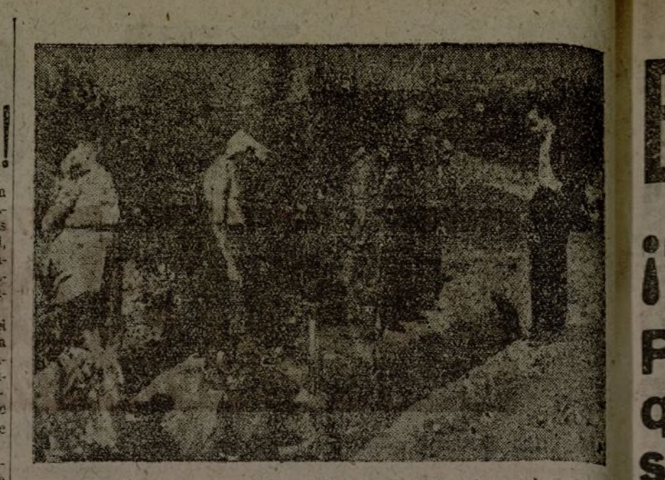
Los diputados valencianos visitan a los fortificados de nuestra ciudad