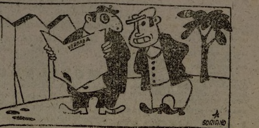
—Ahora sí que va eso de la cretina de voluntarios.