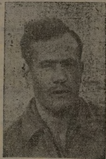
El heroico coronel coronel Torralba, magnífico artífice de nuestra resistencia.

La aviación extranjera ha actuado con enorme intensidad durante todo el día.