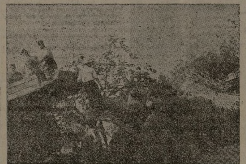
Los soldados laboran en las trilladoras el pan del pueblo

tuvieron para arrostrar las fatigas y el dolor de una evacuación, a través de cientos de kilómetros y con una perspectiva problemática. En el horizonte, desdibujado, había una interrogante; pero sobre la tierra