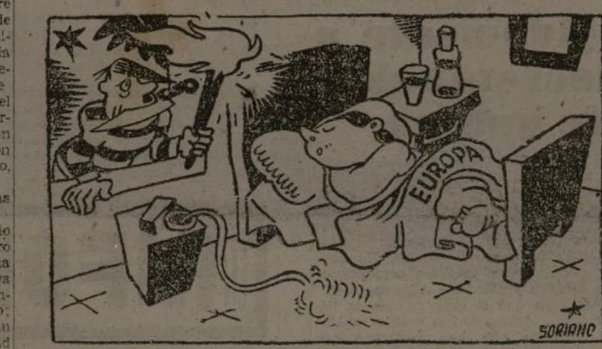
HITLER HA EMPEZADO SUS MANIOBRAS...