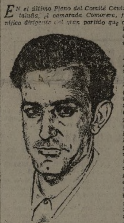
Este es el que piensa y hace Cataluña.