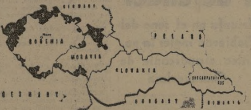
Mapa de las distintas regiones de Checoslovaquia. Las zonas marcadas de negro son aquellas en las que existe una influencia nazi. Las 1 y 2 forman la región de los sudetes. Como se ve es una parte mínima del territorio checo el sujeto a esta influencia.

Paris, 2.—Según informaciones de Washington, durante las conversaciones que el presidente Roosevelt celebró con varias personalidades diplomáticas extranjeras, dijo que los Estados Unidos están moralmente al lado de Inglaterra y de Francia y ayudarán a estos países a defender la paz, peligrosamente amenazada. El presidente americano reconoció que Francia debe respetar sus compromisos con Checoslovaquia, diciendo que la posición de la misma que la de los Estados Unidos hacia el Canadá. Los círculos de Washington no son muy optimistas, porque piensan