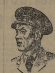
retransmitirlas perfeccionadas e idealizadas.

Son los comisarios, según manifestación de nuestro Gobierno, la expresión del espíritu de todo el pueblo español en armas, en lucha por su libertad e independencia; son los comisarios, los representantes directos de la política de guerra y de Unión Nacional de nuestro Gobierno en el Ejército; son los comisarios los más fieles centinelas de la política de resistencia, de lucha, de unidad y de triunfo que encarna nuestro Gobierno y dirige, con pulso de hierro, nuestro presidente, doctor Negrín; a los comisarios nos incumbe la mayor responsabilidad ante nuestro pueblo, nuestro Gobierno y ante la Historia, y unos y otros exigen que nuestro trabajo diario sea una superación constante.