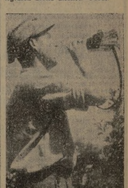
Un soldado del glorioso Ejército Popular. Símbolo magnífico de la gesta admirable que los soldados republicanos están escribiendo frente a las acometidas desesperadas del fascismo italiano, invasor de nuestro suelo, que está dejando sobre la tierra heroica de España lo mejor de sus hombres y de su armamento.

tuaria de Barcelona, huyendo perseguidos por dos cazas propios, que no lograron darles alcance.—Febus.