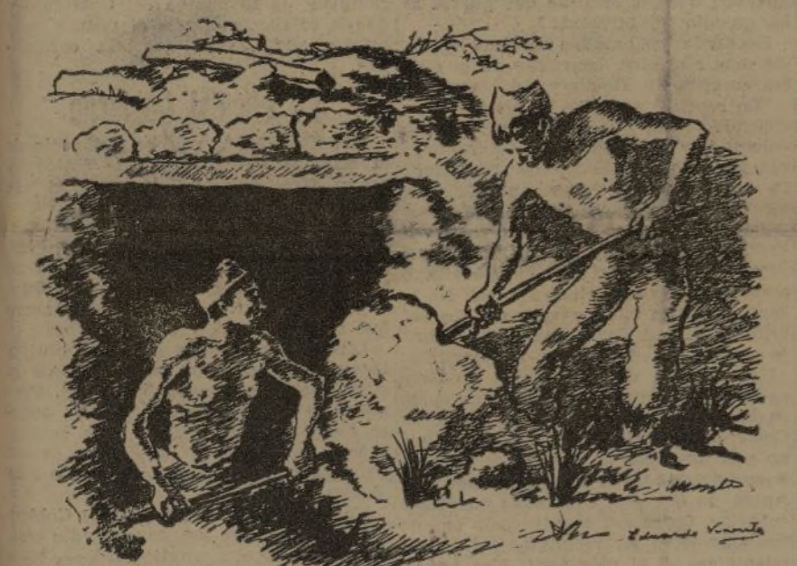
LA INFANTERÍA FORTIFICA

pues periódicamente aquel se ha presentado a dar cuenta ante la Diputación Permanente de las Cortes. Dice que desde la última reunión parlamentaria han habido dos modificaciones en el Gobierno y hace historia de las crisis y de la tramitación de las mismas. Recuerda que desde mayo de 1937, en que aceptó el cargo de jefe del Gobierno, recomendó una política de resistencia y considera que esta política estaba acertada. Refiriéndose a los motivos de la última modificación ministerial, dice que el Gobierno tenía tres proyectos de ley, que eran: La militarización de las industrias de guerra, la militarización de los Tribunales especiales de Justicia y la creación de una Sala especial dentro de los Tribunales de Justicia, destinada a los delitos de contrabando y evasión de capitales. El Partido de Esquerra Republicana estimó que esto era una mermada de las funciones de la Generalidad y me encontré—agregó—al regresar a España—pues yo estaba ausente aquellos días—con la dimisión del señor Aguirre, y por solidaridad con este último, la del señor Trujillo. Realicé cuantos esfuerzos pude por retener a estos (Pasa a la segunda.)