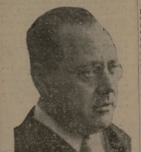
la nueva España sobre una amplia y sólida democracia campesina, dueña de la tierra que trabaja.

Pero el 18 de julio pone frente a frente a las dos Españas. Una que trae y empuja todo lo podrido y negro de la historia de las opresiones. Otra que quiere el pueblo, que quiere a su patria, que quiere lo progresivo y avanzado. Y el campesino, por primera vez, se encuentra dueño de sus tierras. El campesino ama a la tierra, y día y noche se preocupa de ella como si fuera su hija.