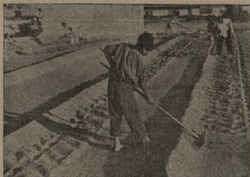
El decreto del 7 de octubre, al entregar la tierra a los campesinos, a perpetuidad, exige de éstos que la trabajen y que aumenten la producción, salvando nuestra economía y defendiendo contra los invasores el propio decreto-ley. (Foto España).

VALENCIA, domingo 16 de octubre de 1938. - 25 cts. - Vilaragut, 5. - Teléfono 12837. Tercera época - Año II. - Núm. 380