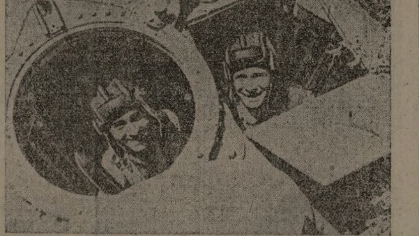
Antes de cerrar el llaque para lanzar se contra el enemigo, los tanquistas sonríen, seguros de la victoria.