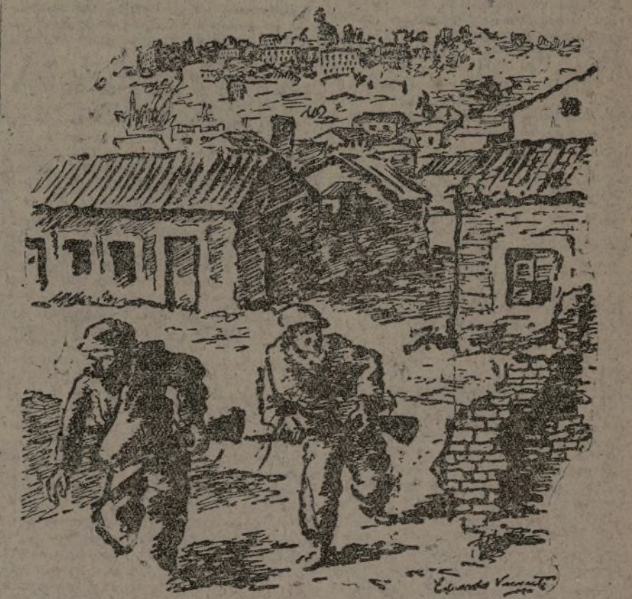
Así se solía a defender Madrid aquellos días Dibujo de Eduardo Vicente

Hoy Madrid se nos antoja más grande en su misma satisfacción y en su espíritu de independencia nacional; porque Madrid, el 7 de noviembre, y con Madrid la Patria entera, demuestran al mundo que España no tiene, ni tendrá, ni Madrid es Viena o Fraga, y las salpicaduras de esa ola de oprobio y vergüenza que recorre el mundo, desatada por las traiciones de Londres y de París, no nos han de alcanzar, porque el pueblo y el Ejército españoles se mantienen en guerra intransigente contra el agresor, con voluntad que nadie puede romper; que nada pueda doblegar ni mediatizar, porque se cimenta en el amor a España en todas sus dimensiones geográficas.