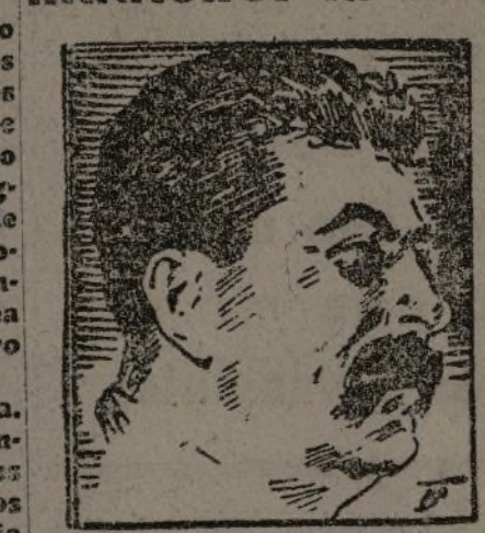
El camarada Stalin