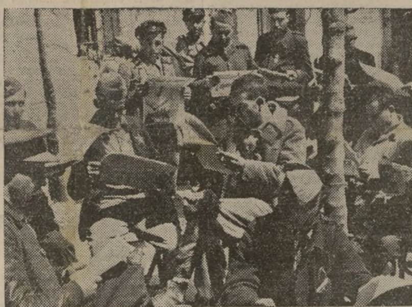
Nuestros soldados no capitulan, se instruyen, luchan...

Muchos no aciertan a comprender cómo un soldado de la República puede ganar diez pesetas. Ni mucho menos se les alcanza que un proletario auténtico, un campesino, un hijo del pueblo, en suma, pueda ser jefe de una brigada, de una división o un cuerpo de ejército. Aparte de que en el campo rebelde les dijeron que aquí embandaban los rusos y que todos éramos rojos «hasta de color», tienen la experiencia de no haber obtenido jamás un ascenso. Allí un hijo del trabajo no puede ser otra cosa más que soldado. Las estrellas son para los aristócratas, para los de sangre azul y para los italianos y alemanes... Se imponen los privilegios