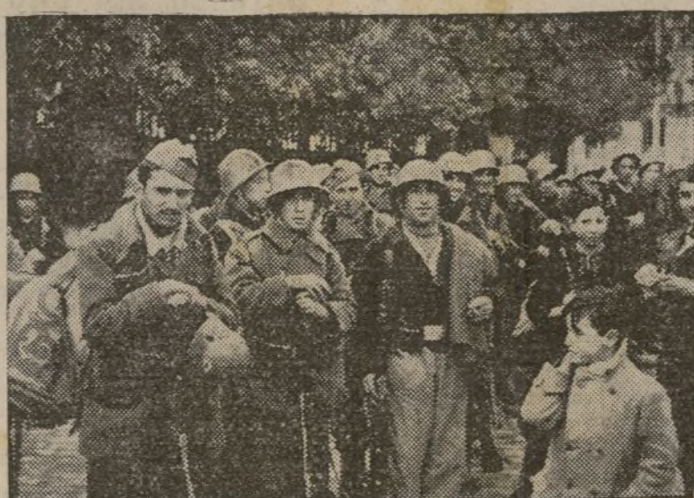
A los soldados de la República los viste y cuida el pueblo.

Pero hay más todavía. Los prisioneros rebeldes tienen, por lo regular, una idea muy vaga de la cultura. Los han