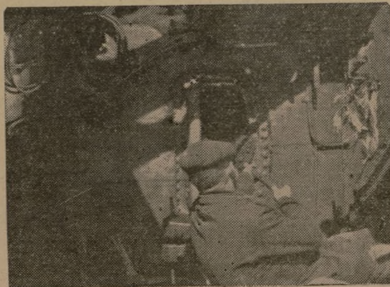
Trabajo duro, en jornadas inacabables. Los obreros del ferrocarril ayudan así a ganar la guerra.

De vez en cuando, la parada fúgase en algún andén somnoliento. Los buelcillos duermen sus inquietudes o