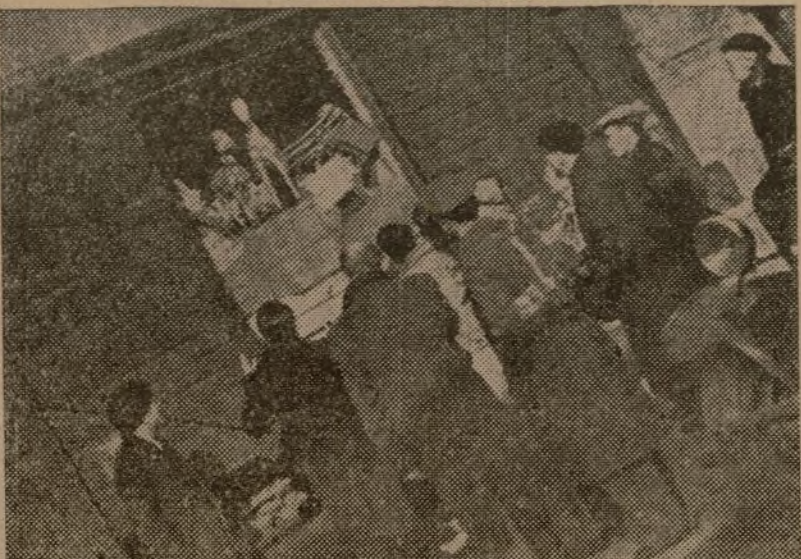
En la estación de Barcelona se procede a la entrega de las 140 toneladas de ropas, víveres, juguetes, etc., envió del Socorro Popular de Francia