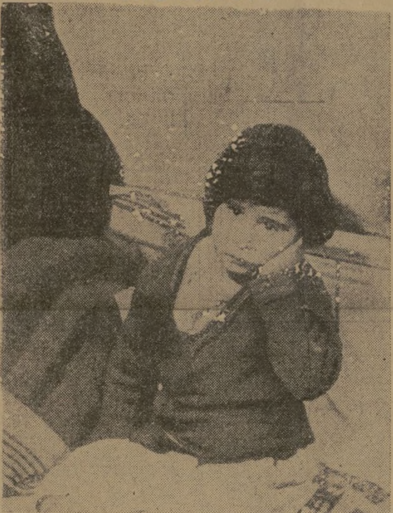
«Uno de los señoritos falangistas se abalanza furioso sobre una niña de ocho años y la abofetea.»