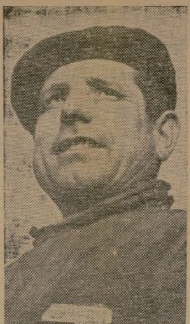
Un obrero ferroviario

—Yo creo que ningún antifascista rehuiría los sacrificios que exige la guerra; pero entiendo que sería con-