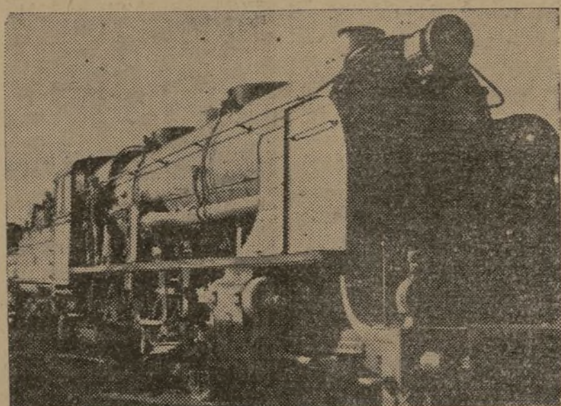
La locomotora va enhebrando en sus ruedas la cinta del carril.

nista VERDAD y quisiera contar a los trabajadores cuál es vuestra tarea, cómo cumplís vuestra misión, de qué manera ayudáis a la guerra.