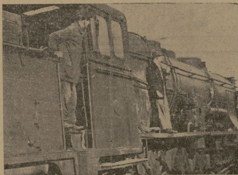
La máquina descansa en la tranquilidad de un andén logareño

—Sólo lamentamos que estas largas jornadas nos obliguen a veces a no comer. Cuando salimos de casa, a veces avisados con sólo unas horas de anticipación, no podemos preparar merienda ninguna. Luego, en el trayecto, es aún más difícil procurarse