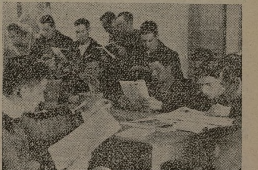
Las horas de descanso no se pierden estérilmente en nuestros frentes. Durante ellos, nuestros soldados estudian, capacitándose y preparándose