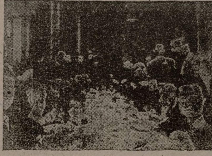
El pasado domingo se celebró en el Conservatorio el homenaje a los intusos e inválidos de guerra. Una gran cantidad de héroes asistió, emocionadamente, al acto, que fué magnífico por lo que significó de solidaridad y de cariño. Aspecto parcial del salón durante el almuerzo. (Foto España).

Belgrado, 11.—Ha llegado al ministro rumano de Negocios Exteriores, Miceco. Celebró una conferencia con el presidente del Consejo, Stoyadinovich.—Fabra.