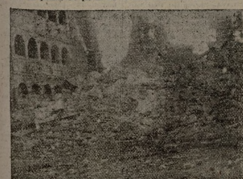
Y esto es lo que fue el Seminario, últimos reducidos de los fascistas