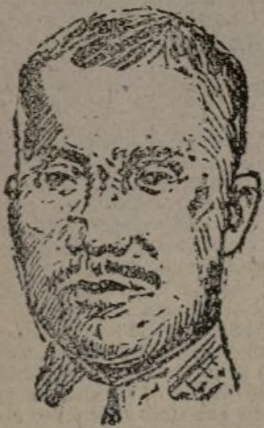
EL GENERAL TCHU-DE

Los periódicos de estos días registran las nuevas victorias del Ejército chino, que en los últimos combates que ha sostenido con las tropas japonesas ha causado enormes pérdidas a los invasores. A la cabeza del Ejército chino está el general Tchu-de. El fue uno de los creadores del Ejército Rojo chino. Actualmente es miembro del Comité Central del Partido Comunista de China. Participó activamente en la revolución de 1911 y en la de 1925-1927. De 1927 a 1929 ha sido el jefe de los destacamentos de guerrilleros rojos en el sudeste de China.