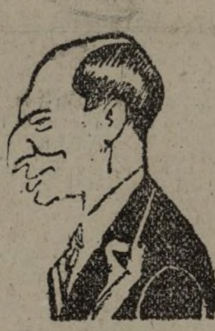
DELBOS Ministro de Negocios Extranjeros