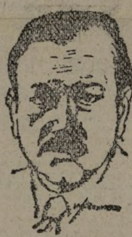
DALADIER Ministro de la Guerra