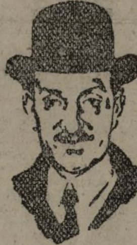
CHAUTEMPS Presidente del Consejo