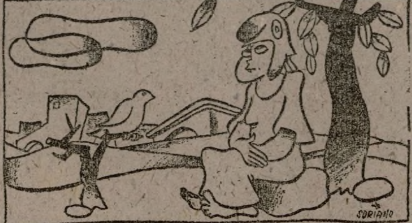
La palomita.—Cuando yo duerma, vigila tú... La democracia.—Tú, y si te da a ti cuando duermo yo.