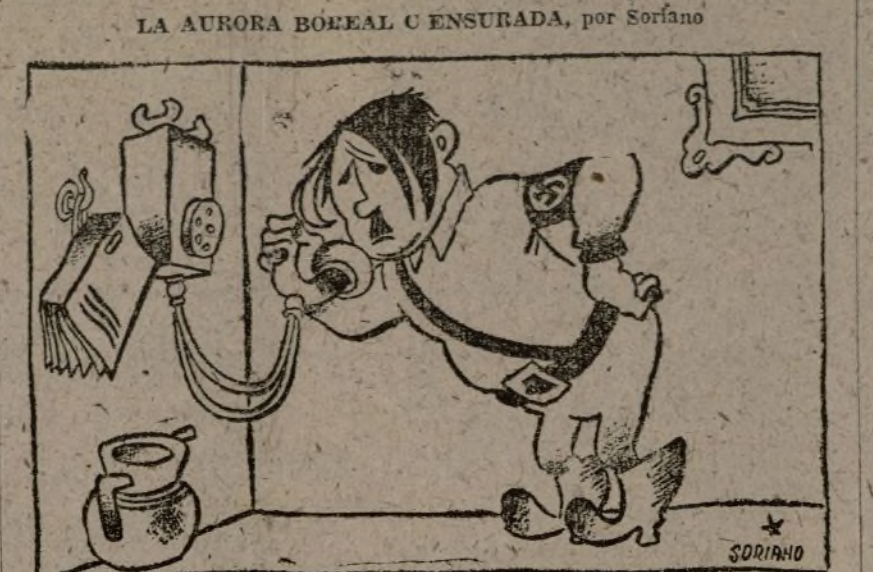
Hitler.—¿Ahí el departamento de Meteorología?... Bien... ¡Queda suprimida en Alemania la aurora boreal en rojo!... ¡Que no se repita!