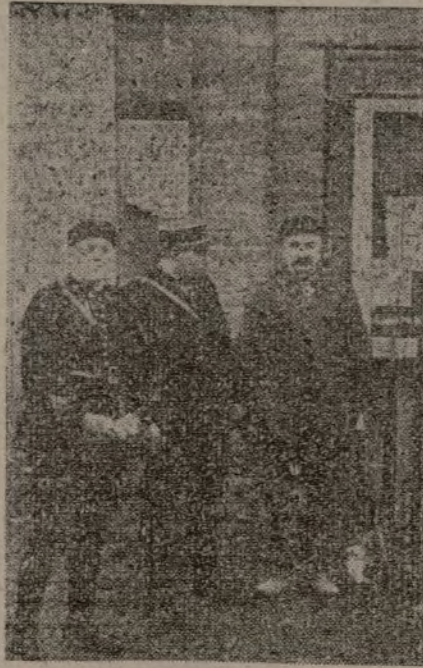
Un importante depósito de armas de los conspiradores fascistas descubiertas cerca de Amiens