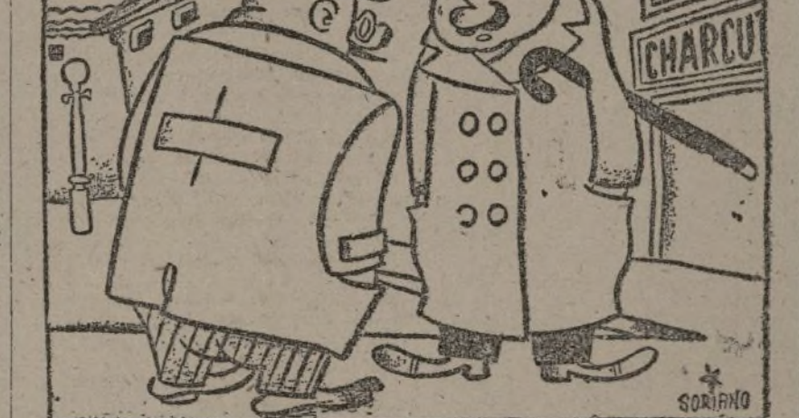
—Creo que estas reuniones me recuerdan aquel principio que dice que el mundo gira alrededor de un eje.

Finalmente, a propuesta del camarada Barón, representante de los carpinteros de taller, se aprobó la gestión de la minoría municipal y se suspendió la asamblea hasta que la Ejecutiva de la Casa del Pueblo convoque nuevamente.—Fébus.