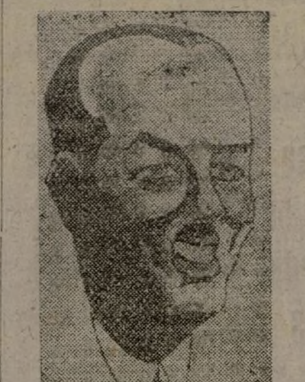
VAN ZEELAND El ex premier belga, autor del plan para la reorganización internacional económica y financiera elaborado, que va a ser discutido la presente semana en la Cámara de los Comunes londinense