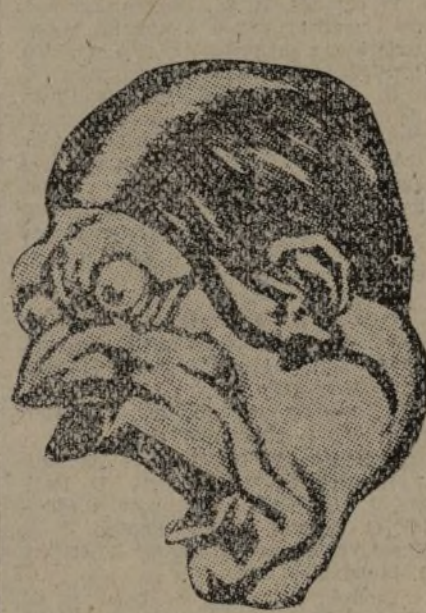
El autócrata que ha asumido todos los poderes.

La tiranía fascista: Hitler concentra todos los poderes en sus manos y se rodea de un "Consejo privado secreto", para la política exterior