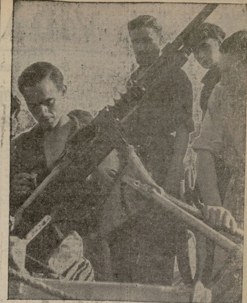
Examinando cuidadosamente las ametralladoras, que infunden terror a los aviadores facciosos.

Las víctimas y daños ocasionados por estos bombardeos son escasos.