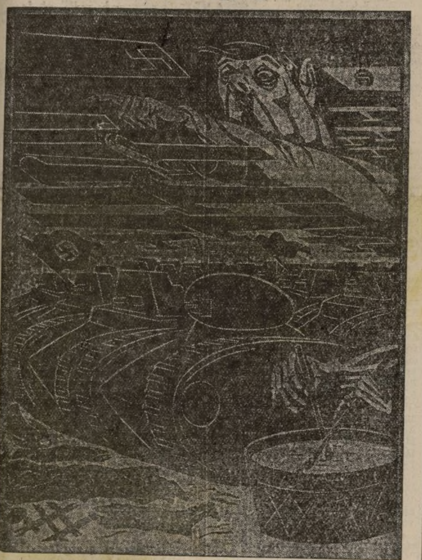
Hitler conduce a la guerra y a la catástrofe al pueblo alemán