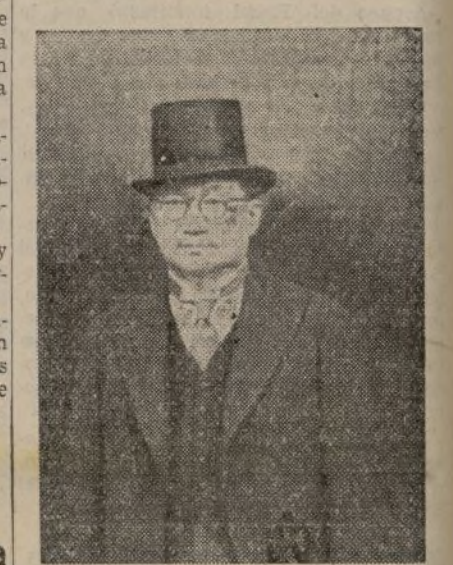
HANKEU.—M. King, nombrado presidente del Gobierno chino, en sustitución de Chan-Kai-Shek, que consagra ahora toda su actividad a la dirección de las operaciones militares.

Agregó que el vizconde de Ishii viajó por Europa por motivos de salud; pero que no irá a Londres. Refiriéndose después al envío de agentes anticomunistas nipones a Roma y Berlín, dijo que estos agentes no tendrían estatuto diplomático; pero cooperarían con las autoridades de dichos países en el intercambio de información anticomunistas.—Fabra.