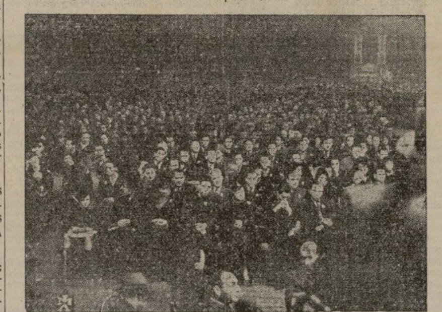
PARIS.—Una vista de la sala durante un mitin de solidaridad con la España republicana en el Velódromo de Invierno.

...No olvide que sus nietos, con sus sacrificios, están conquistando una nueva vida para España. Yo imagino a la buena abuelita de los tres nietos—de los tres nietos héroes—tomando la respuesta del teniente coronel y llevándola a guardar, con mano temblorosa, pasos leves y ojos húmedos, al arcon de las pequeñas cosas sagradas que los viejos conservan hasta el límite de su vida. Mientras, en el campo, está en pie el abril verde de los tres nietos soldados.