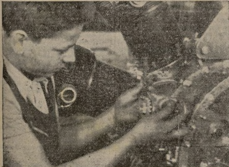
Una potente industria de guerra es el problema central de la guerra en su fase actual

Claro es que estas tres tareas fundamentales no se pueden resolver con palabras, que precisen de una labor permanente, bien dirigida por el Gobierno con un ritmo rápido y seguro, apoyada por los Sindicatos y por los partidos del Frente Popular. La solución de estas tareas fundamentales exige de las masas nuevos esfuerzos y ha de desencadenar una nueva ola formidable no sólo de trabajo, sino de entusiasmo productivo y de férrea disciplina. Por esto no hay duda que estas tres tareas las resolveremos más pronto en la medida EN QUE MARCHEMOS MAS RAPIDAMENTE POR EL CAMINO DE LA UNIDAD. Si volvemos nuestra mirada atrás y consideramos la evolución de la situación en los últimos meses, será fácil compro-