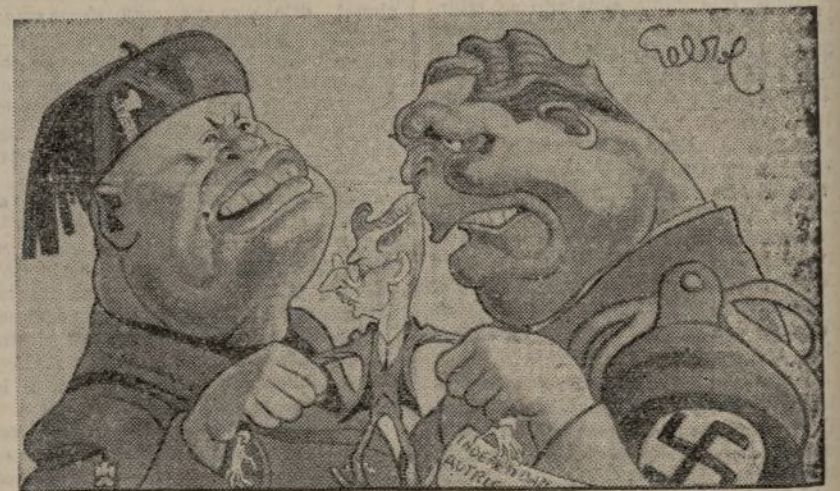
La Independencia de Austria.