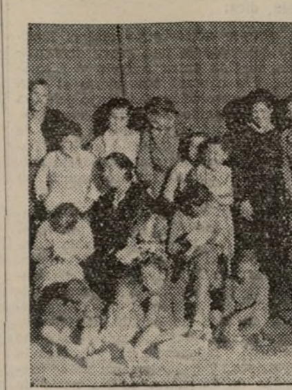
Un grupo de niños de la Colonia-Residencia de la Asociación de Empleados Municipales, U. G. T.

prendido el momento que vivimos. Lo único que pide en su proyecto, que ya nuestros lectores recuerdan, es una más perfecta regularización de salarios que les permita vivir, y lo que es más problemático para ellos, sostener la residencia que a fuerza