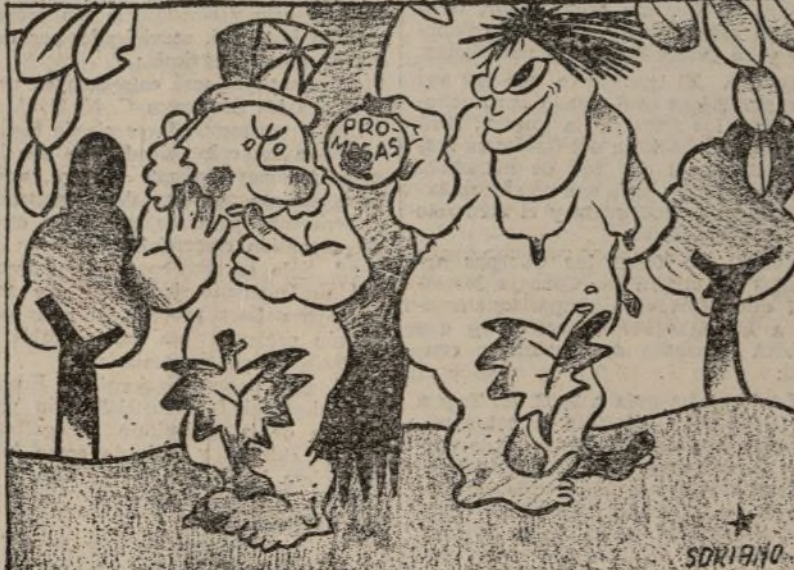
La Eva casquivana y falaz.—¡Anda, monín, muérete!