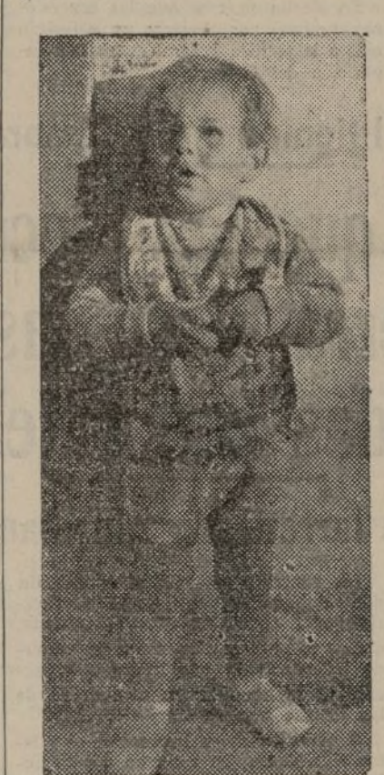
Un grupo de niños de la Colonia-Residencia de la Asociación de Empleados Municipales, U. G. T.

Para que nada les falte, tienen su salón de cine. El compañero Favieres ha "cudado" algunas películas en las que ellos salían, jugando o riendo. Una "Paté" proyecta la película en la pantalla.