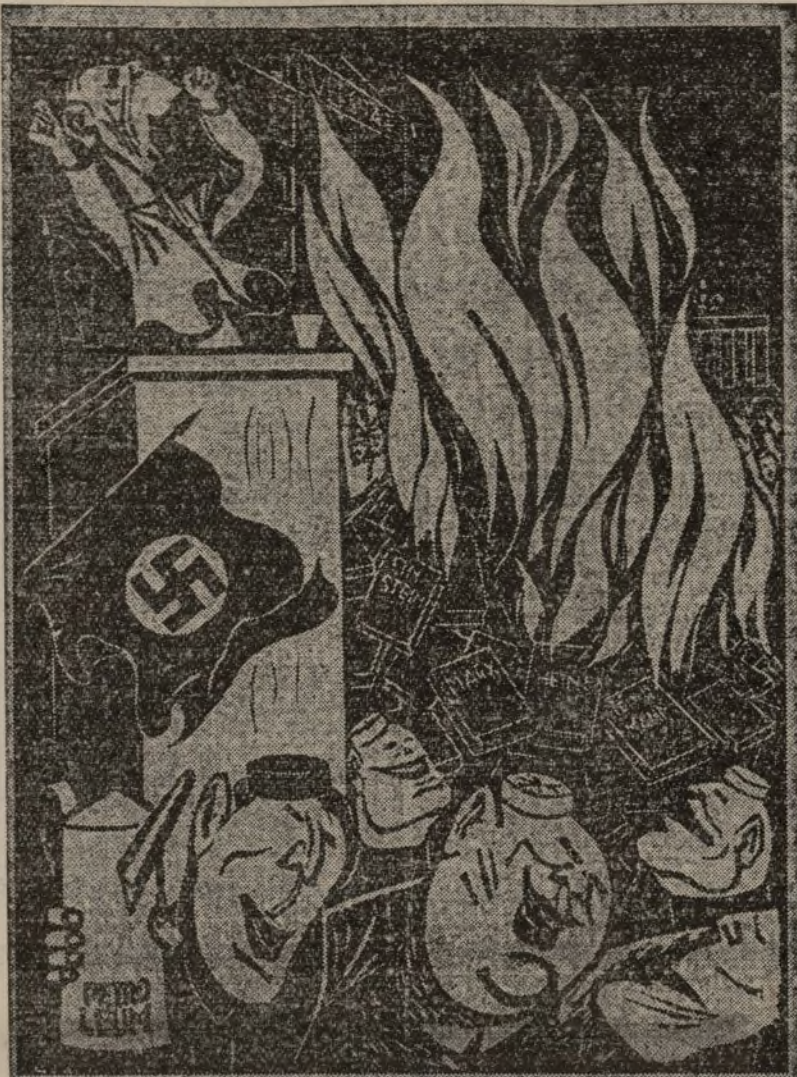
Por orden de Goebbels, fueron quemados los libros de Marx, de Heine, de Einstein y de otros hombres ilustres, patrimonio de la cultura alemana