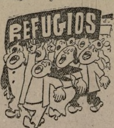
FALTA UNA LETRA

John Bull: ¿no ha llegado la hora, en tu oxidado reloj, justiciera y defensora? ¿No es un buen momento ahora para ser, John Bull, «bull-dog»?