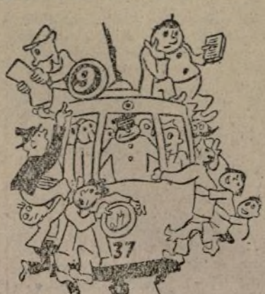
EL «CETACEO» CALLEJERO

¡Punto en boca! Esa es la fiera orden que da al pueblo Roma. ¡Punto en boca...! ¡Qué consenra! ¡Si con fascio no hay manera de que ponga punto y... coma!