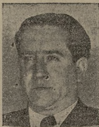
¿Cuál ha sido la posición de la F. S. I.?

Después de las conversaciones celebradas en Moscú por los representantes de los Sindicatos soviéticos y japoneses en España y China. La po-