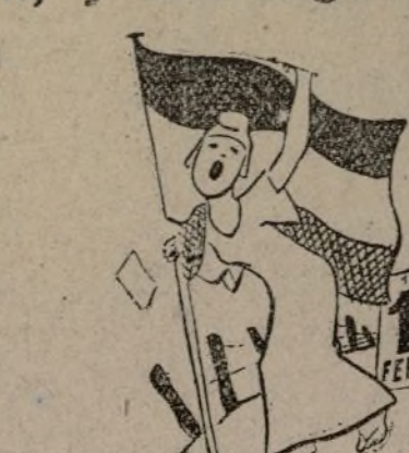
EN EL 65 ANIVERSARIO

Fide el pueblo, esperando, que se construya República... Con una «erre» está arreglado... Si. Porque ya se le han dado con exceso los... «refugios».