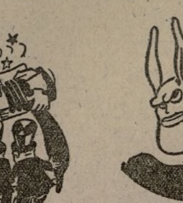
CUESTION DE EXTREMIDADES

El Gobierno que, a desgracia, el rey Carol ha nombrado, es cual comida liviana de pensión vegetariana... ¡Tal Gobierno es carol-ide!