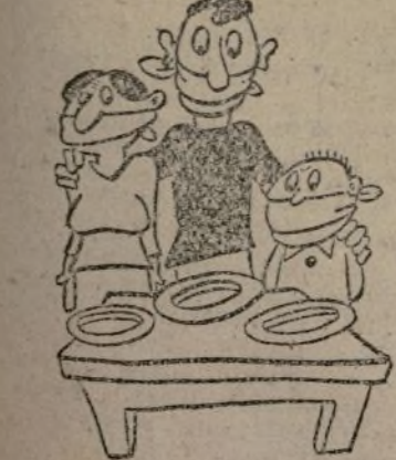
LA CALLAR Y A... AYUNAR!

Comentarios de ocasión, en tono alegre y zumbón, y sin segunda intención (Dibujos de Soriano)