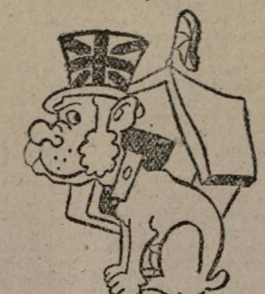
PERRO QUE GRUSE...

La tertulia tranviaria, mitad cangrejo y colmena, parece una extraordinaria «bestia» marina y gregaria... ¡No veis que siempre «ba...» llenas?