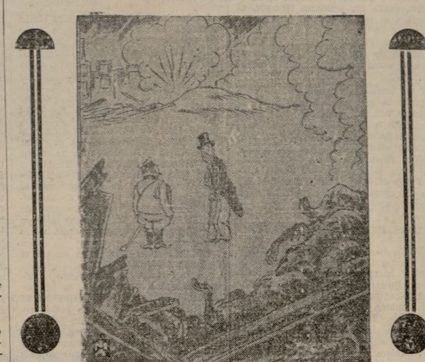
El diplomático europeo al general japonés.—Es necesario que rectiquen ustedes su conducta. Aún no hemos recibido sus excusas por las agresiones de la semana venidera.