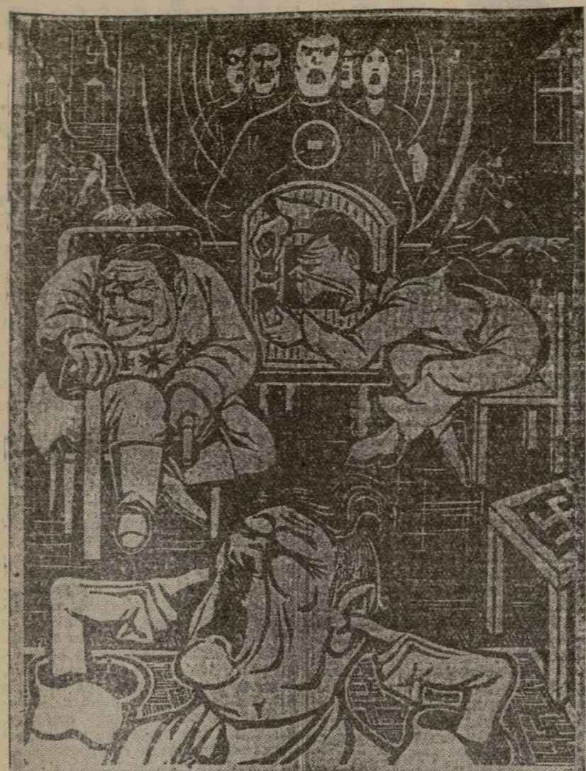
Hitler, Goering y Goebbels, escuchando la estación emisora del Partido Comunista alemán