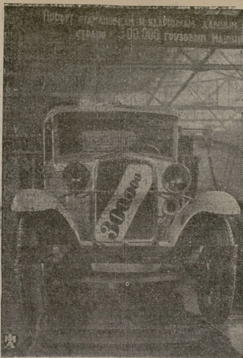
MOSCU.—El camión número 300.000 de las fábricas «Molotov». Después de seis meses de existencia, estas fábricas han construido 300.000 camiones y 69.000 autos

Diario Oficial núm. 41 de fecha 17 Febrero 1938