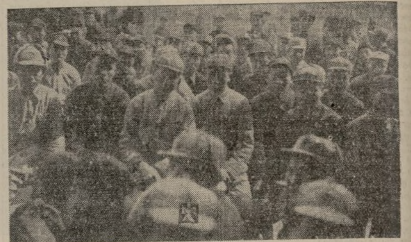
Los soldados del VIII Ejército escuchando un discurso de Mao-Tse-Tsin