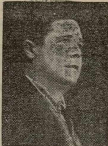
En estos difíciles momentos que vive nuestro pueblo, como consecuencia del egoísmo de las castas privilegiadas de banqueros, caciques y terratenientes, ¿cuál ha sido la política agraria de nuestro Partido?

Miembro de la Comisión Sindical del Partido Comunista de Valencia