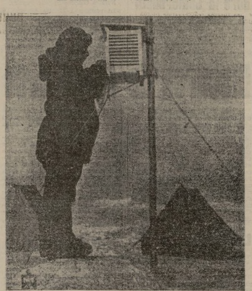
La parte principal de la estación, según las últimas noticias, indemne sobre un tramo de 50 metros de largo. Foto tomada cuando se hizo el montaje de la estación

conversaciones para la confederación de unas bases de acción común de las dos sindicales obreras de España.