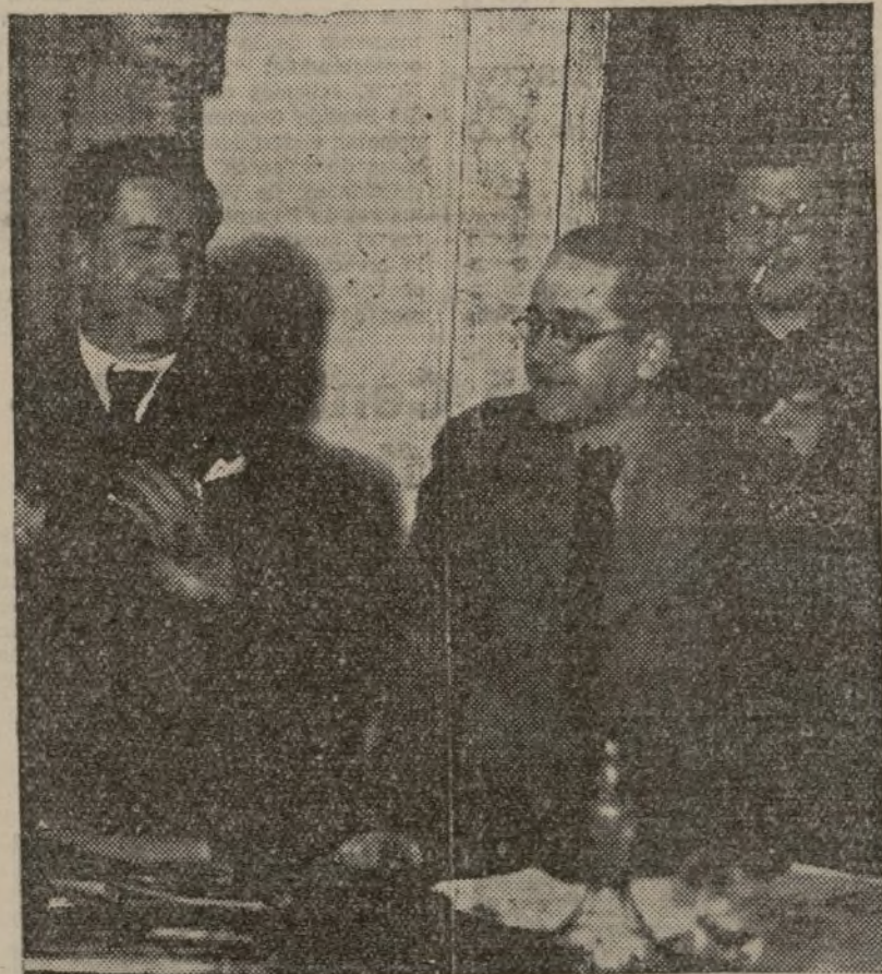
La presencia del camarada Castro, subcomisario general de Guerra, fue acogida con una estruendosa ovación dirigida al heroico Cuerpo de comisarios

La historia de nuestra guerra de independencia contra la invasión ita-