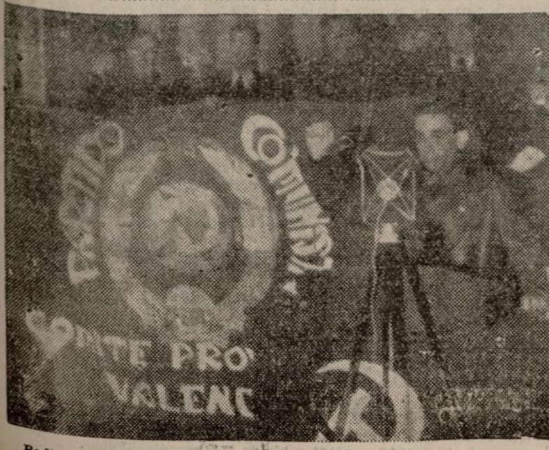
Radio Centro hace entrega de una bandera al Comité Provincial

Informe cómo ha sido posible aumentar la producción en un 300 por 100, en el lugar donde trabaja. Dice que una pieza, que antes se tardaba en hacer cinco horas y media, la hacen ahora en hora y media, habiendo logrado alcanzar este rendimiento sin