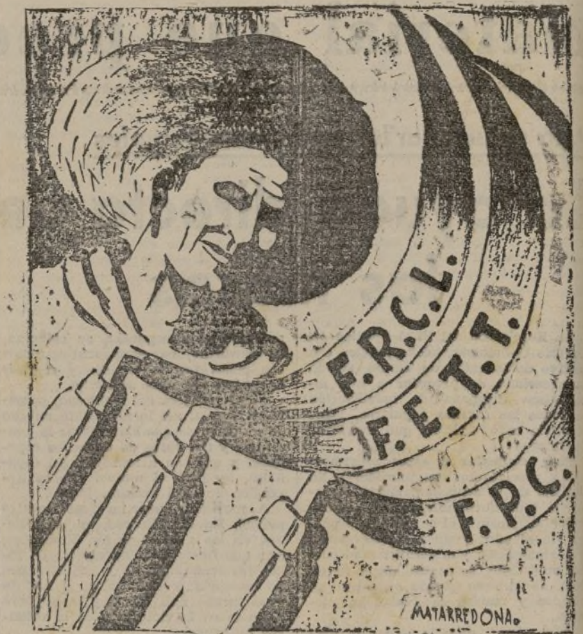
La unidad en el campo, para aumentar la producción agrícola, debe ser una tarea inaplazable para el pueblo