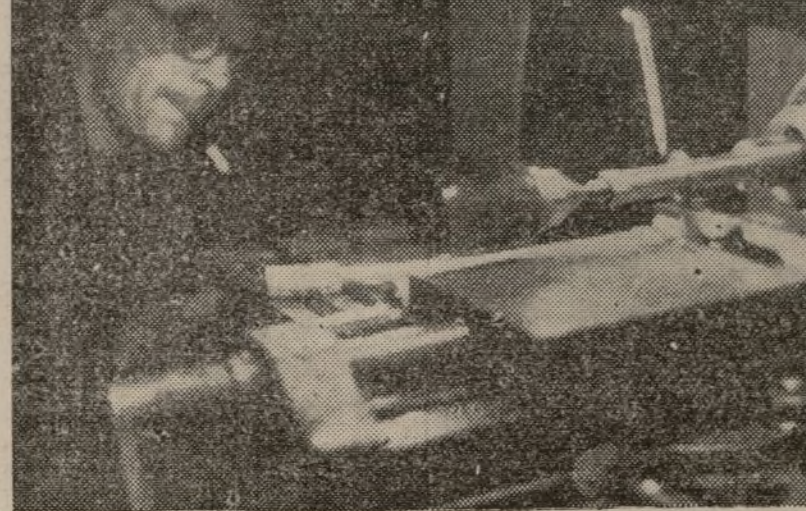
Armas y municiones! Las dos palabras que repiten incansables los tornos de las fábricas

y hasta colocar los alfileres ya constituidos en sus envases constituye una actividad única para determinados obreros. Así, la fabricación de alfileres se divide en diez u ocho operaciones distintas. El resultado es que en una fábrica donde trabajan diez obreros, cuya producción sin esta división de trabajo habría de ser de diez alfileres, pueden producirse 48.000 alfileres por día.