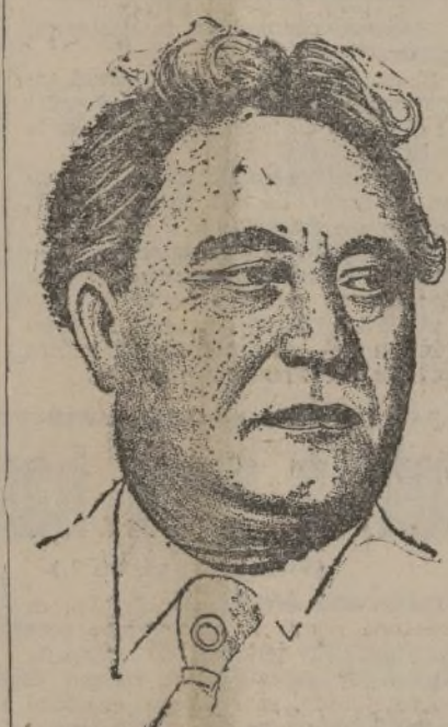
Galudo de las sabias teorías legadas por Marx, Engels y Lenin y su continuador, el gran Stalin, Jorge Dimitroff el magnífico timonel de la I. C., es hoy el dirigente más destacado y firme de solidaridad con nuestro pueblo, frente a la vacilación y cobardía de los falsos demócratas

El comandante nos ha prometido espontáneamente citar en la orden del día la grata visita del S. R. I. Las muchachas ponen una femenina solicitud en comunicarnos la sentida emoción que envuelve el docto obsequio.